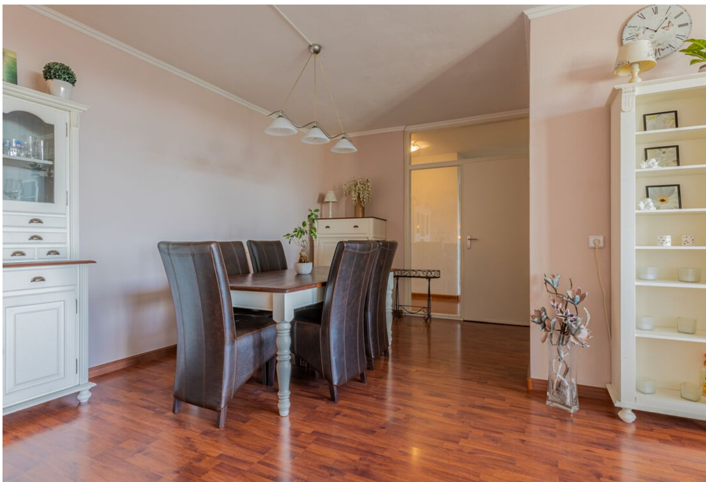
Lauwerszeeweg 45, Eindhoven