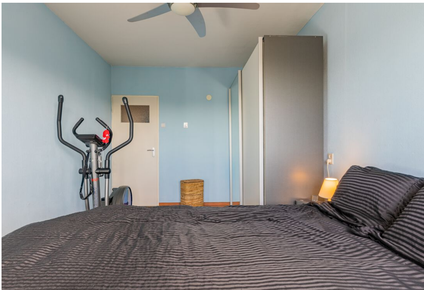
Lauwerszeeweg 45, Eindhoven