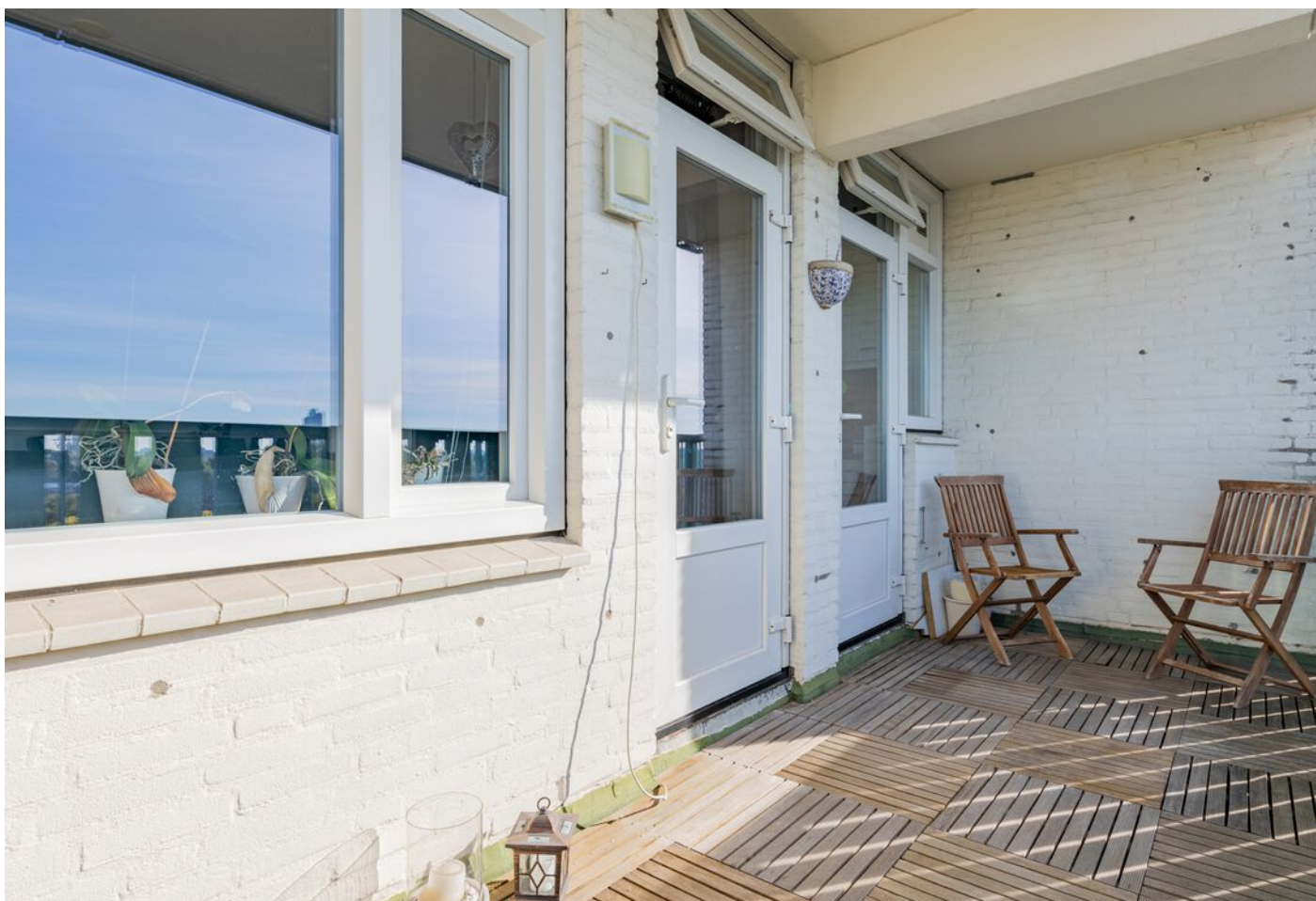
Lauwerszeeweg 45, Eindhoven