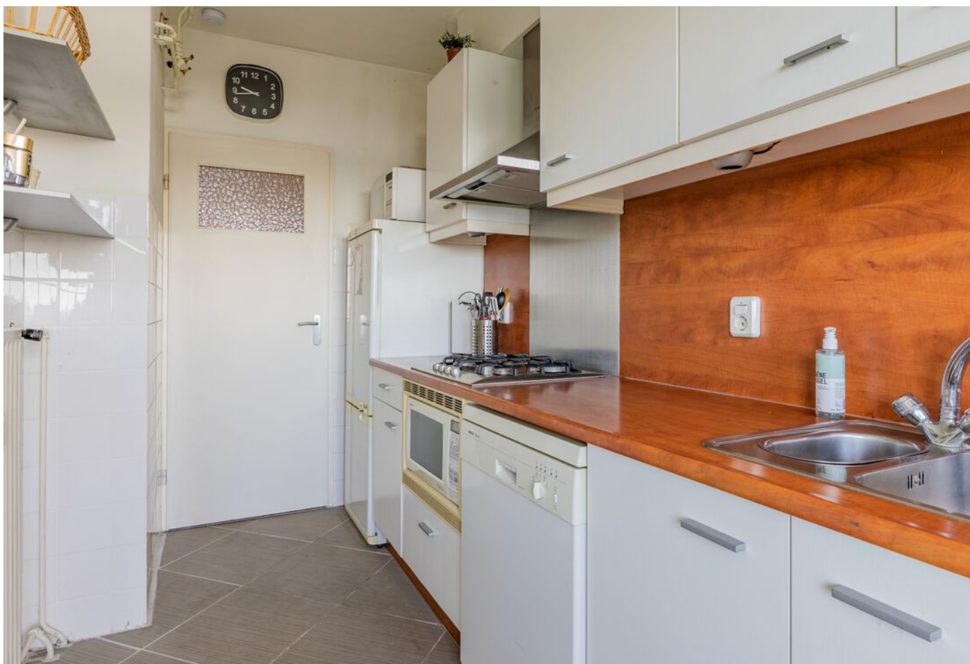
Lauwerszeeweg 45, Eindhoven