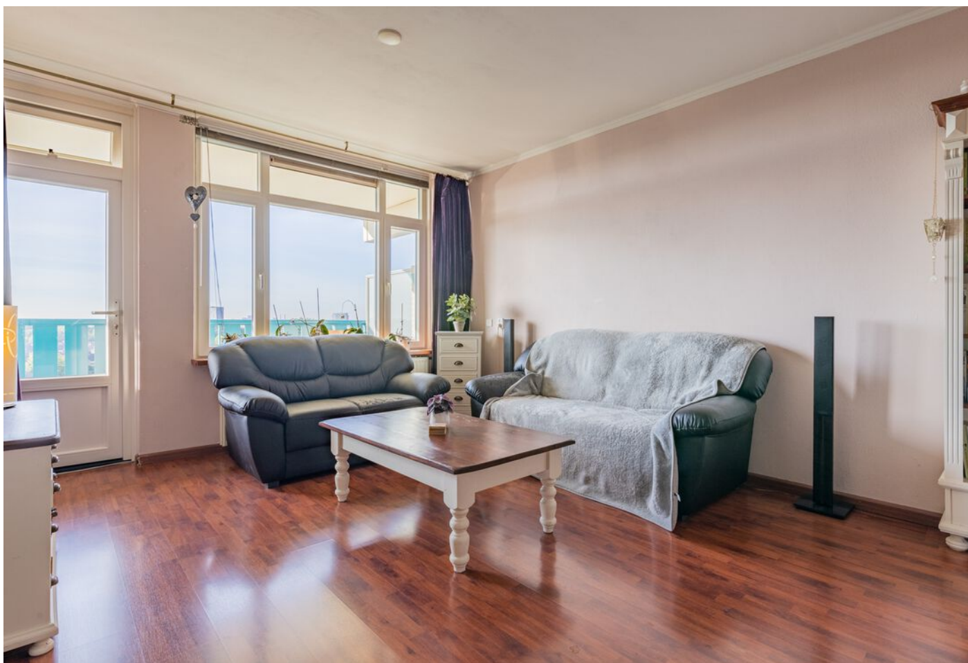
Lauwerszeeweg 45, Eindhoven