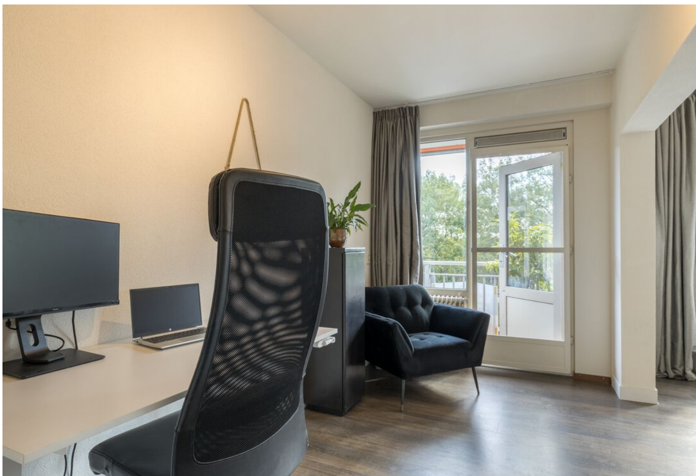
Kruiskampsingel 343, 's-Hertogenbosch