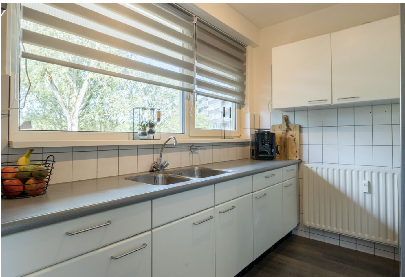
Kruiskampsingel 343, 's-Hertogenbosch