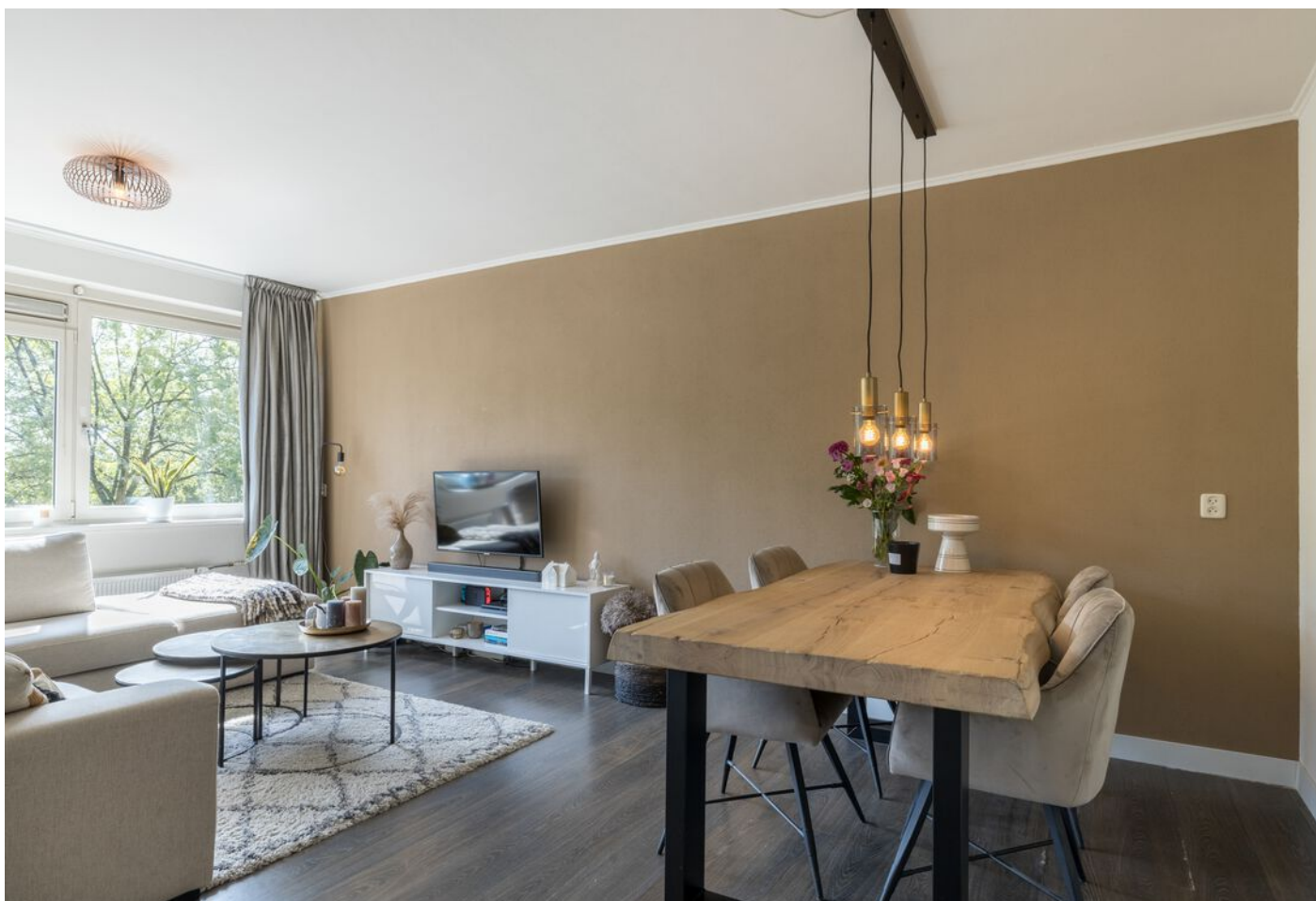
Kruiskampsingel 343, 's-Hertogenbosch