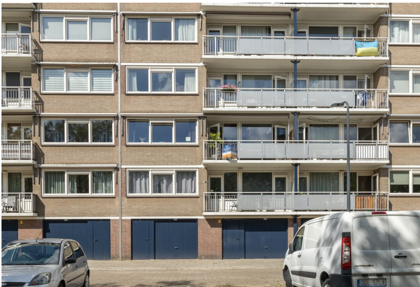
Kruiskampsingel 343, 's-Hertogenbosch