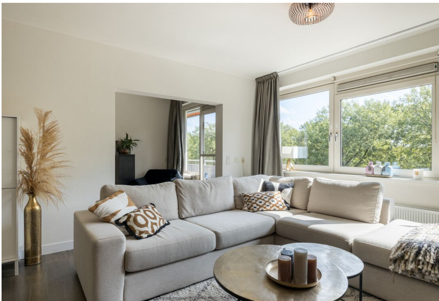
Kruiskampsingel 343, 's-Hertogenbosch