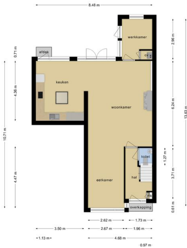
Deze plattegronden zijn opgemaakt voor indicatieve doeleinden.