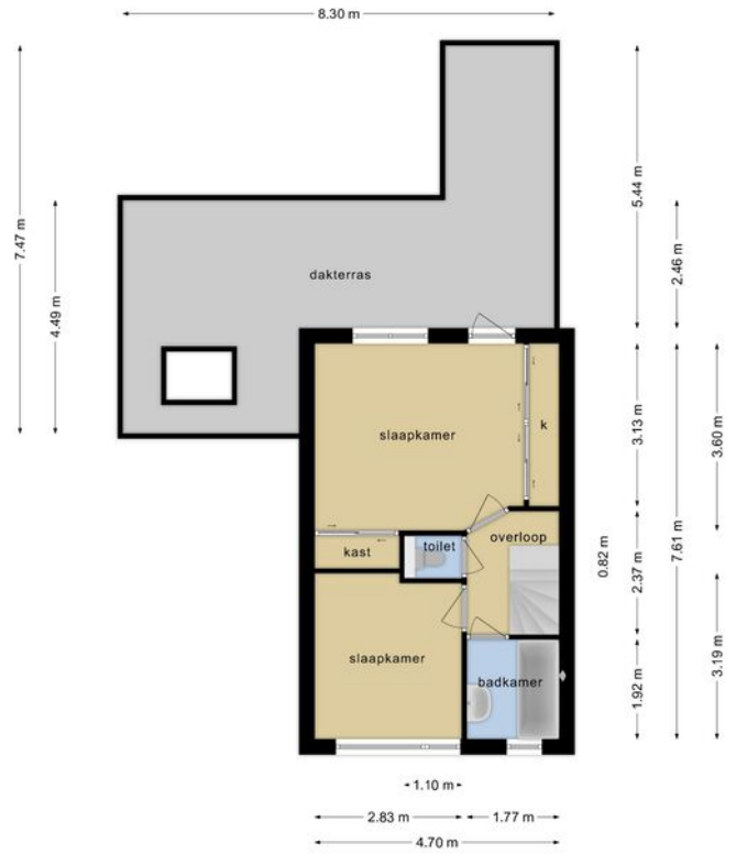
Deze plattegronden zijn opgemaakt voor indicatieve doeleinden.

Plattegronden zijn opgemaakt voor indicatieve doeleinden. Hieraan kunnen geen rechten worden ontleend.