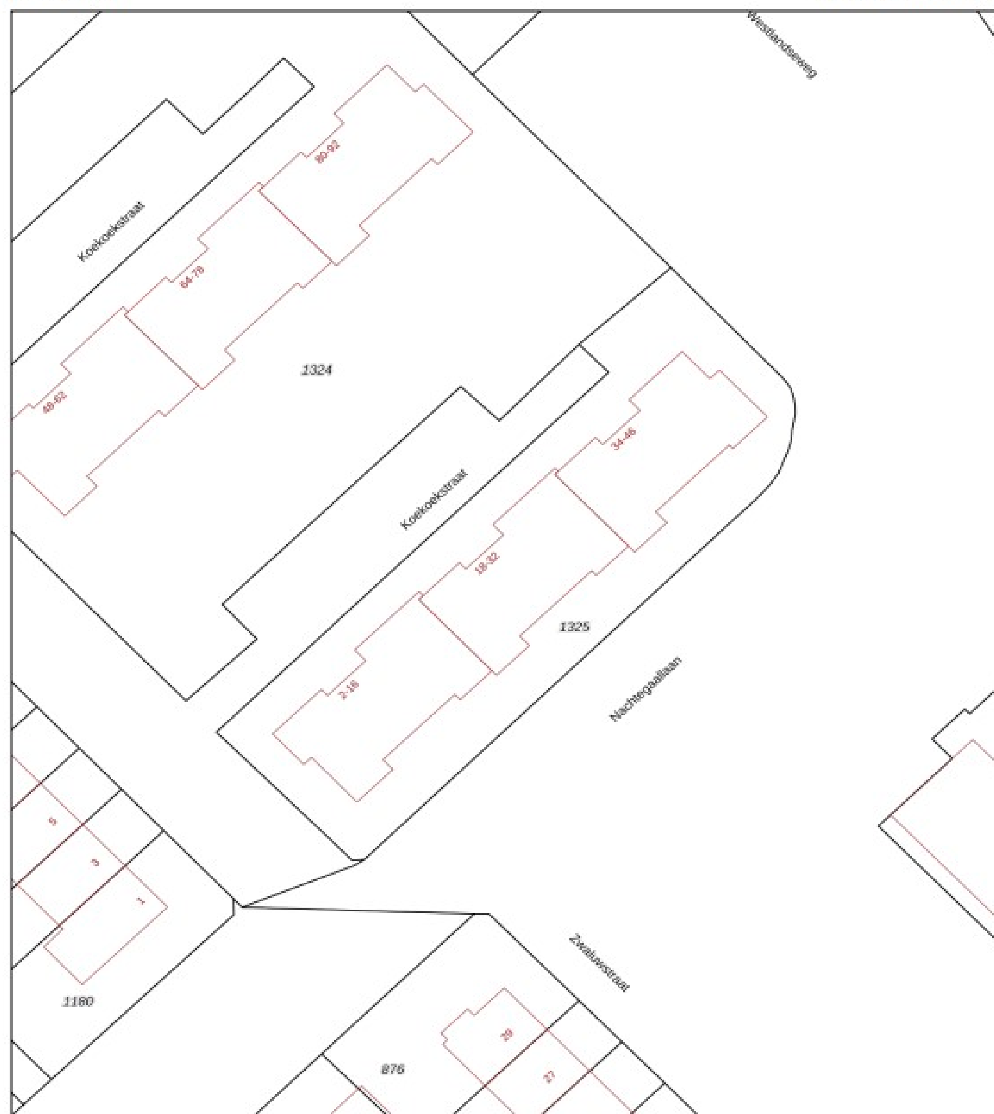
Uw referentie: Koekoekstraat