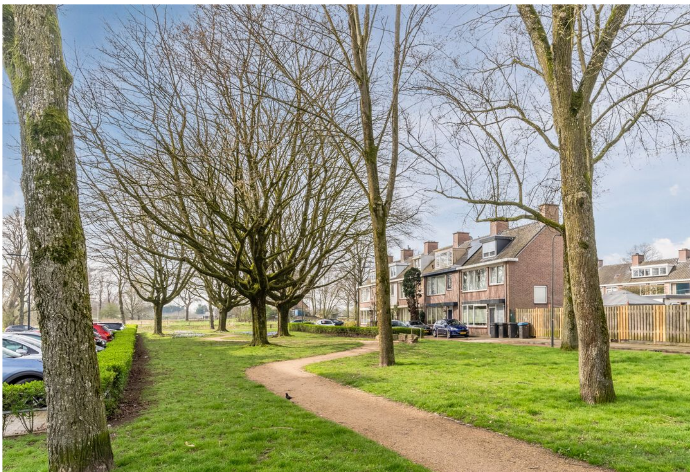
Hudsonlaan 86, 's-Hertogenbosch