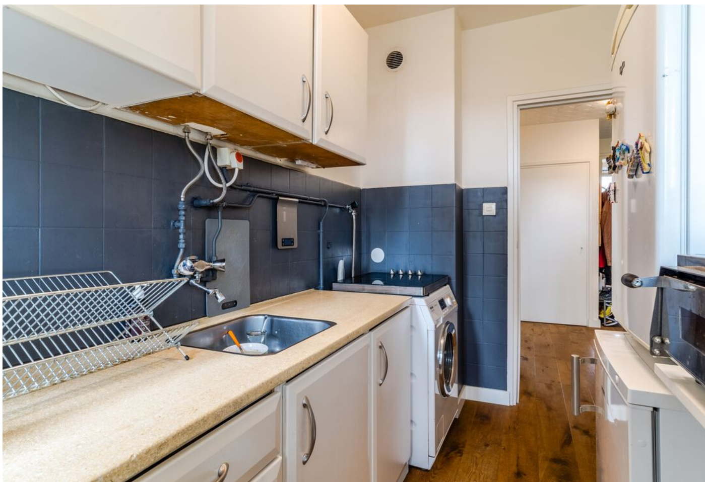
Hudsonlaan 86, 's-Hertogenbosch