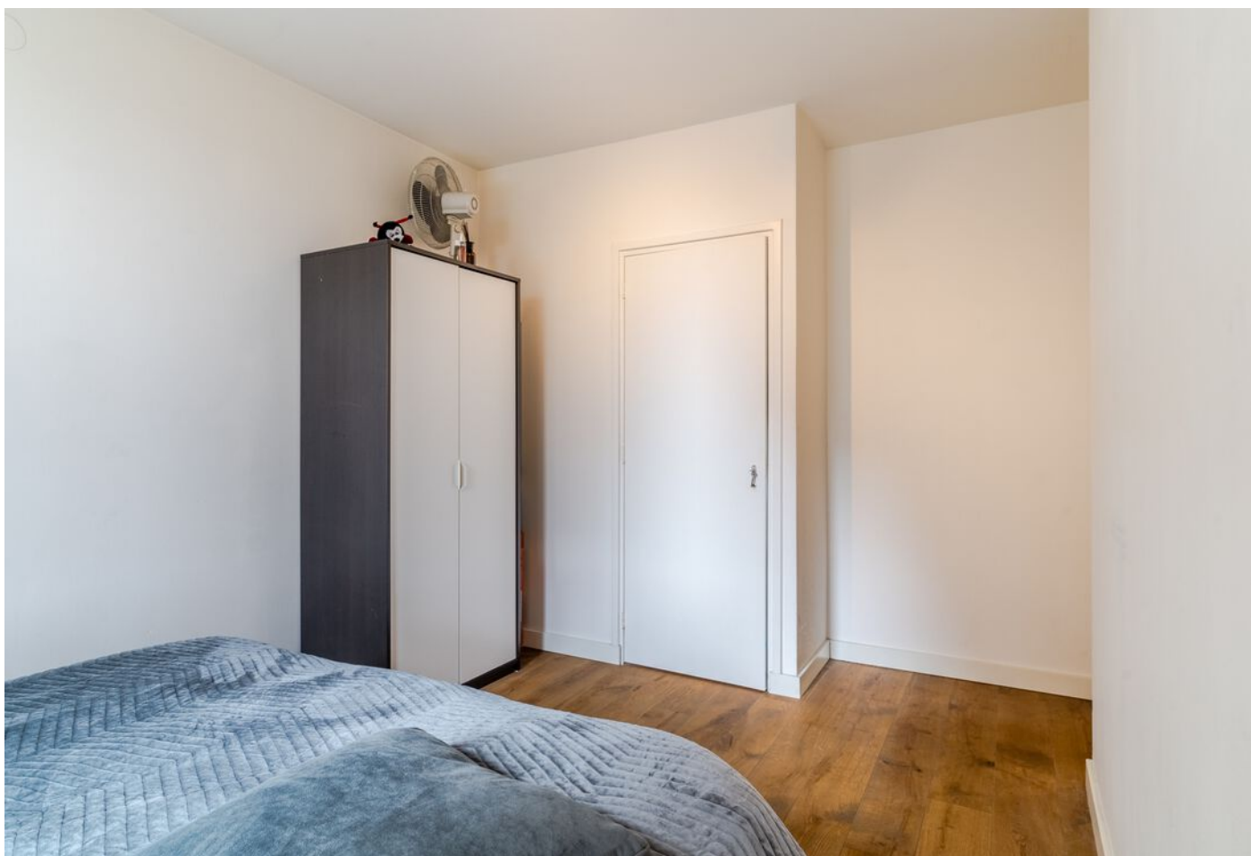
Hudsonlaan 86, 's-Hertogenbosch