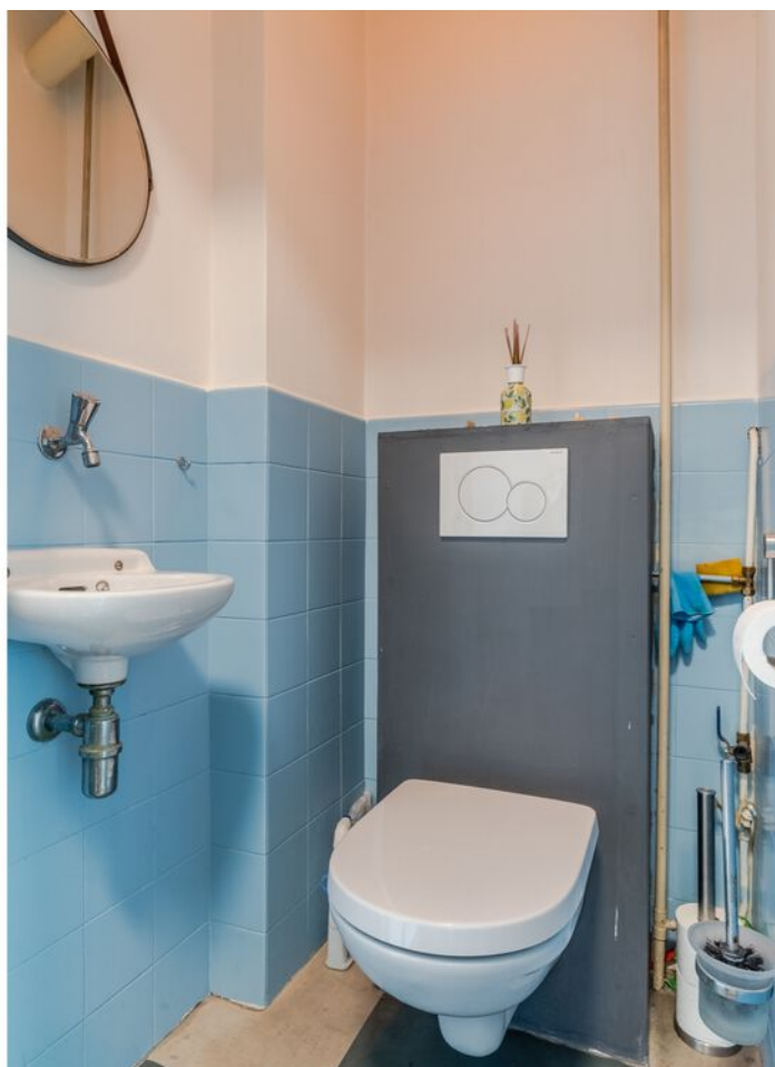
Hudsonlaan 86, 's-Hertogenbosch