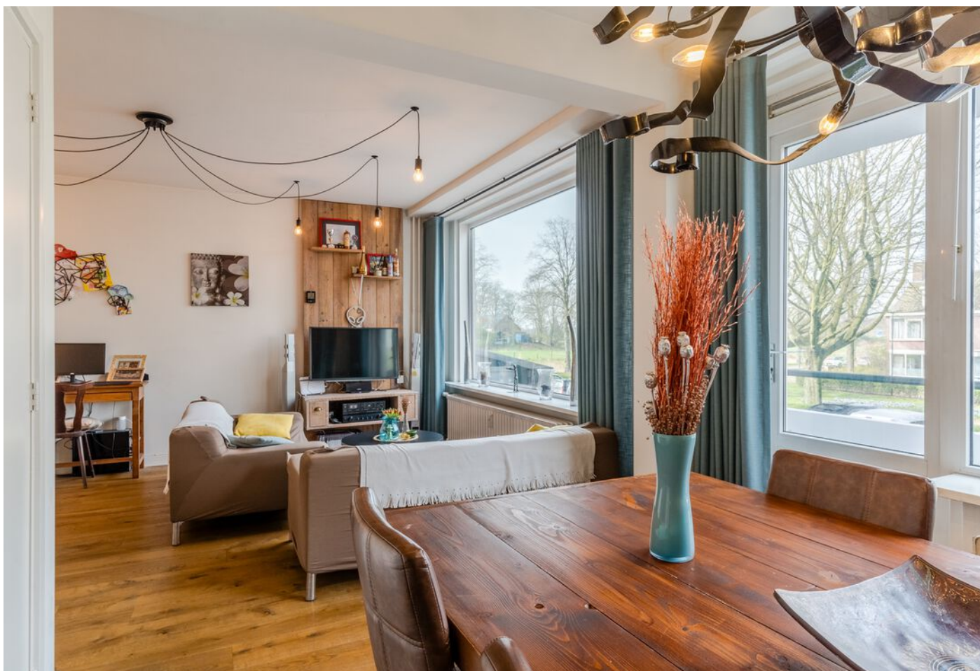
Hudsonlaan 86, 's-Hertogenbosch