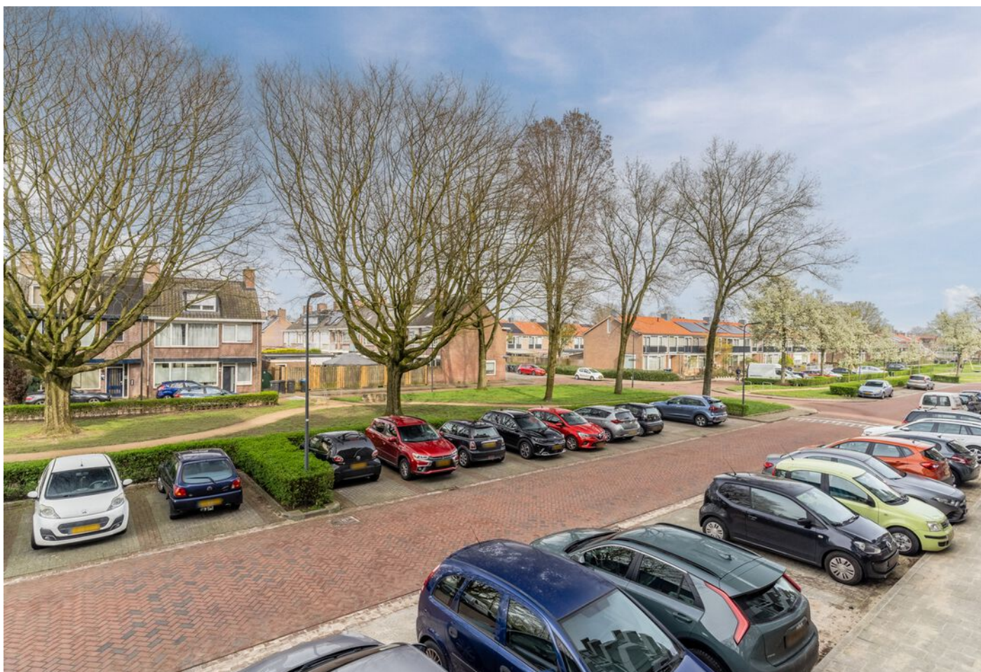
Hudsonlaan 86, 's-Hertogenbosch