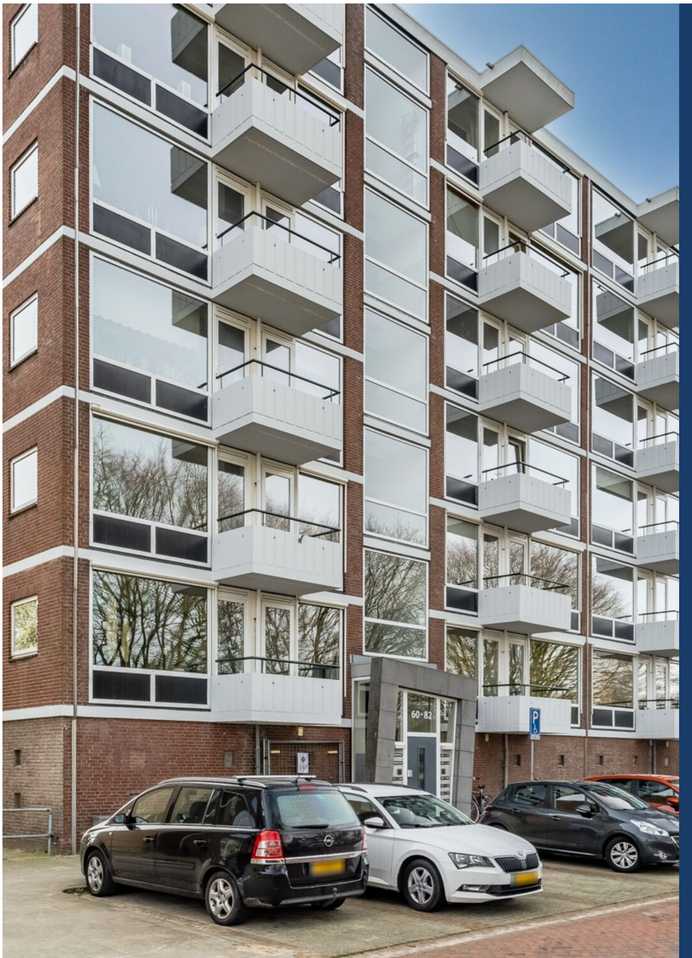
Hudsonlaan 86, 's-Hertogenbosch