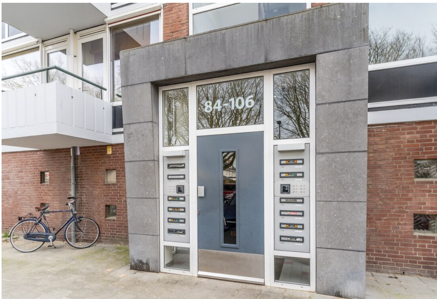
Hudsonlaan 86, 's-Hertogenbosch