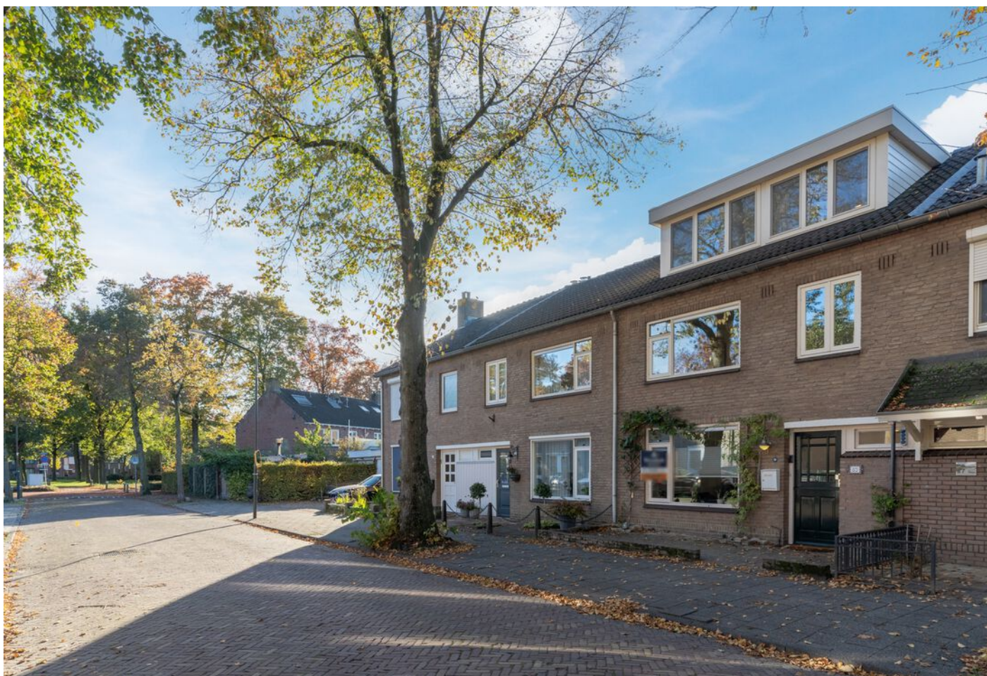
Hoogstraat 89, Vught