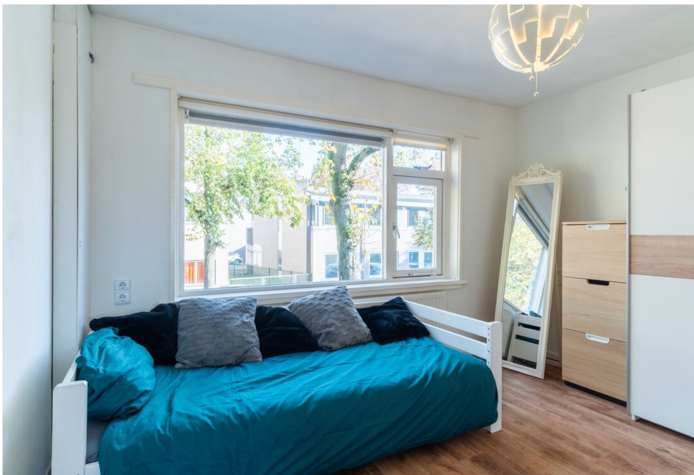
Hoogstraat 89, Vught