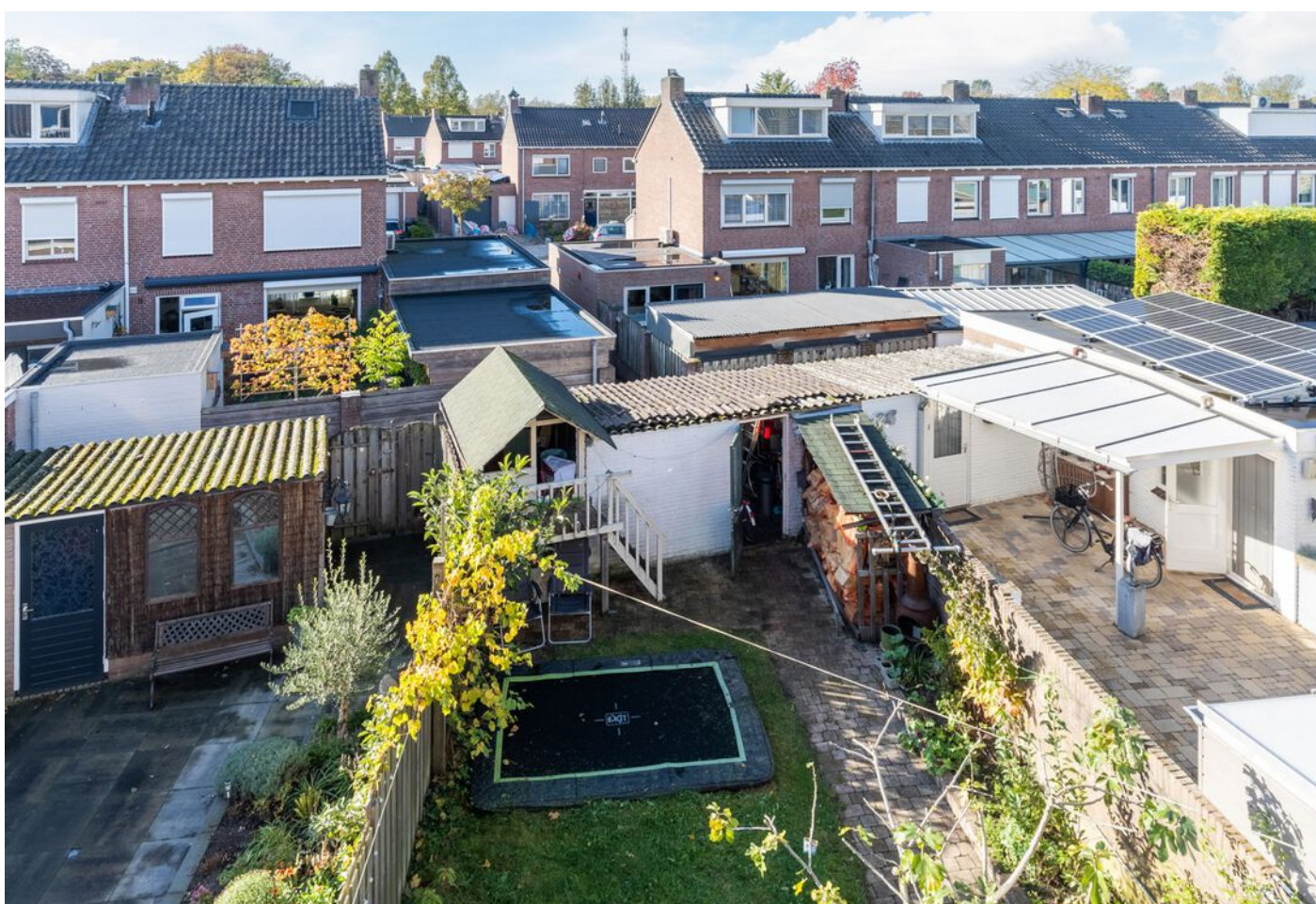
Hoogstraat 89, Vught