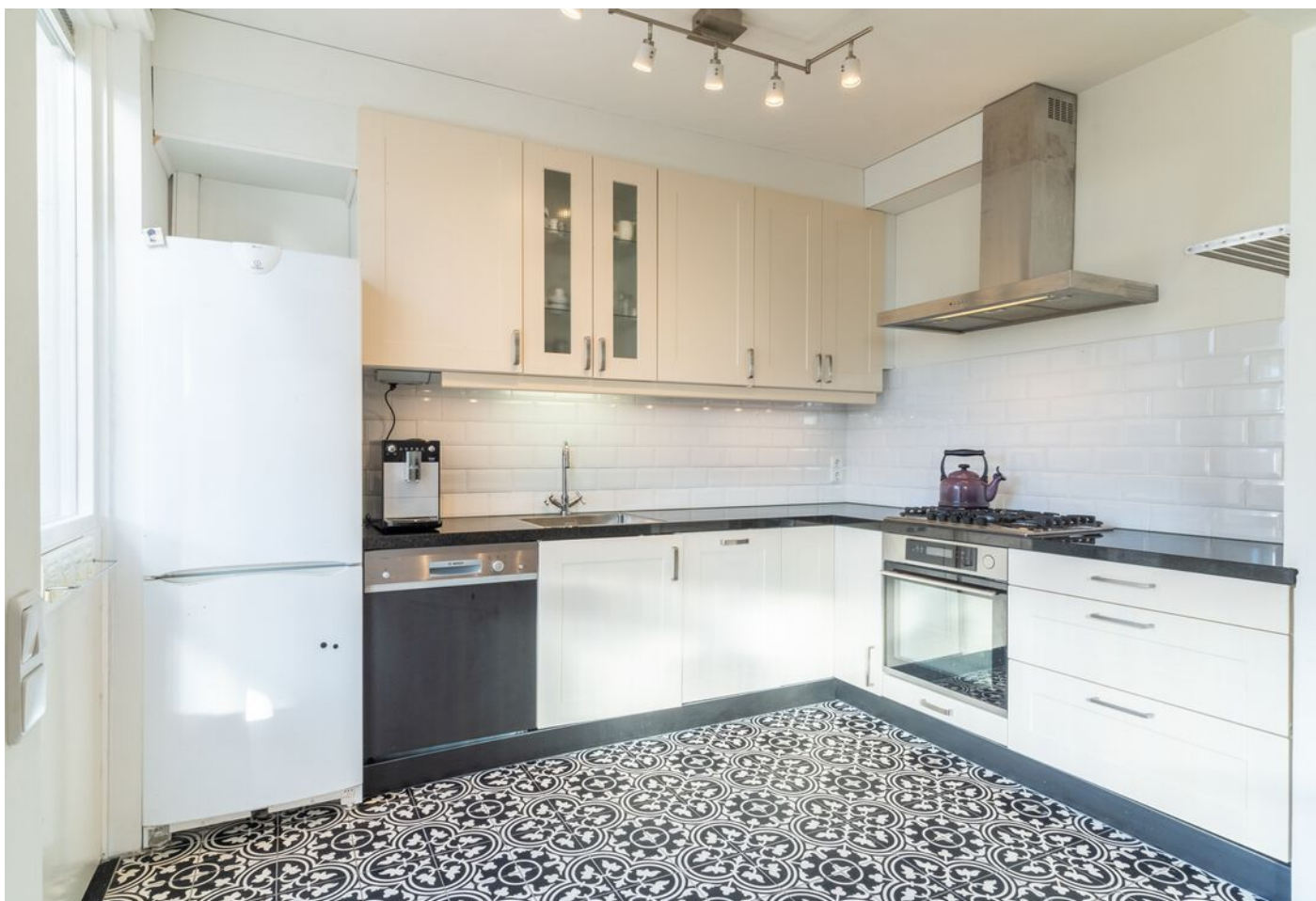
Hoogstraat 89, Vught