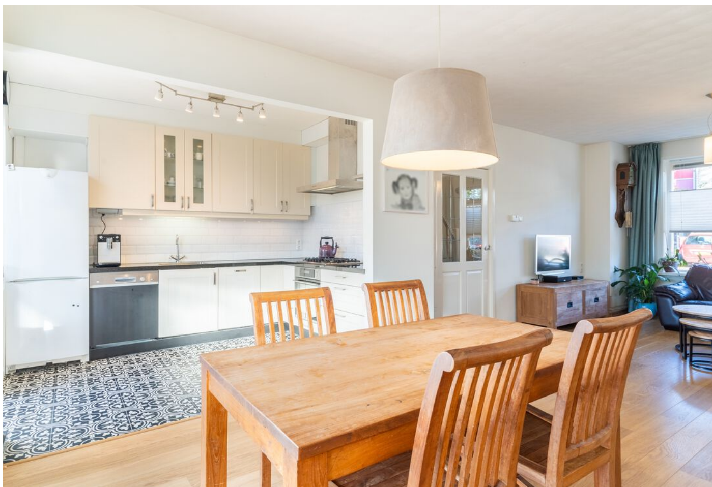
Hoogstraat 89, Vught