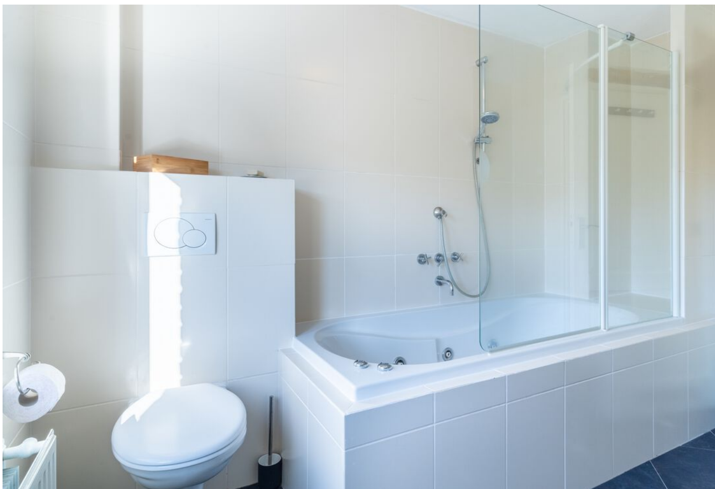
Hoogstraat 89, Vught