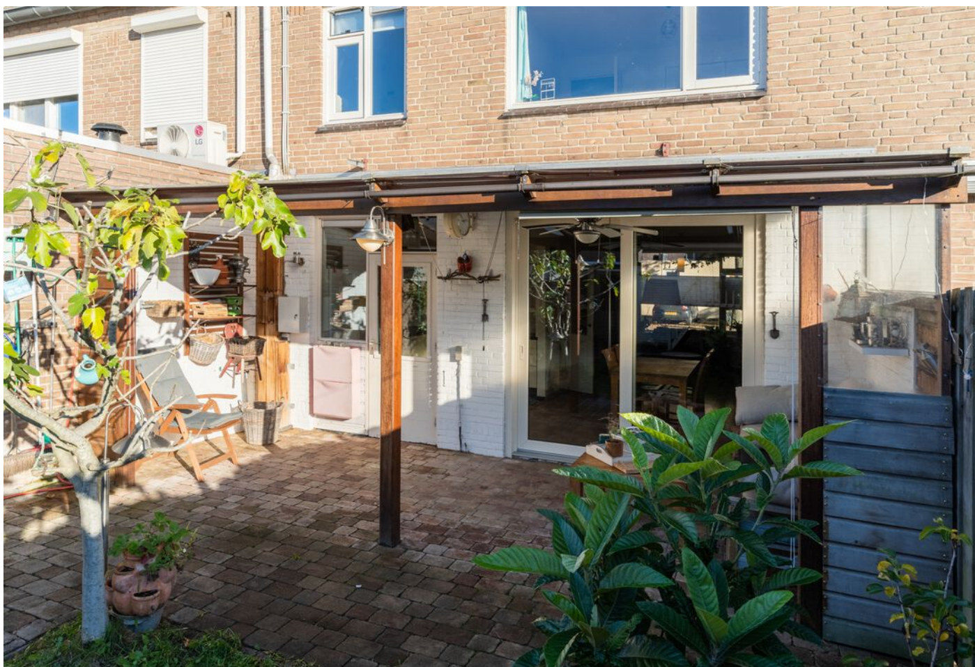
Hoogstraat 89, Vught