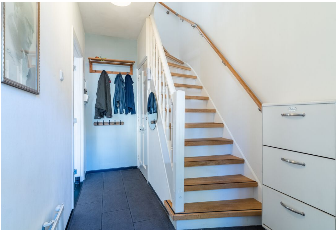
Hoogstraat 89, Vught