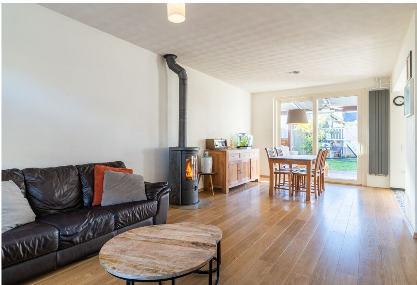
Hoogstraat 89, Vught