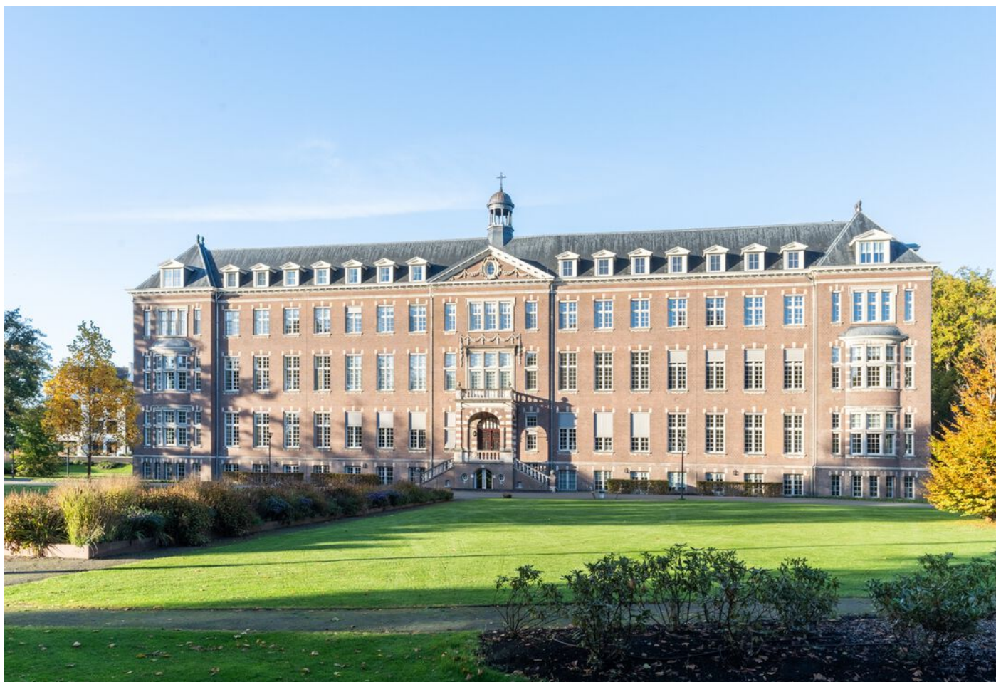
Hoogstraat 89, Vught