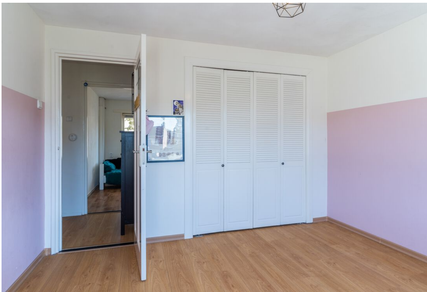
Hoogstraat 89, Vught