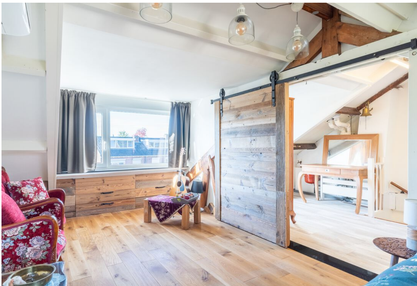
Hoogstraat 89, Vught