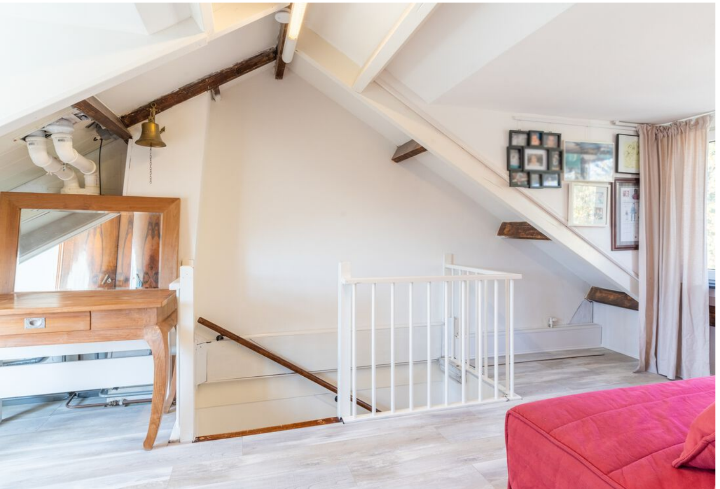
Hoogstraat 89, Vught