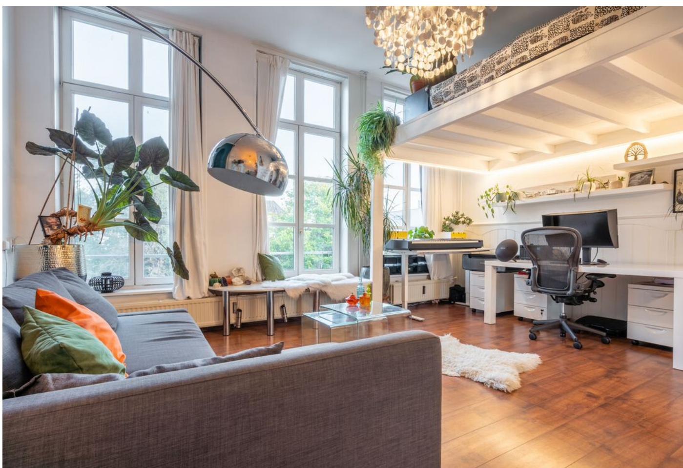
Hinthamereinde 49, 's-Hertogenbosch