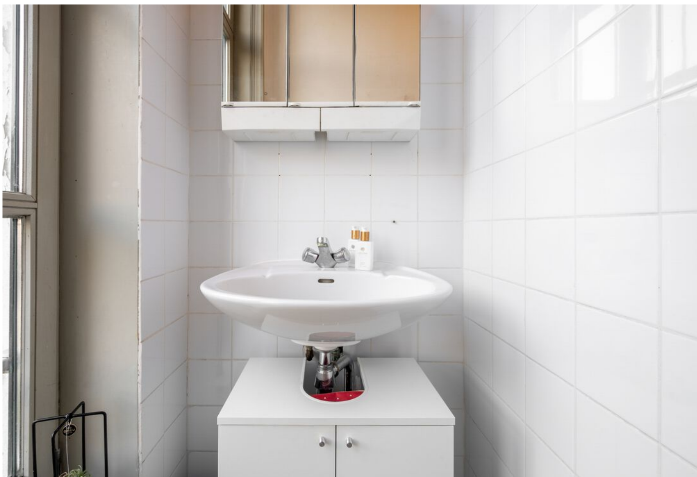
Hinthamereinde 49, 's-Hertogenbosch