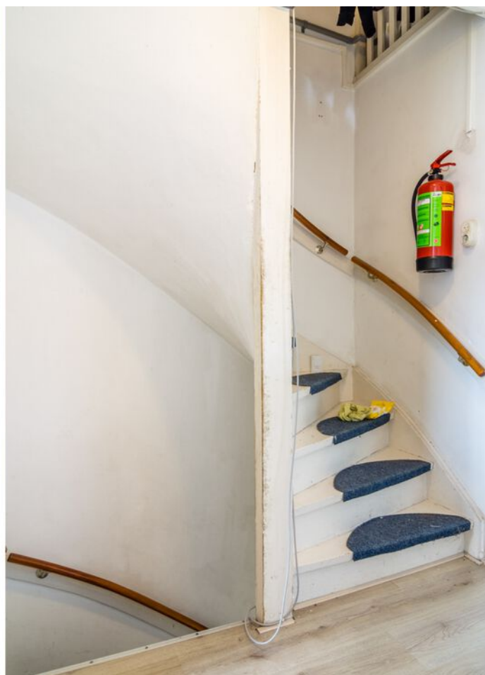
Heeghtakker 23, Eindhoven