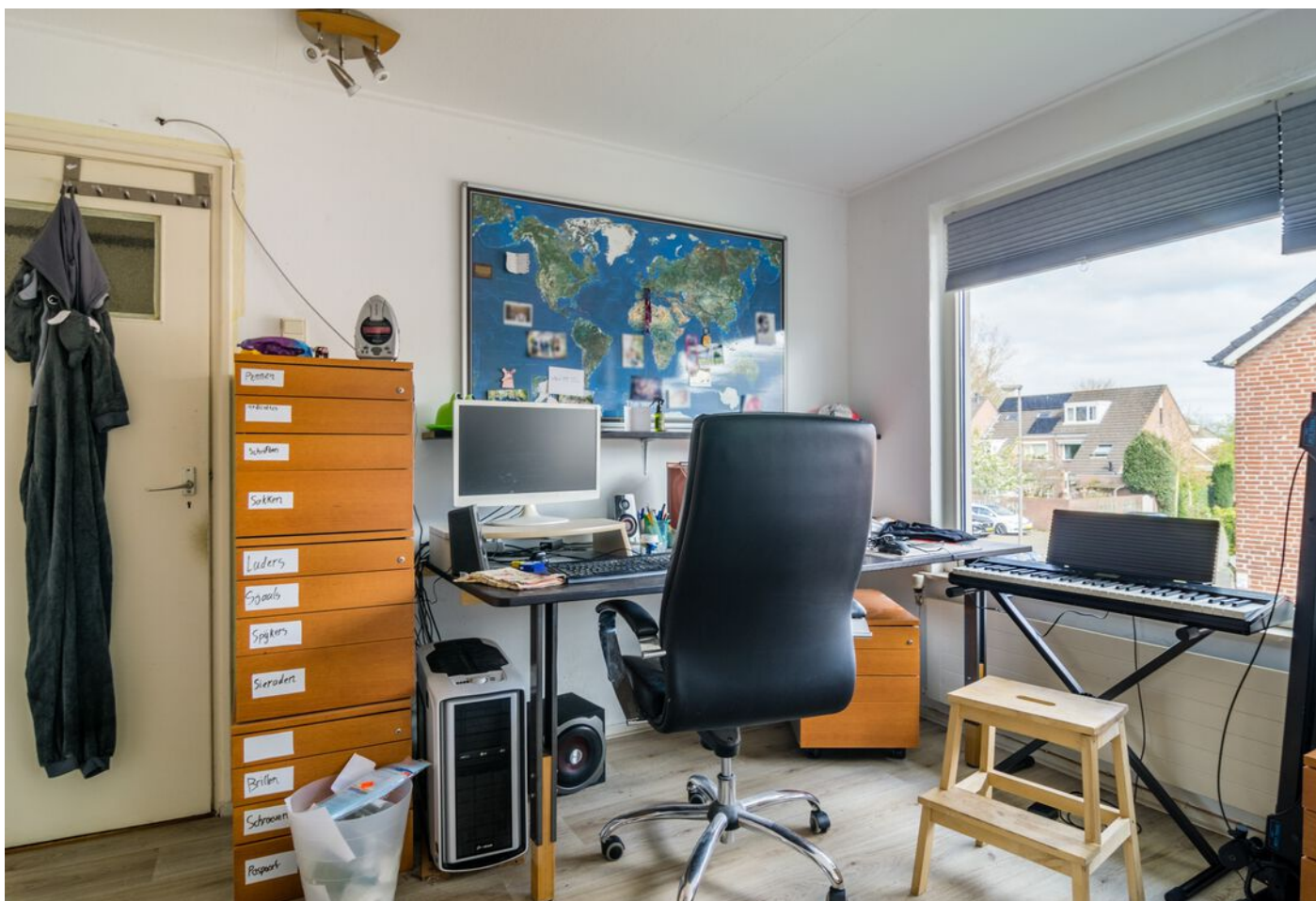
Heeghtakker 23, Eindhoven