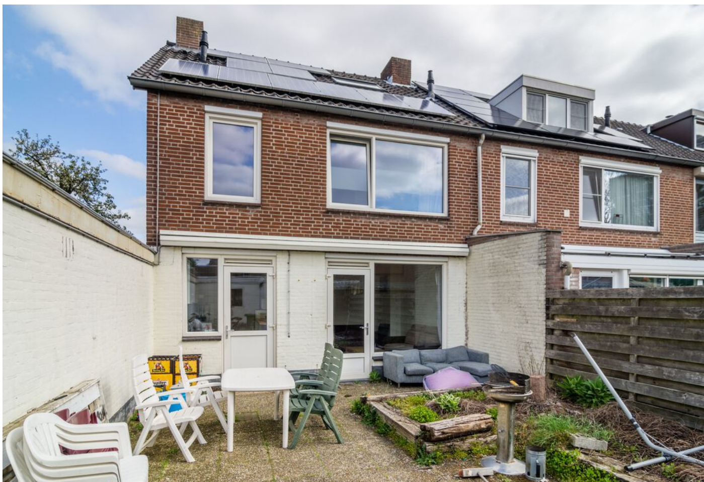
Heeghtakker 23, Eindhoven