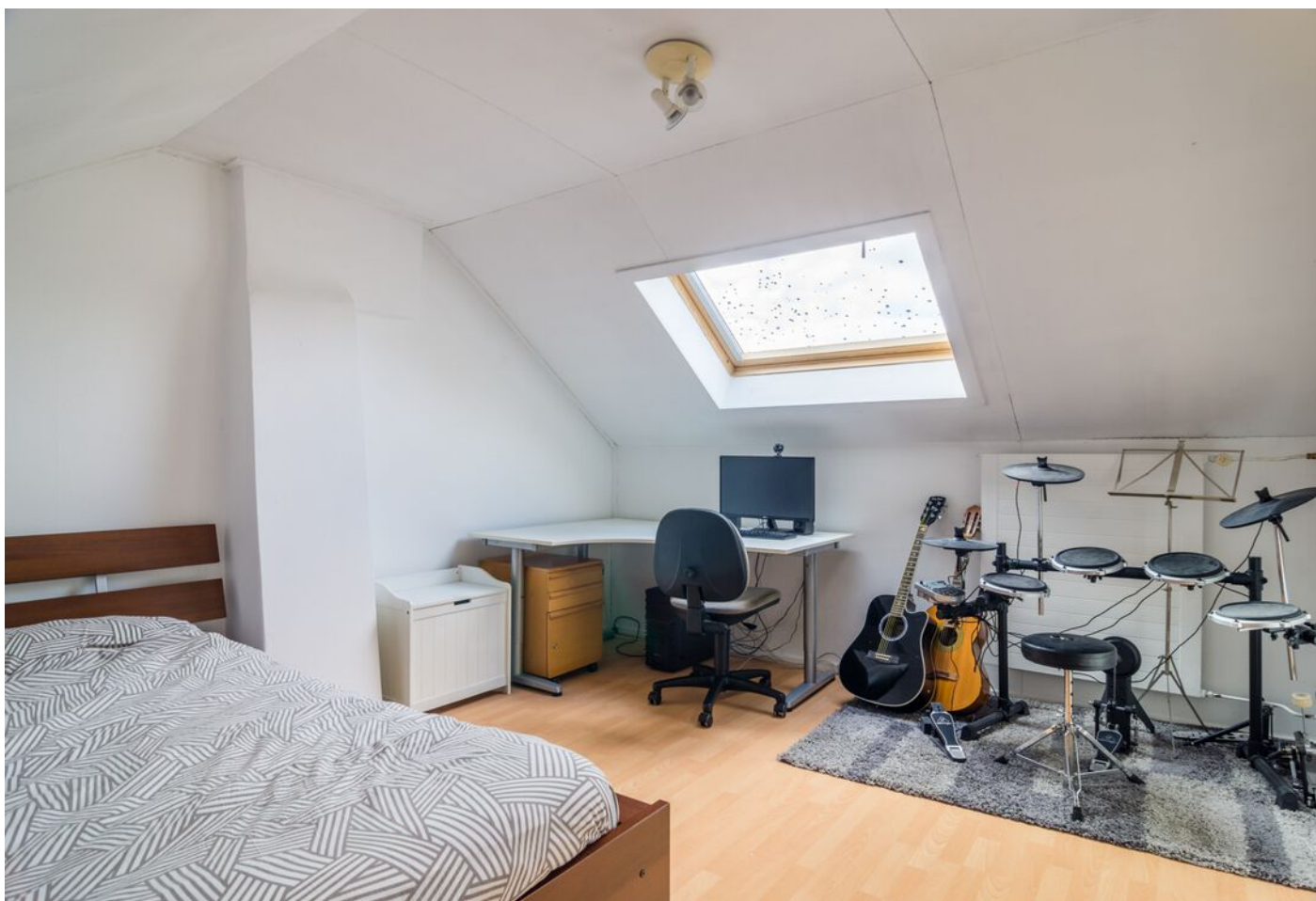
Heeghtakker 23, Eindhoven