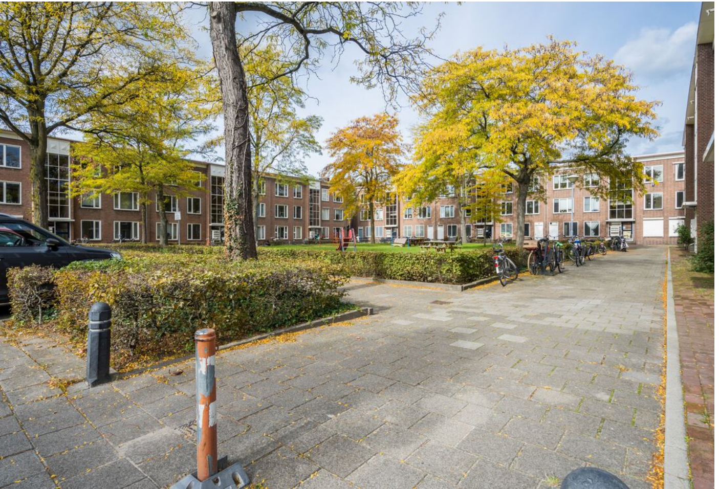
Hadewychstraat 108, 's-Hertogenbosch