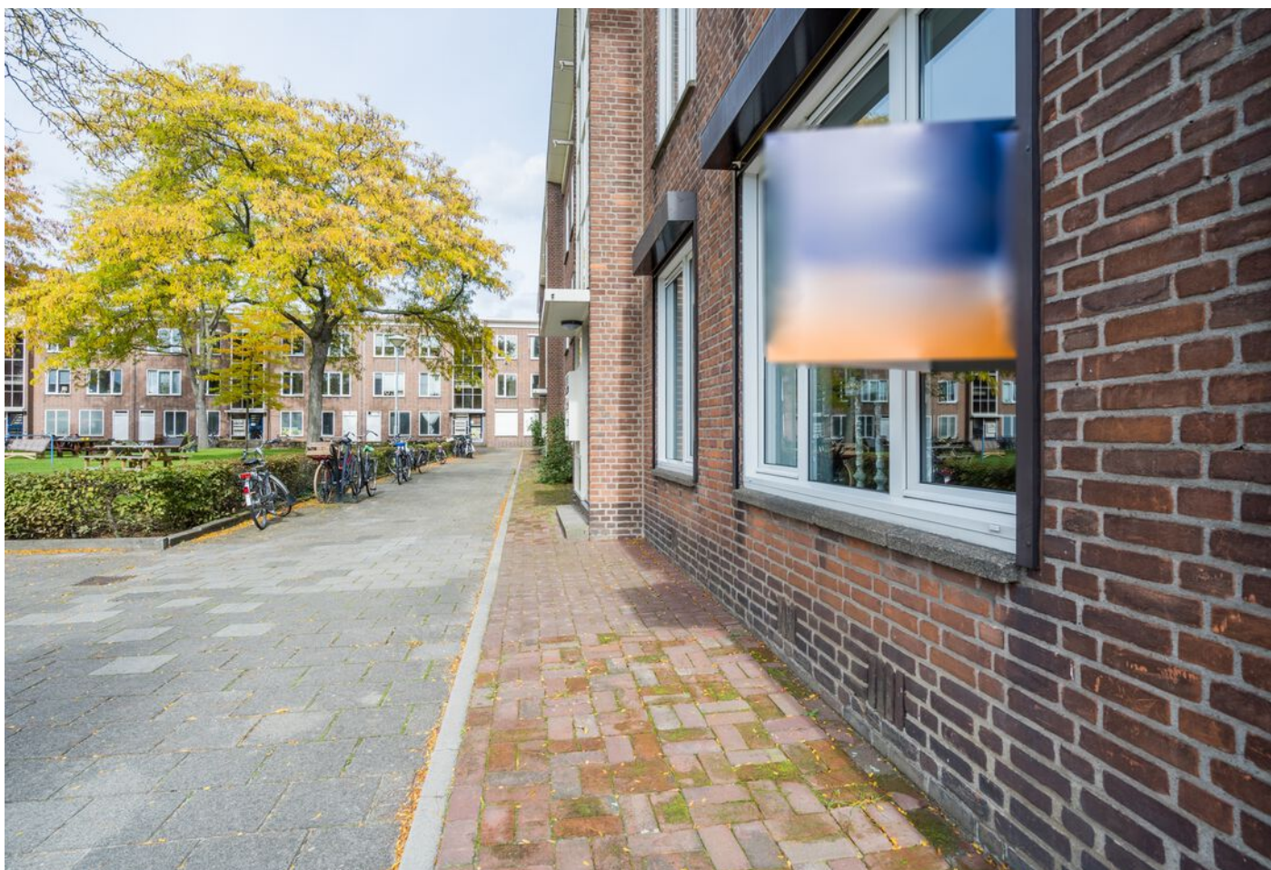
Hadewychstraat 108, 's-Hertogenbosch