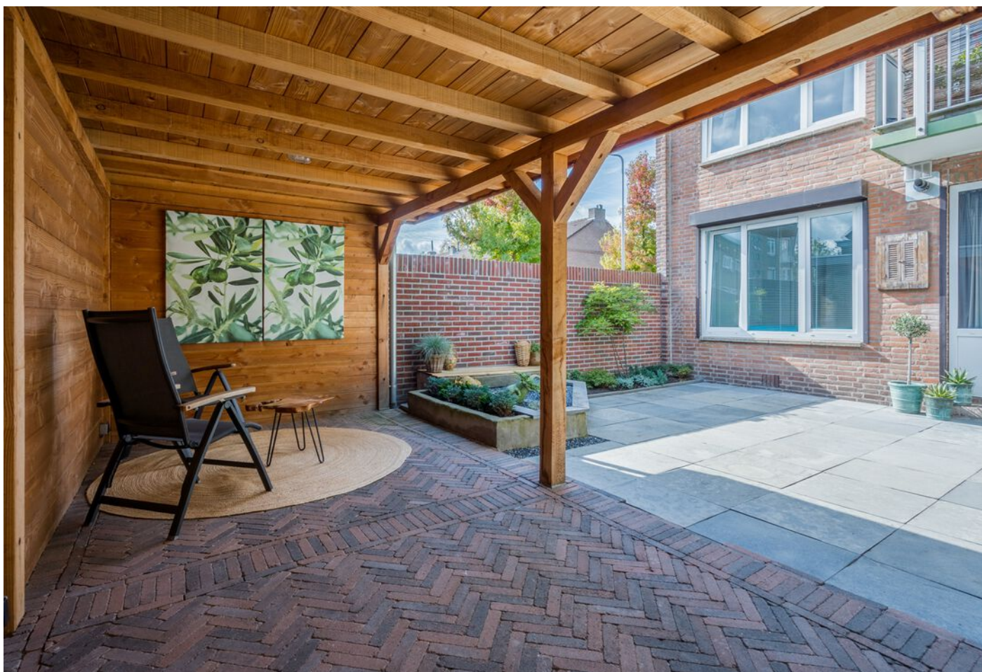
Hadewychstraat 108, 's-Hertogenbosch