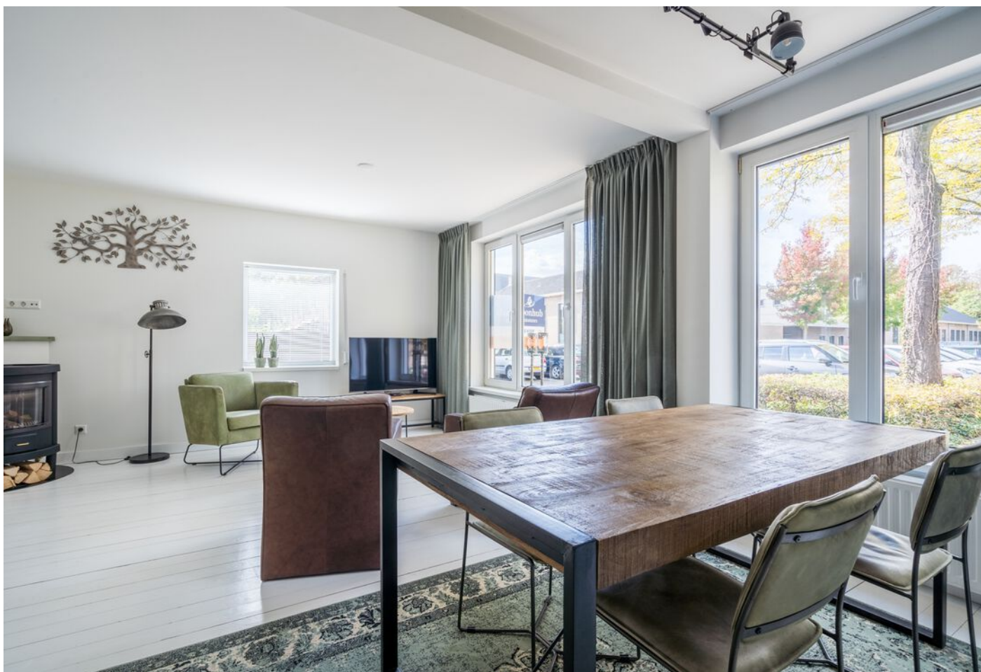
Hadewychstraat 108, 's-Hertogenbosch