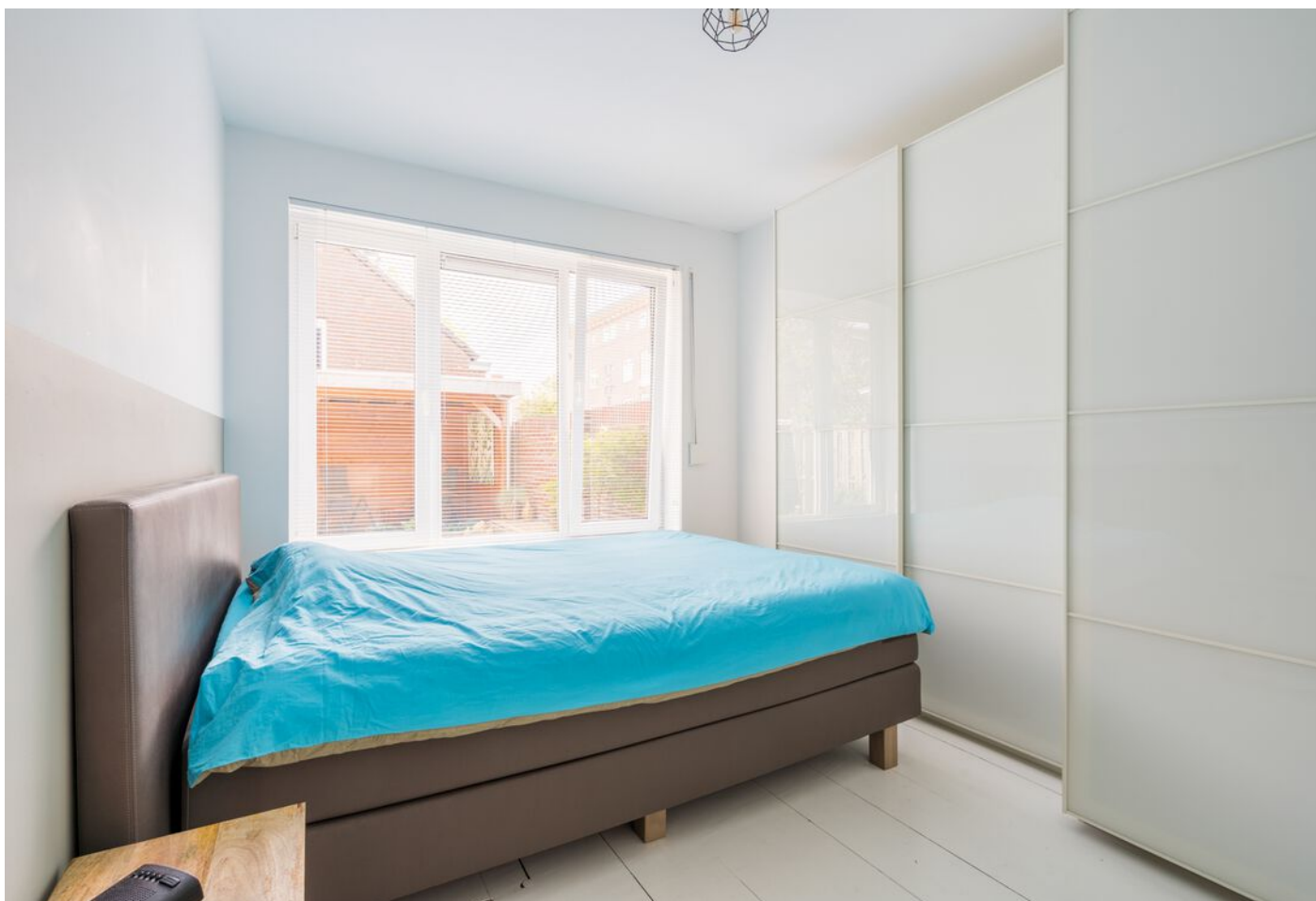
Hadewychstraat 108, 's-Hertogenbosch