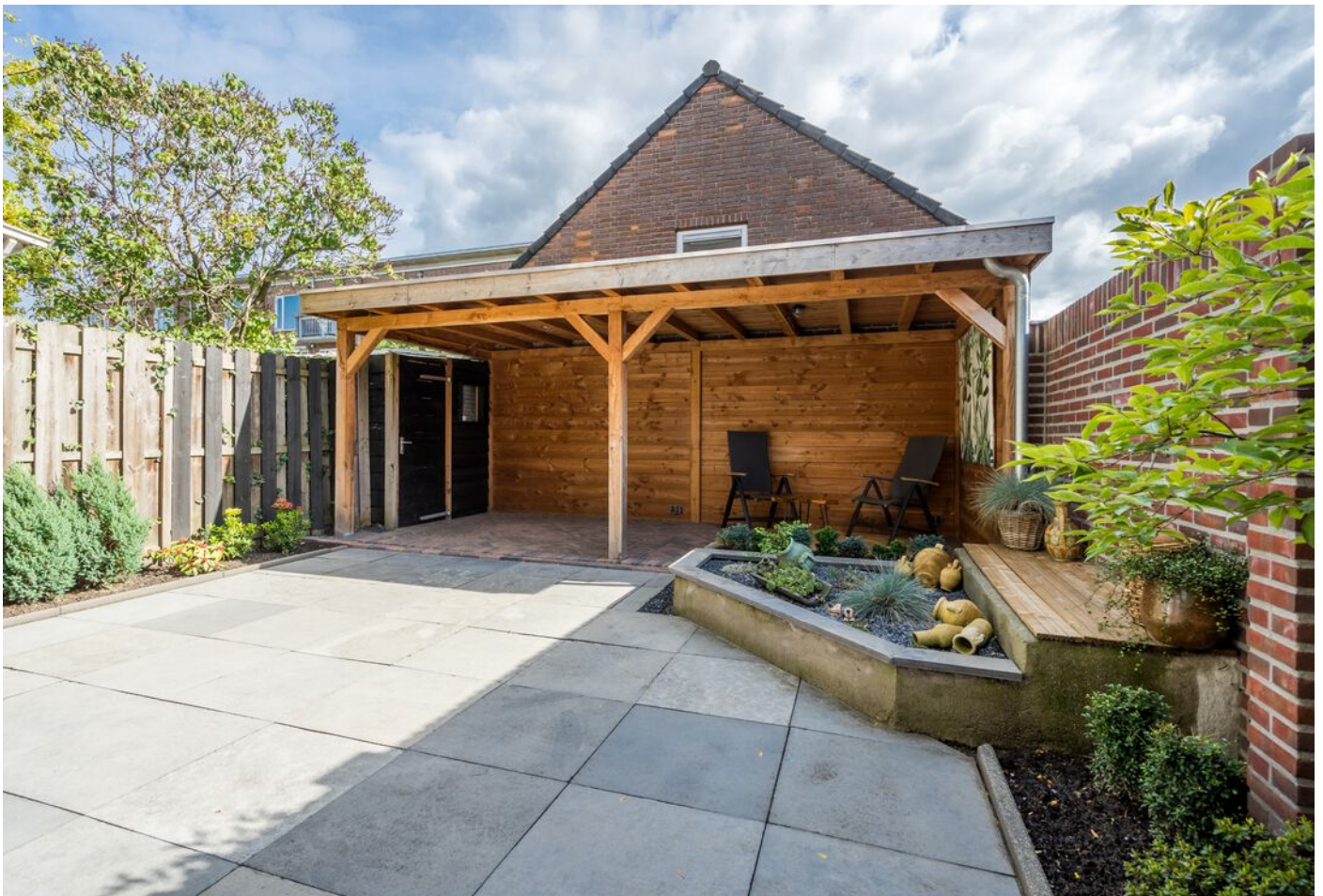
Hadewychstraat 108, 's-Hertogenbosch