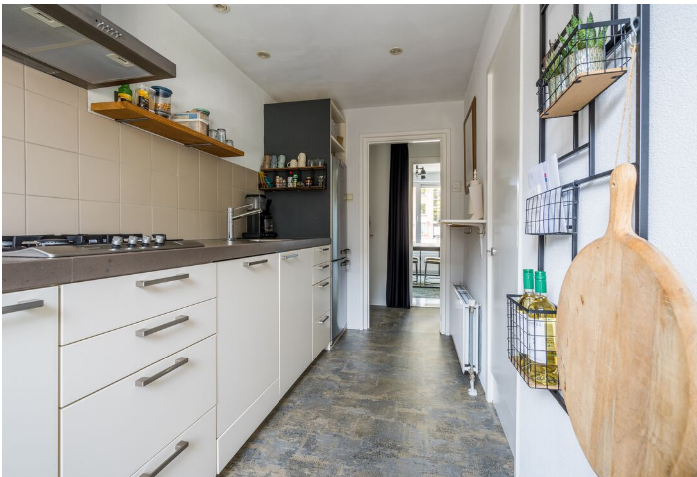
Hadewychstraat 108, 's-Hertogenbosch