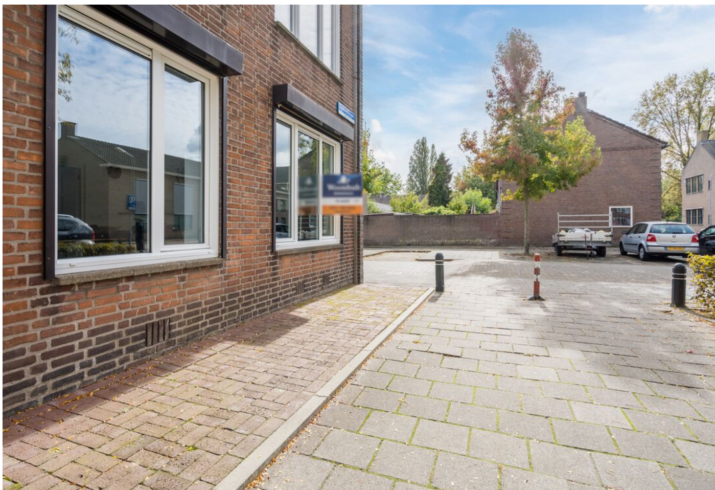
Hadewychstraat 108, 's-Hertogenbosch