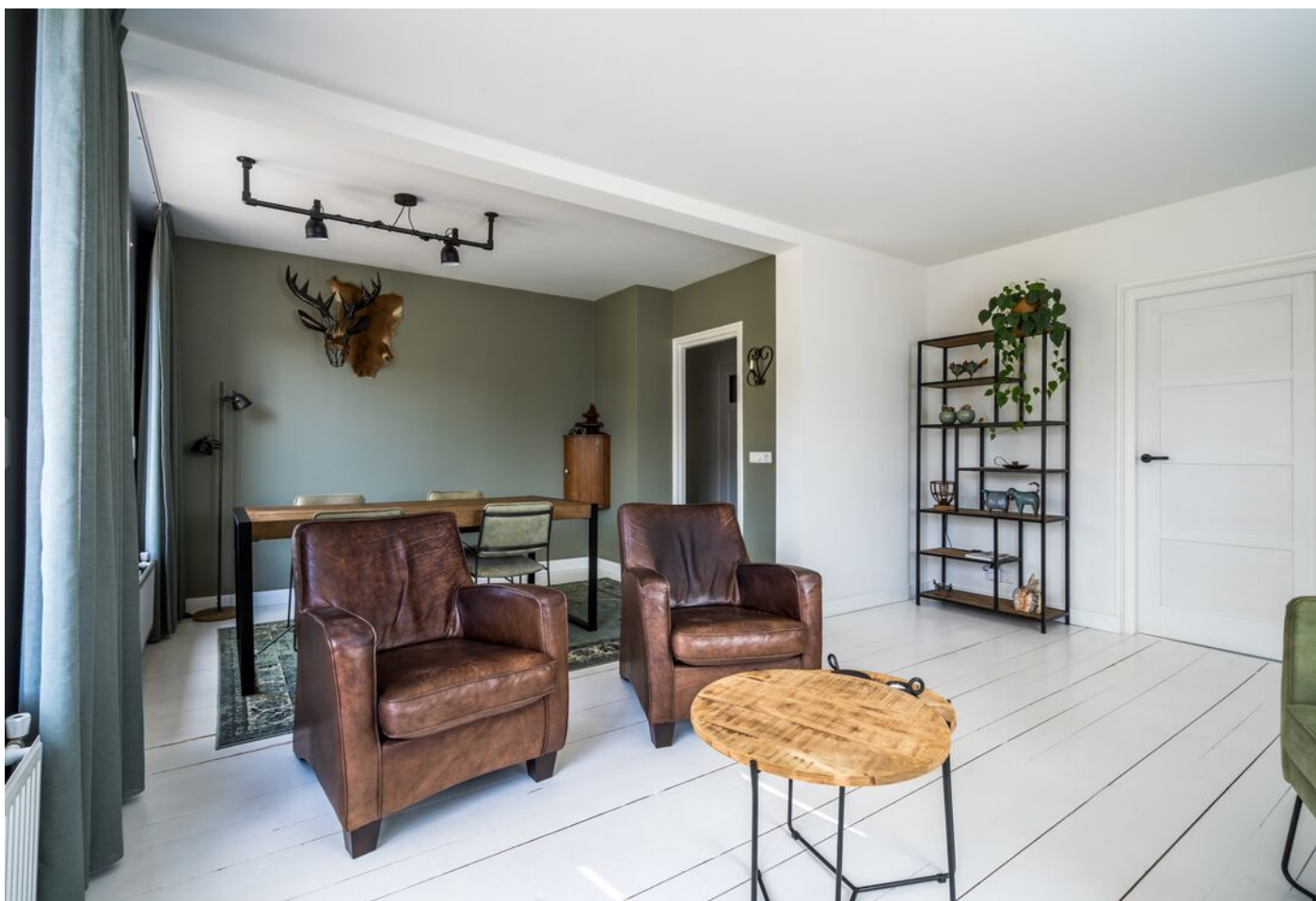
Hadewychstraat 108, 's-Hertogenbosch