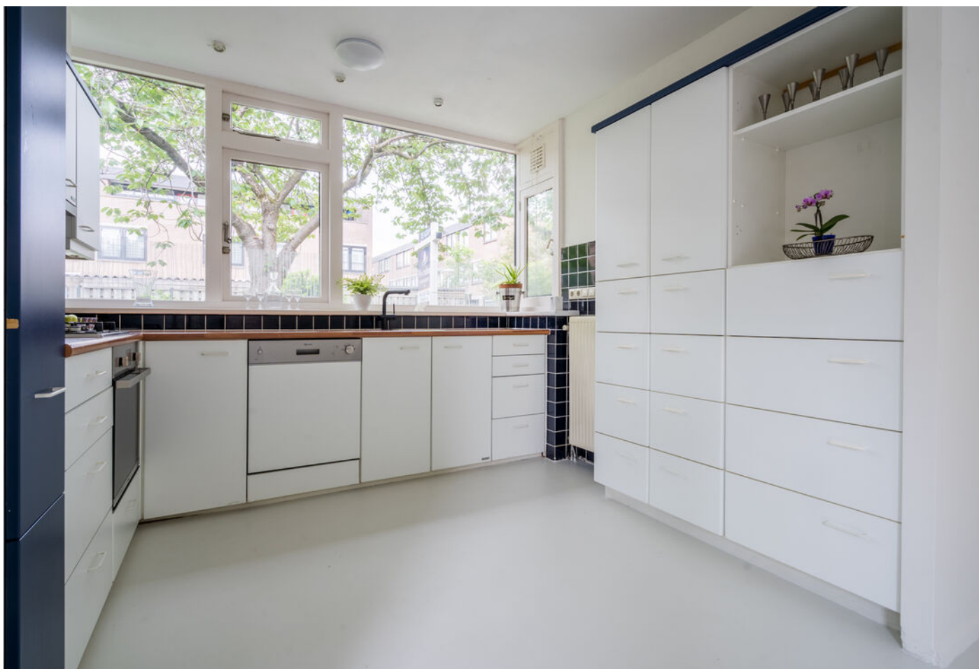
Grevenmacherhof 17, Eindhoven