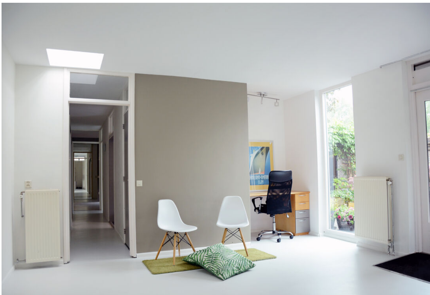
Grevenmacherhof 17, Eindhoven