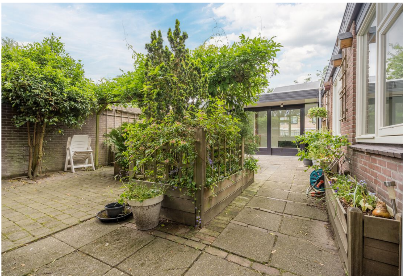
Grevenmacherhof 17, Eindhoven