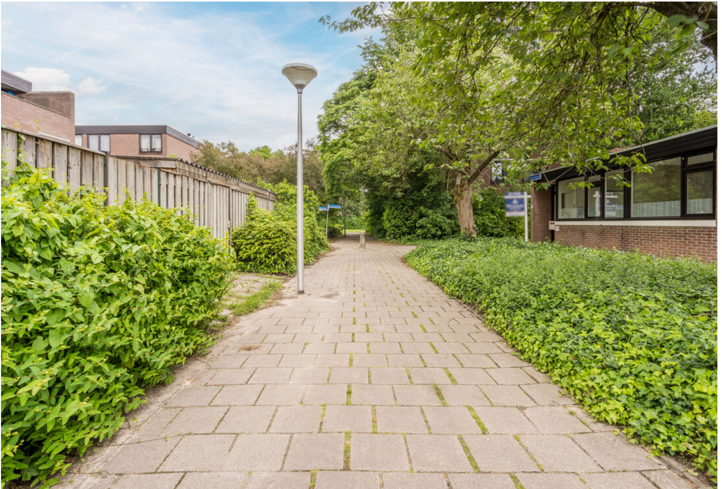
Grevenmacherhof 17, Eindhoven