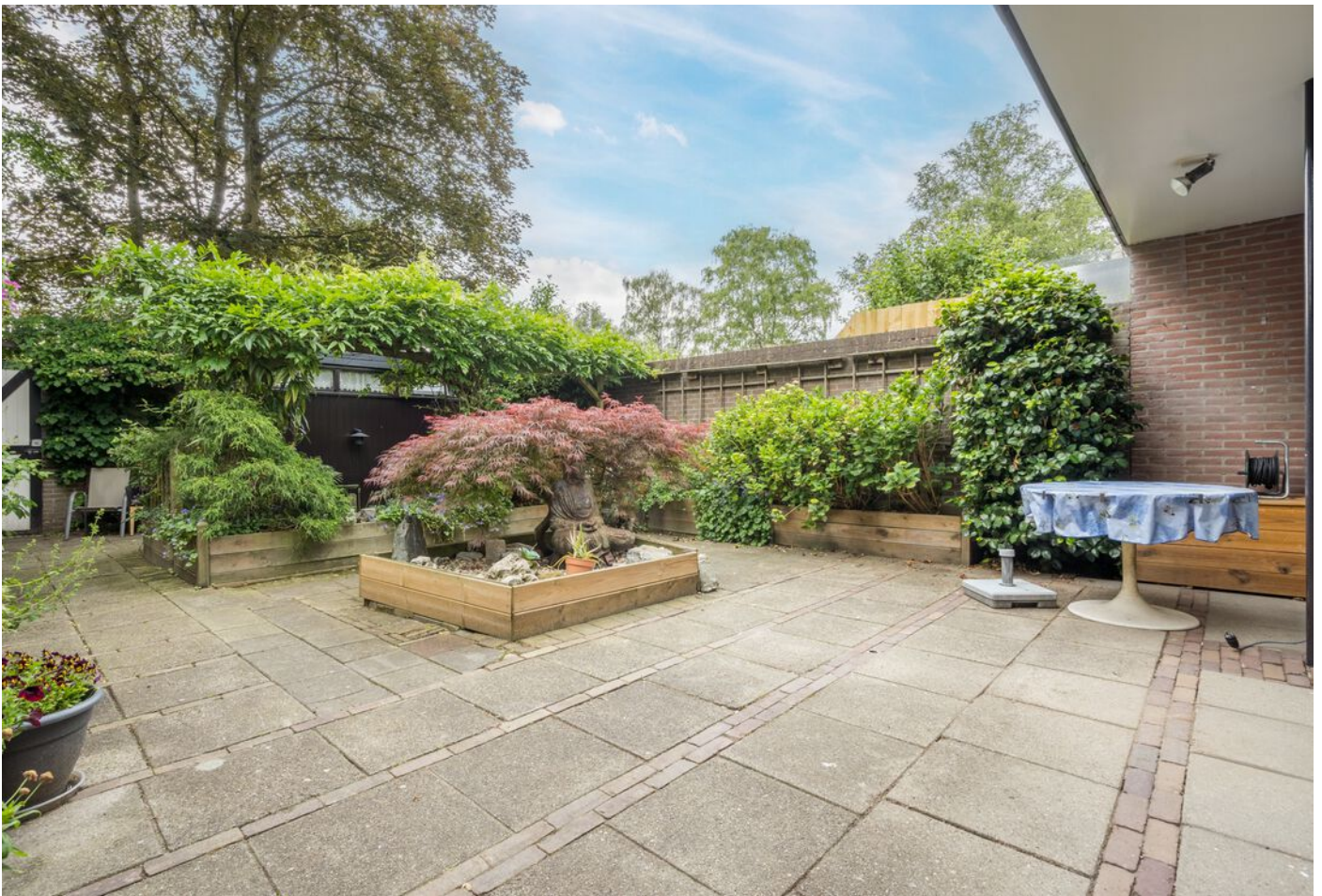
Grevenmacherhof 17, Eindhoven