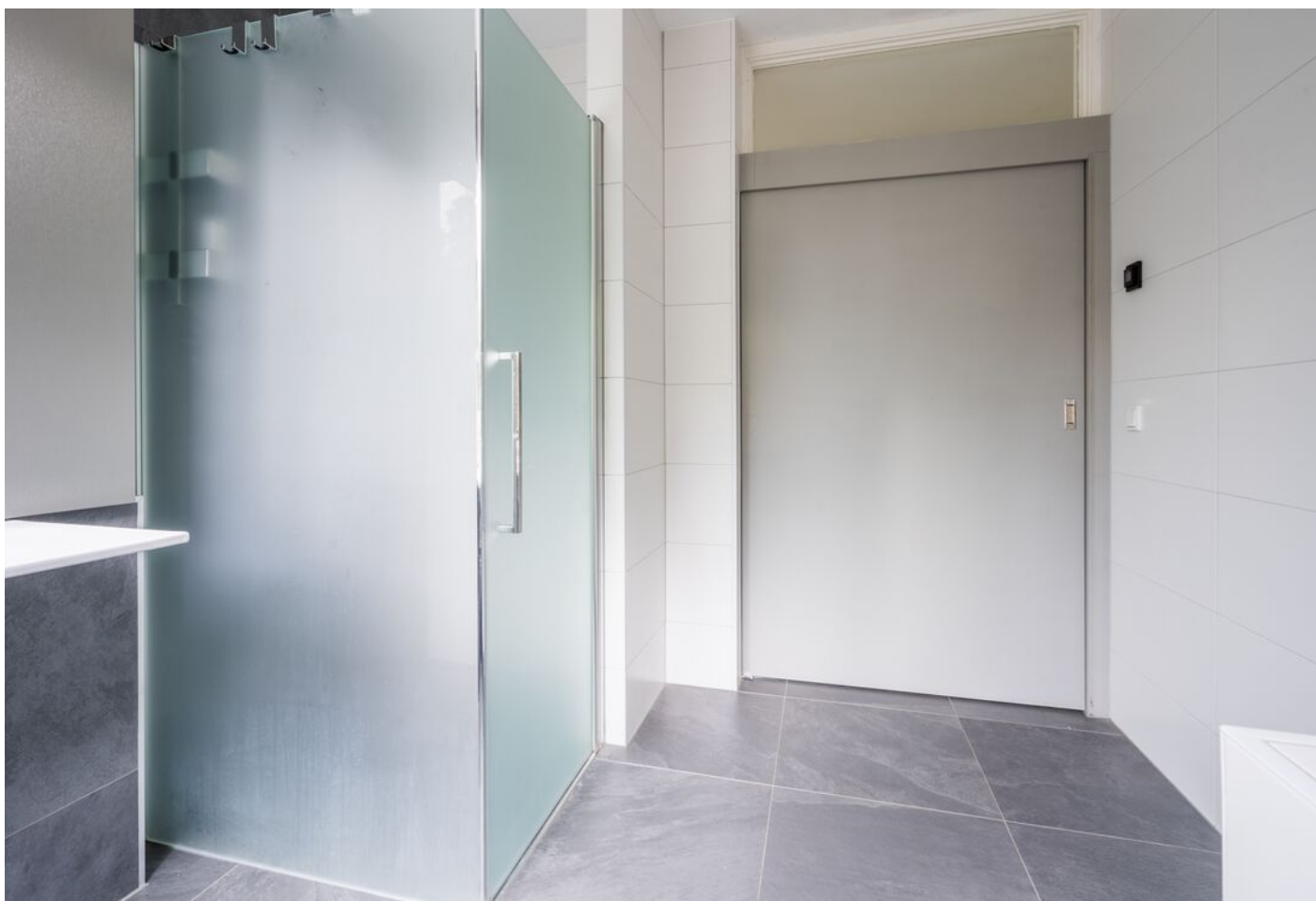
Grevenmacherhof 17, Eindhoven