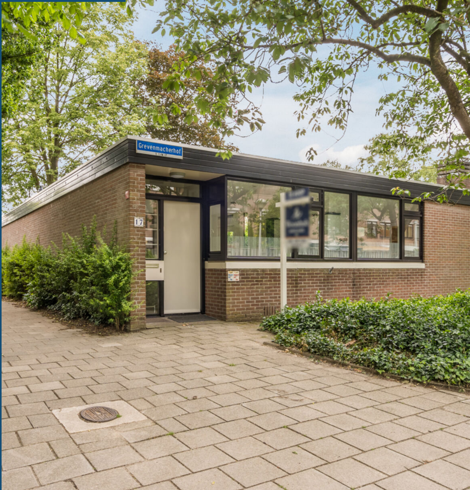
Grevenmacherhof 17, Eindhoven