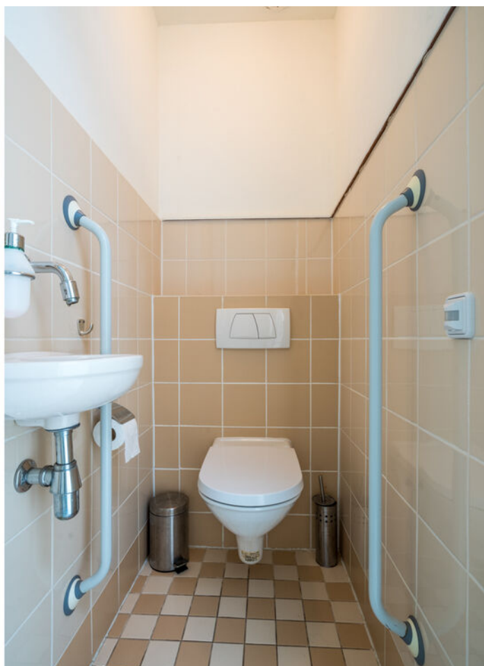
Grevenmacherhof 17, Eindhoven