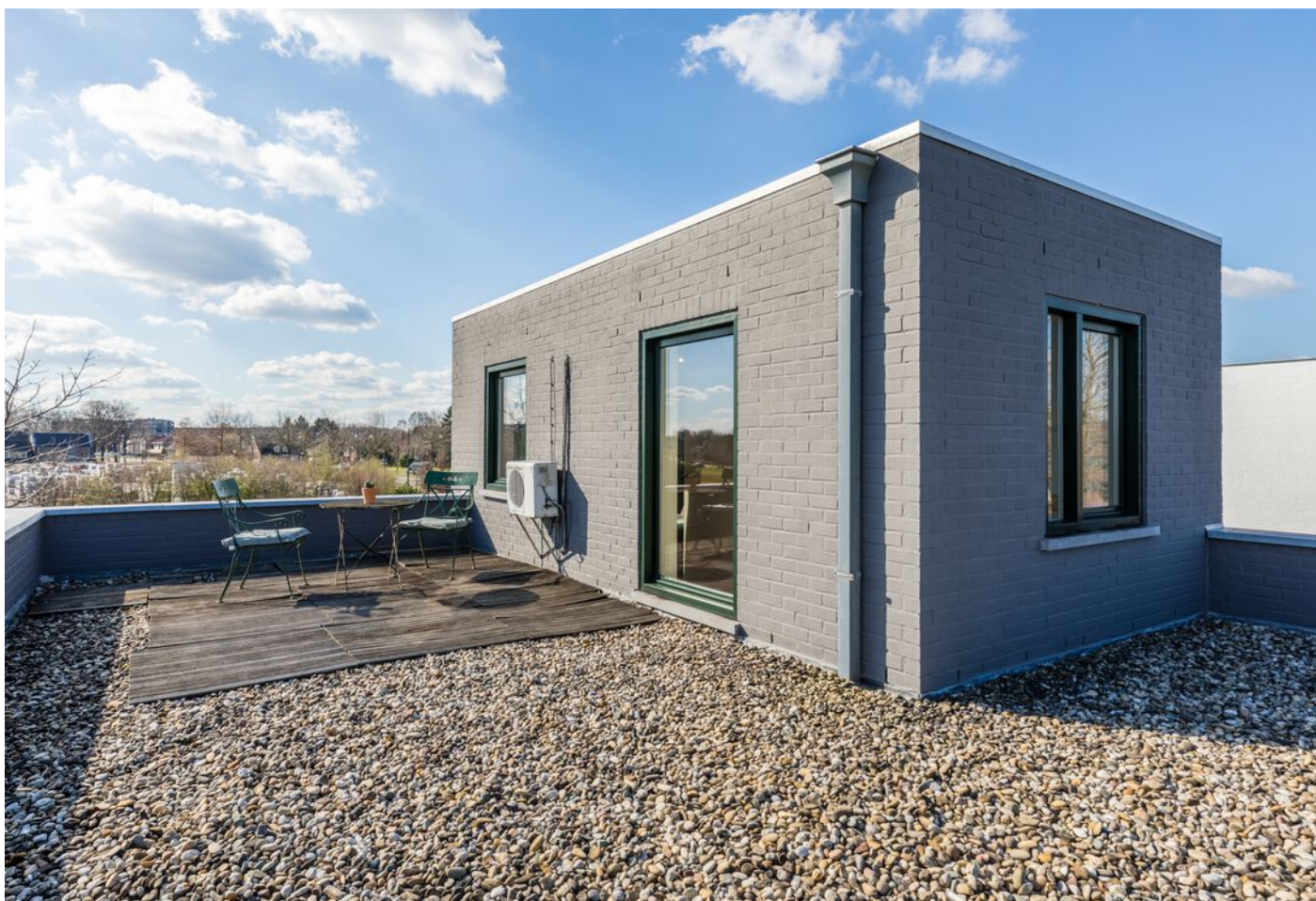
Grasduin 45, Eindhoven