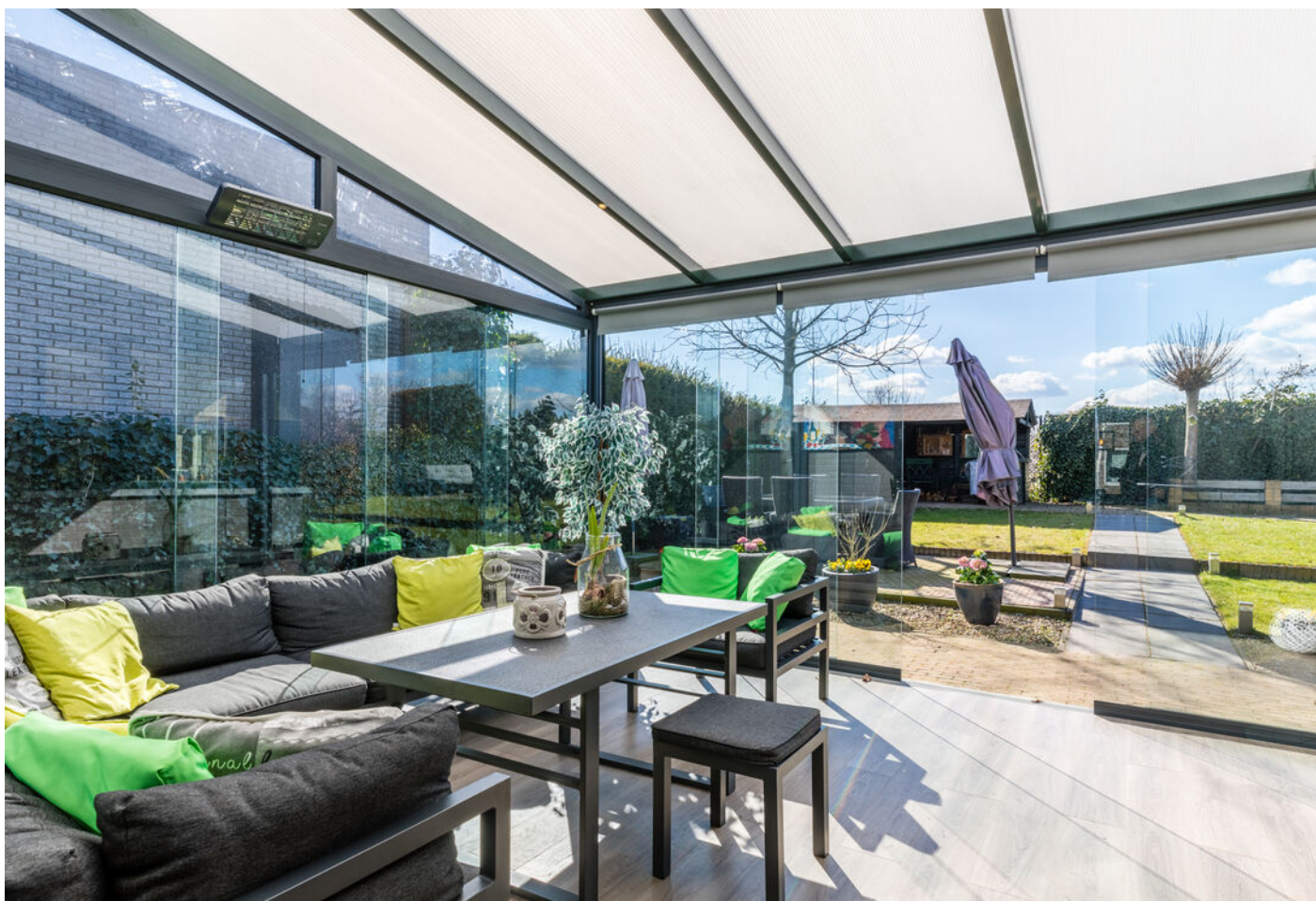
Grasduin 45, Eindhoven