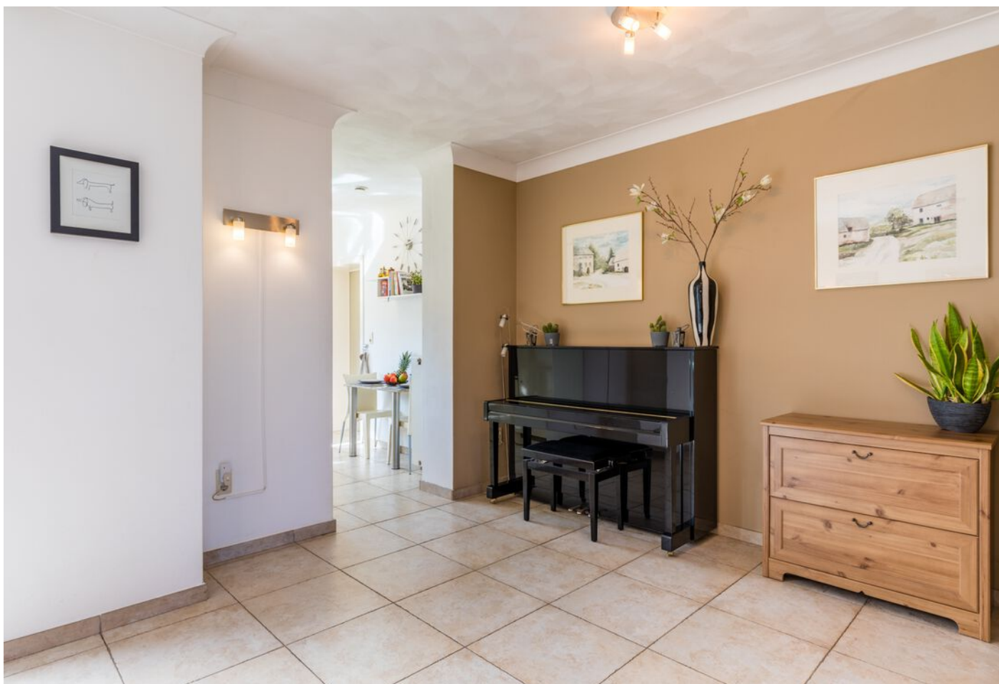
Grasduin 45, Eindhoven