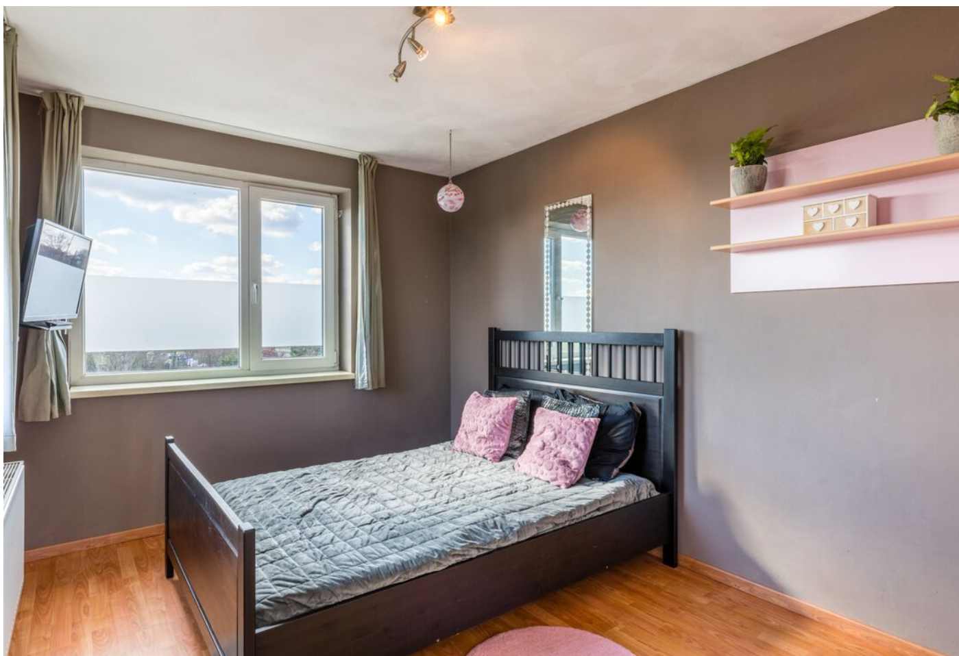
Grasduin 45, Eindhoven