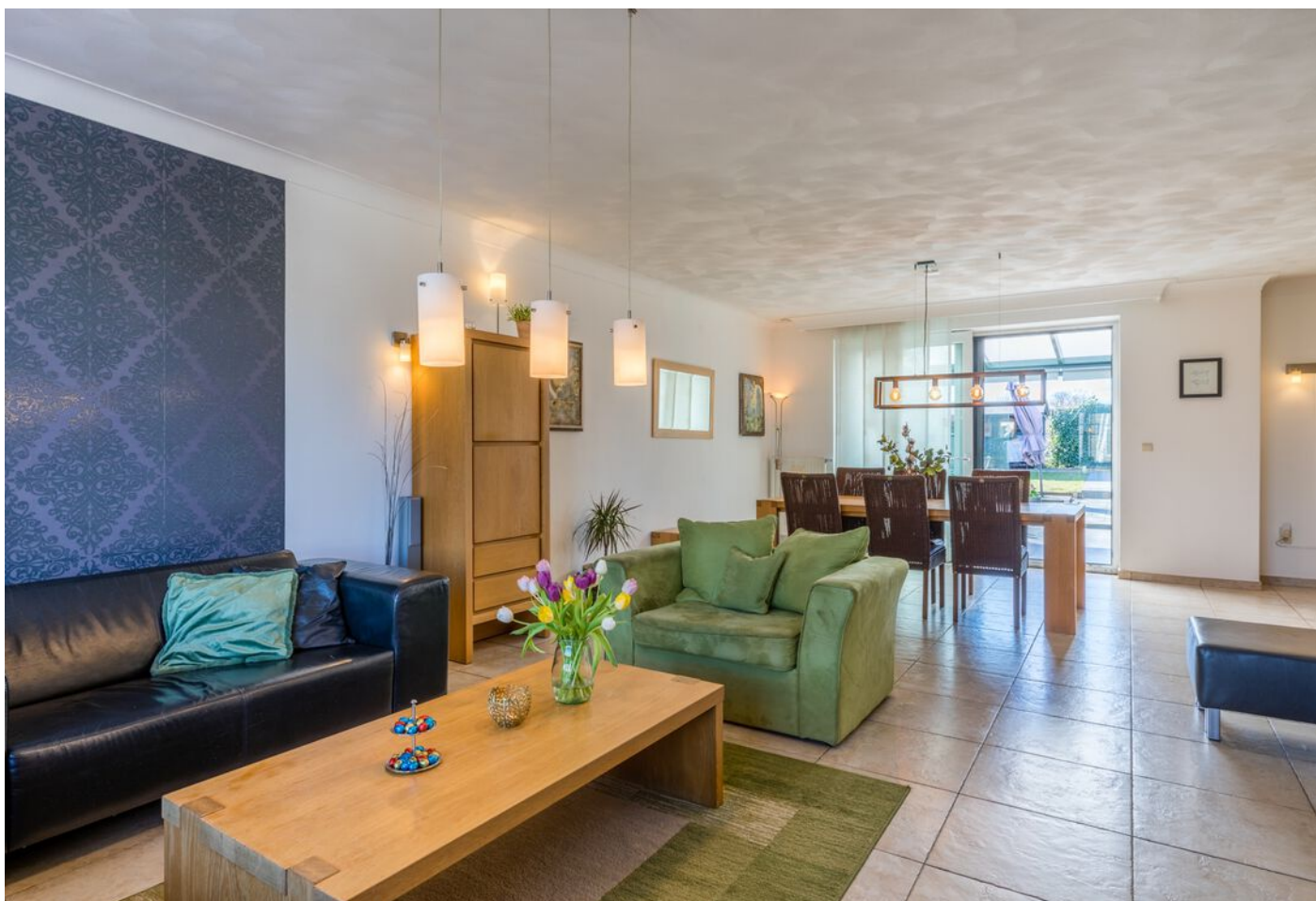
Grasduin 45, Eindhoven