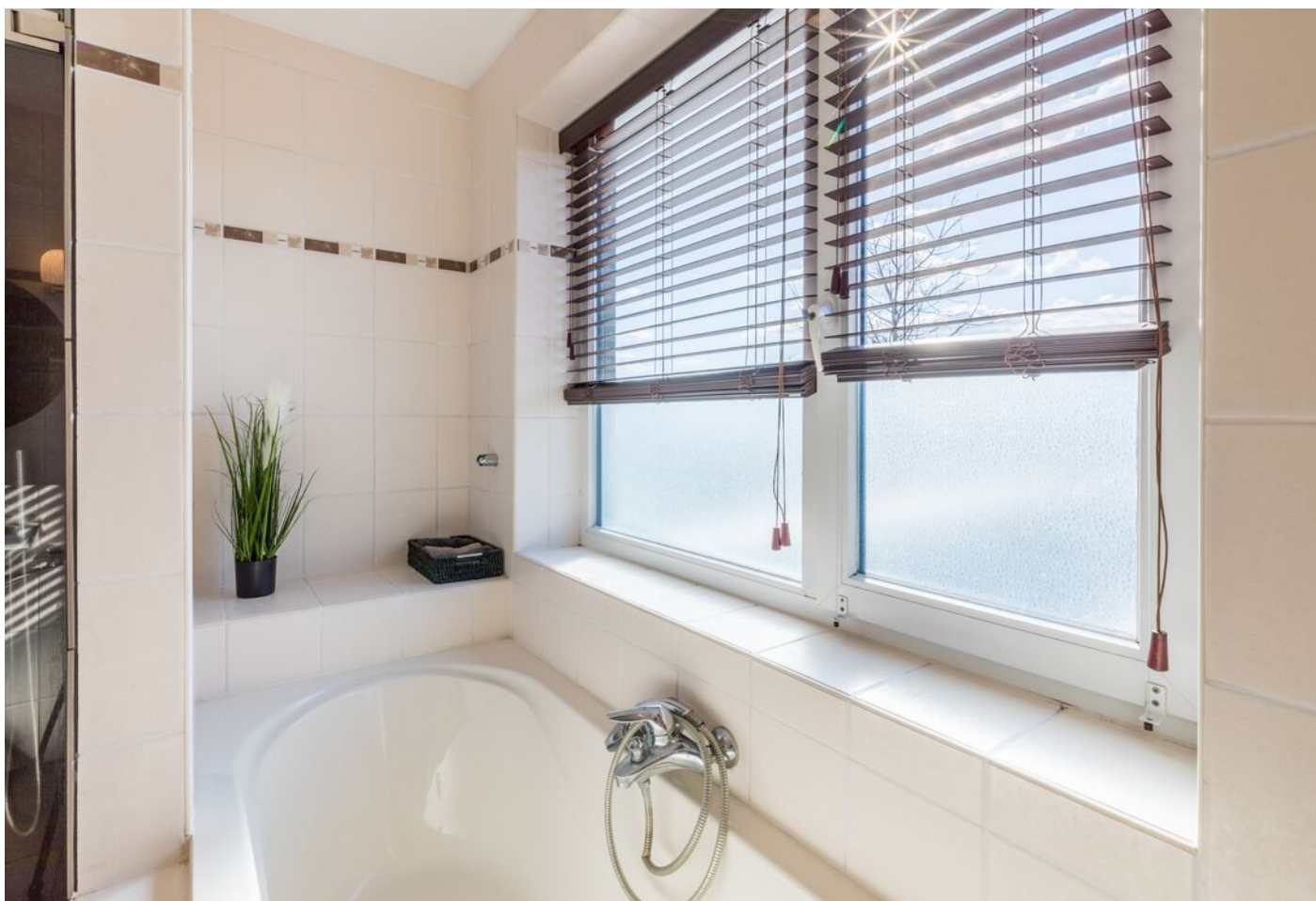
Grasduin 45, Eindhoven