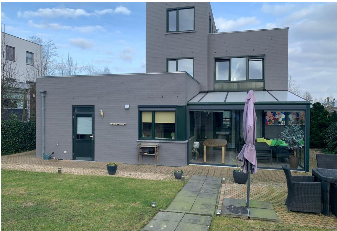
Grasduin 45, Eindhoven