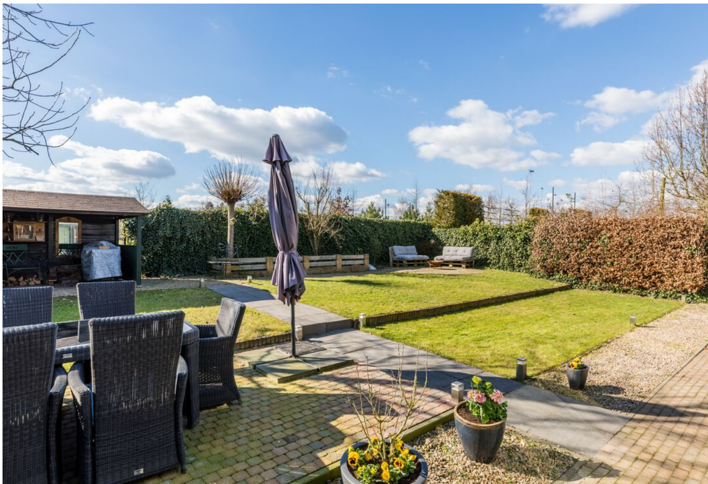
Grasduin 45, Eindhoven