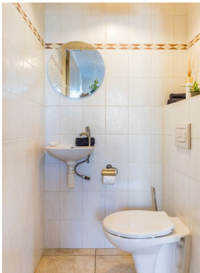
Grasduin 45, Eindhoven