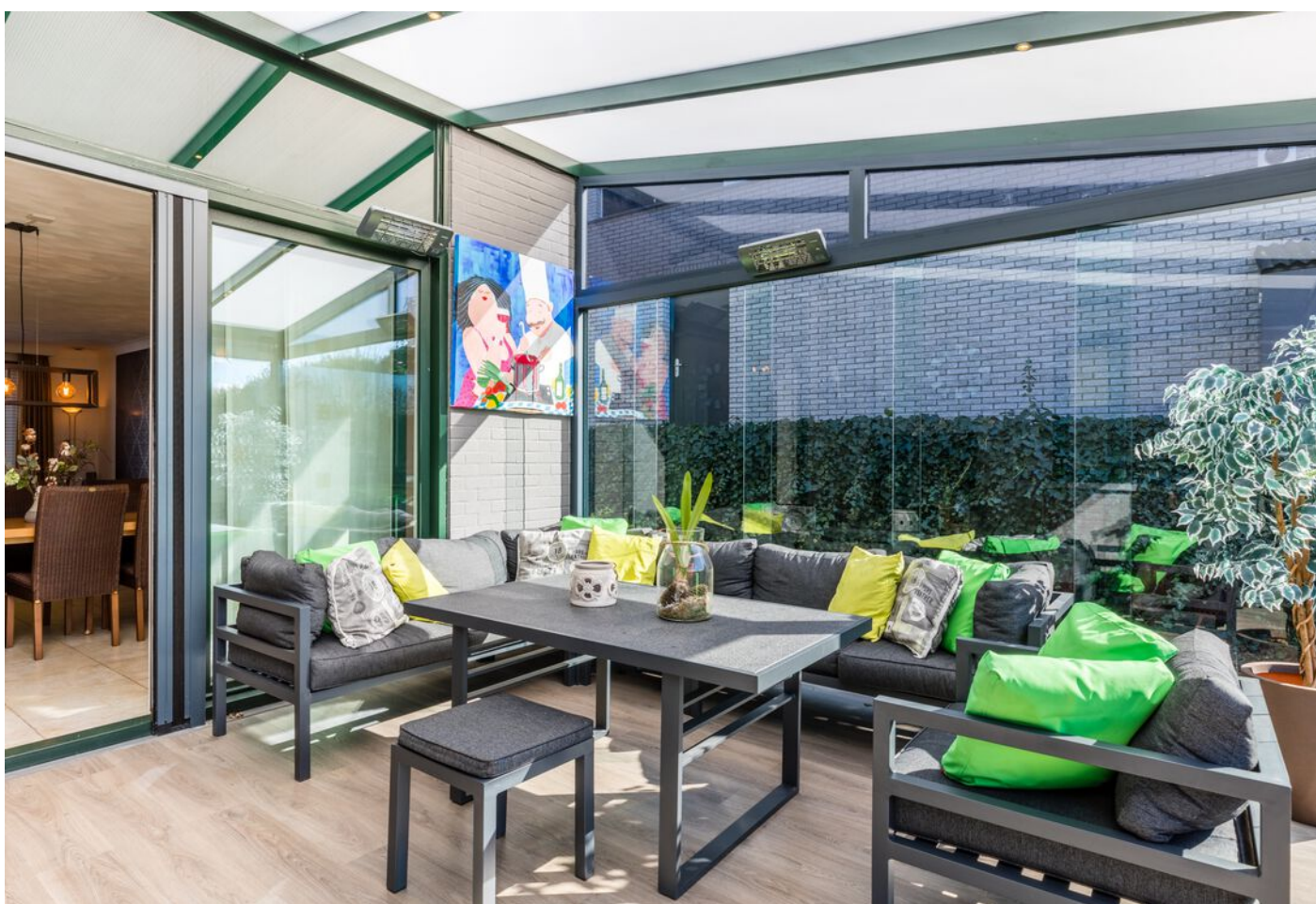
Grasduin 45, Eindhoven