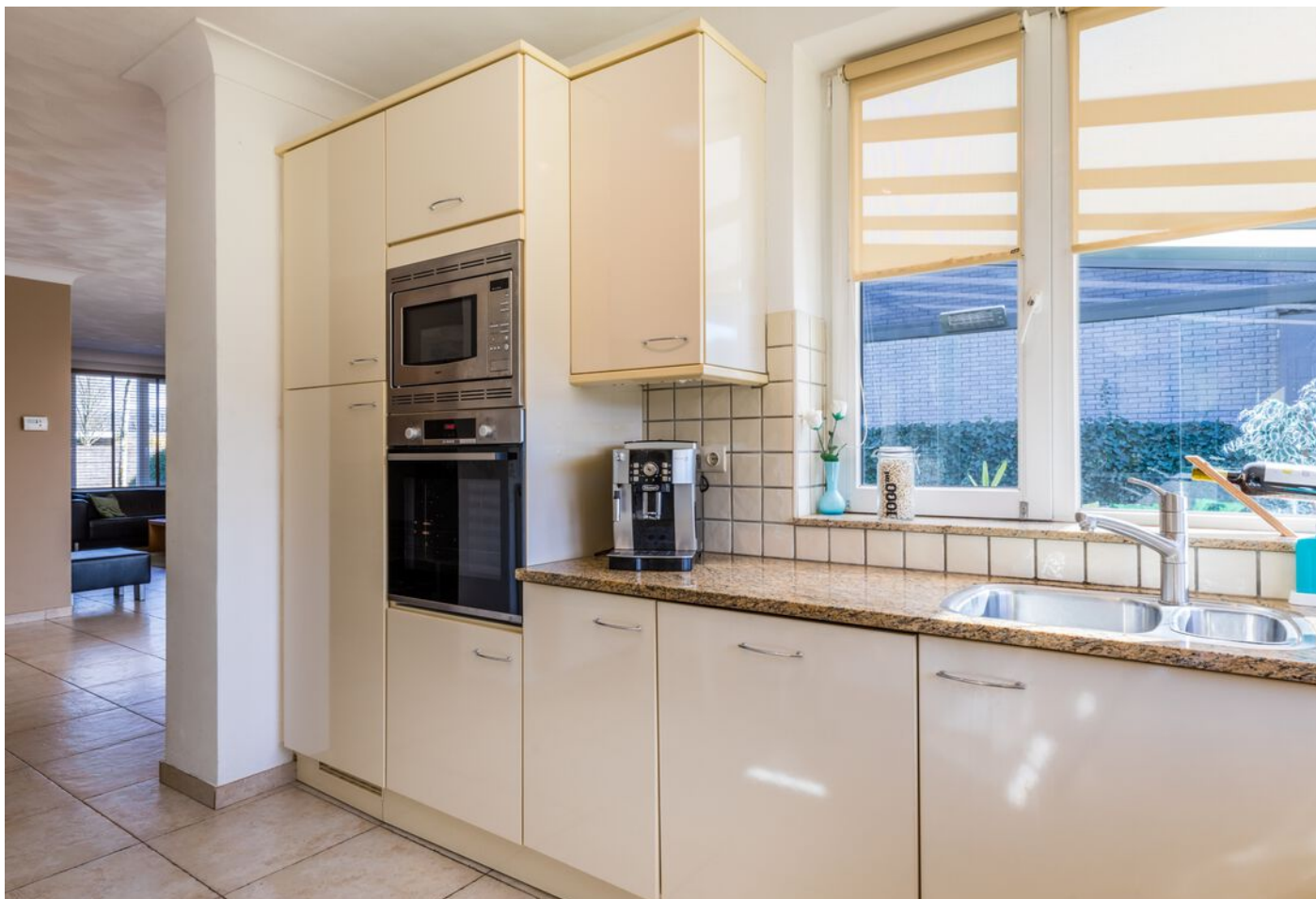
Grasduin 45, Eindhoven