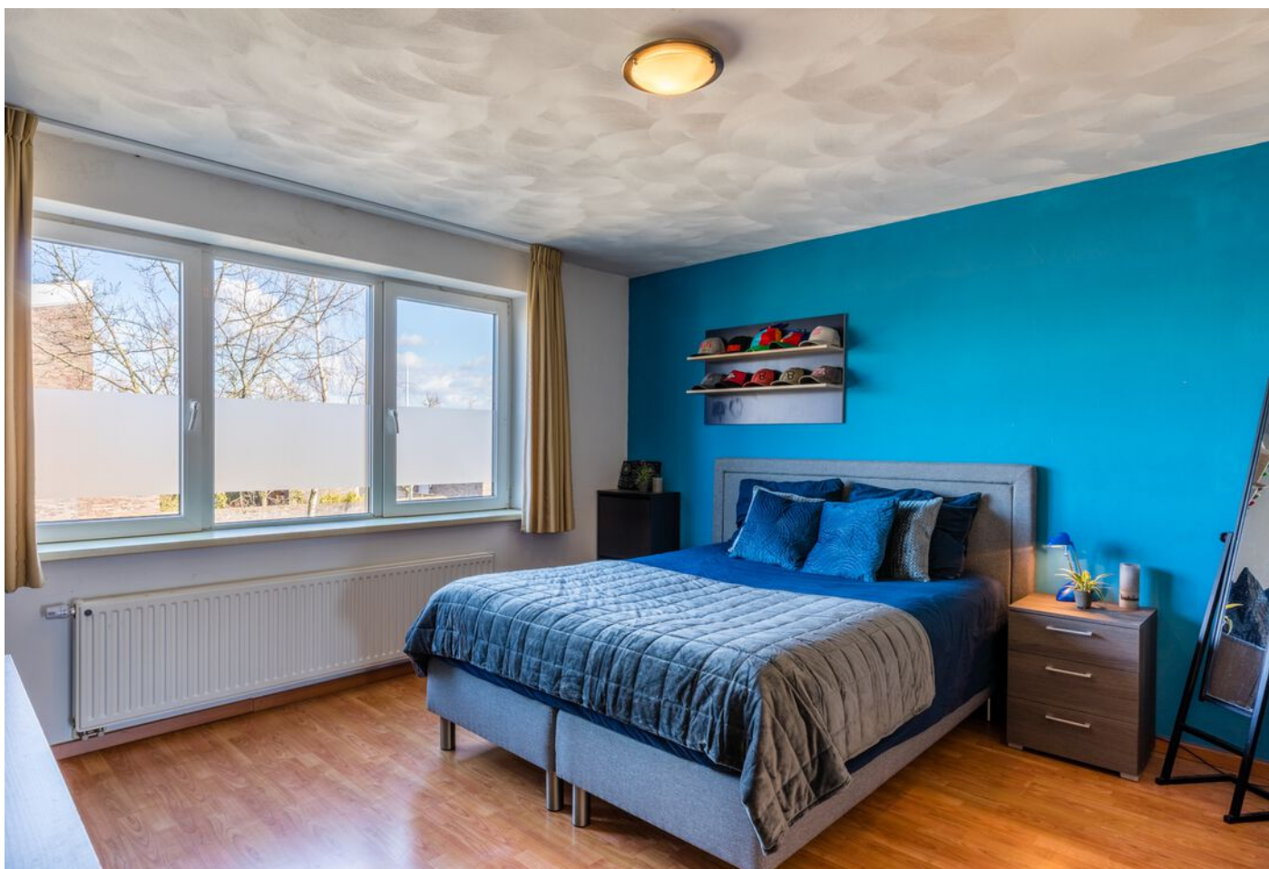
Grasduin 45, Eindhoven