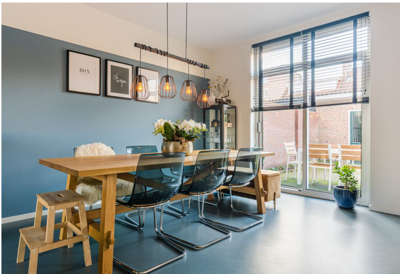
Gerard Doustraat 24, 's-Hertogenbosch