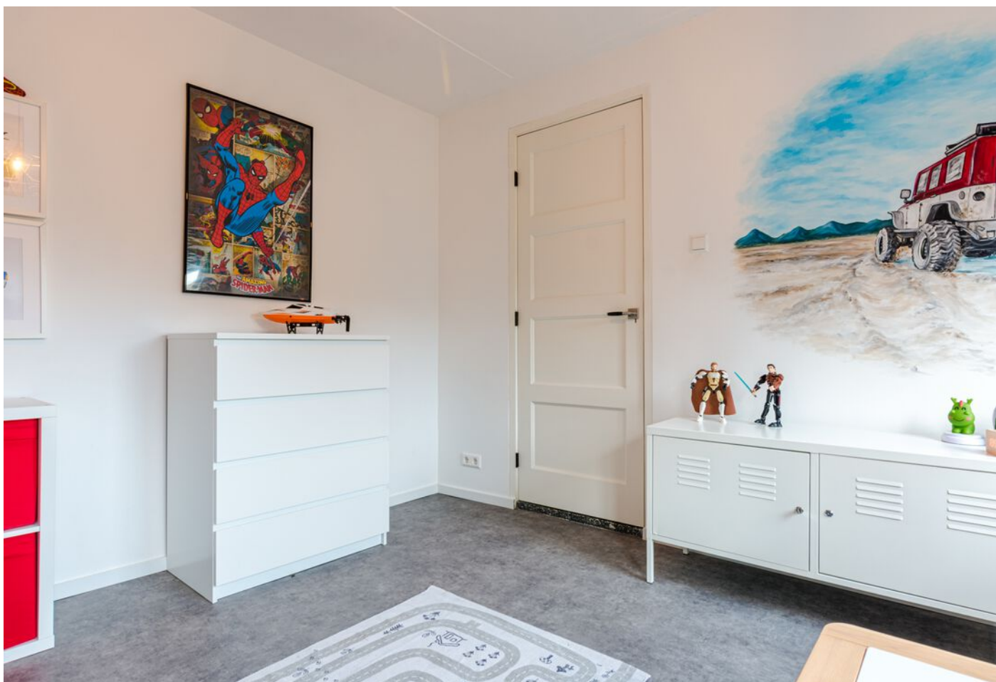
Gerard Doustraat 24, 's-Hertogenbosch