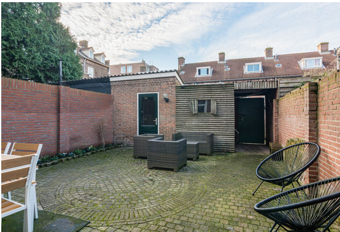
Gerard Doustraat 24, 's-Hertogenbosch