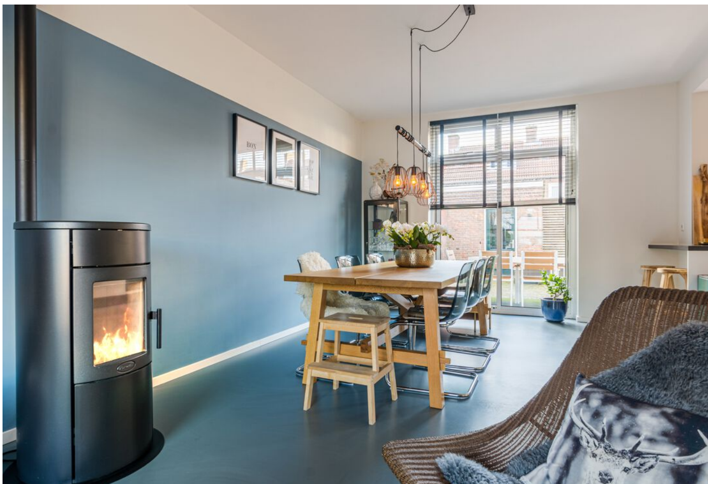
Gerard Doustraat 24, 's-Hertogenbosch