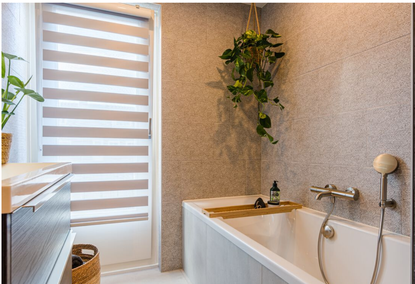
Gerard Doustraat 24, 's-Hertogenbosch