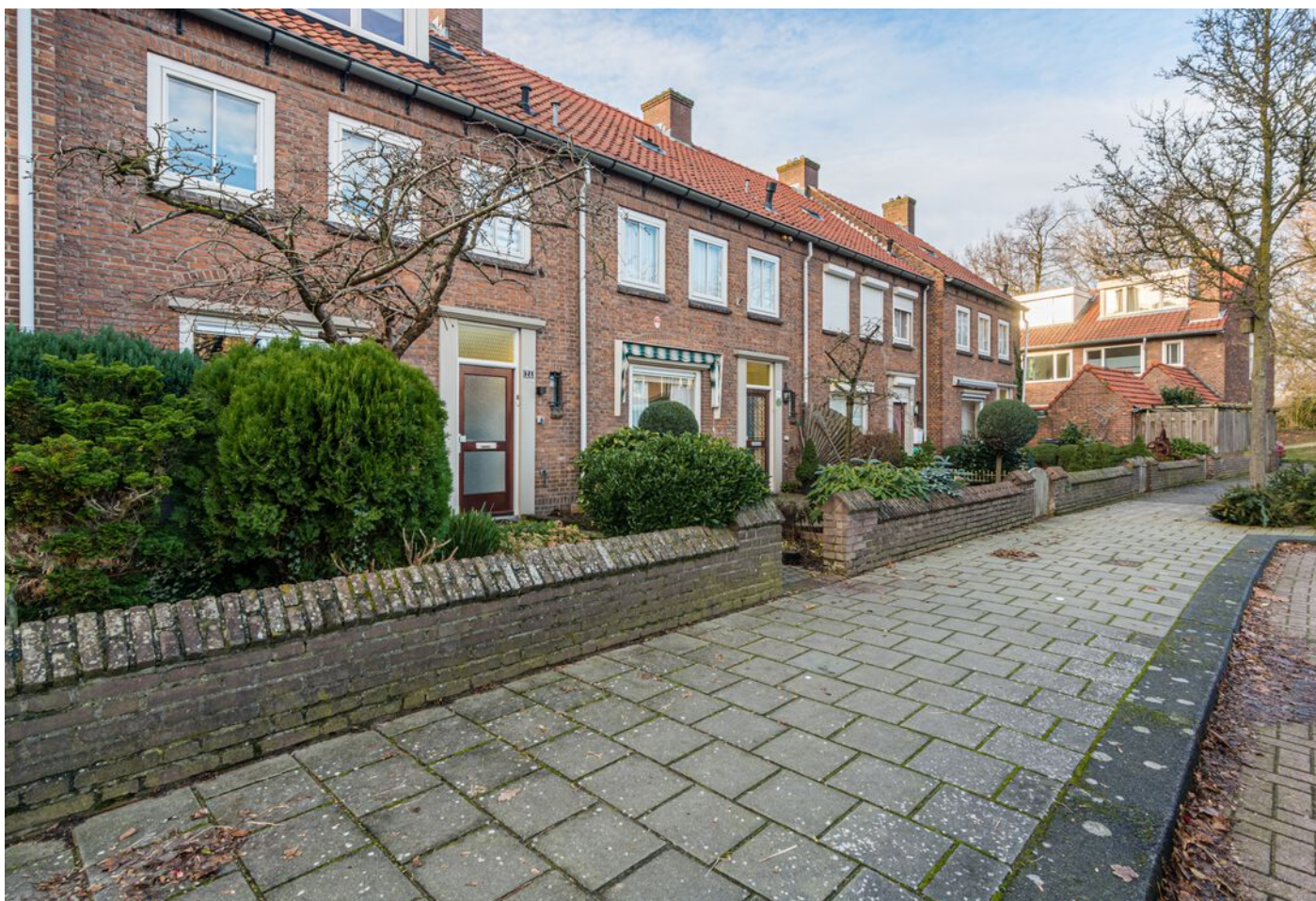
Gerard Doustraat 24, 's-Hertogenbosch