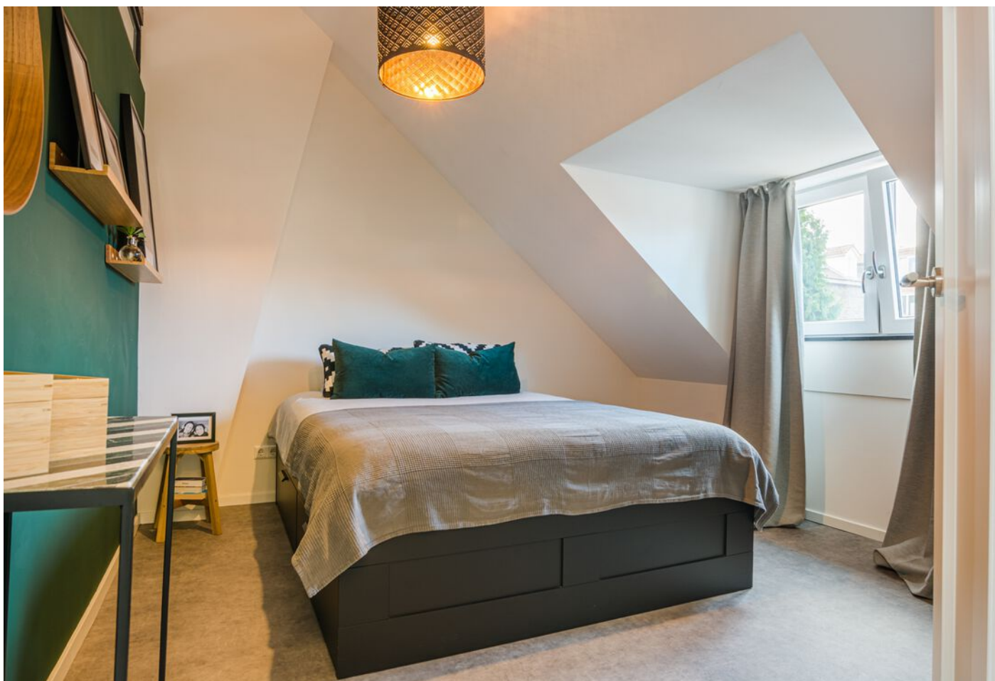
Gerard Doustraat 24, 's-Hertogenbosch