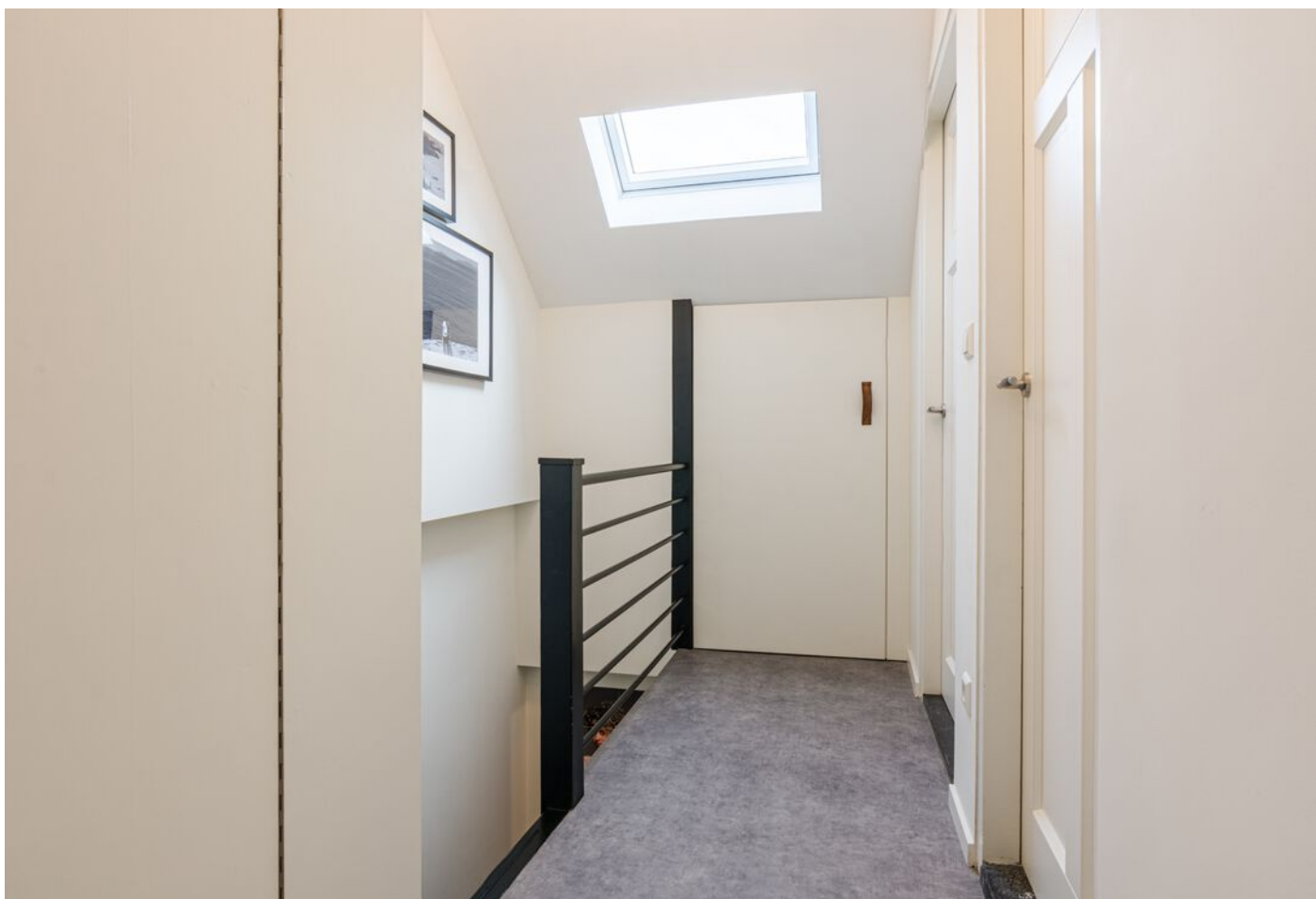
Gerard Doustraat 24, 's-Hertogenbosch