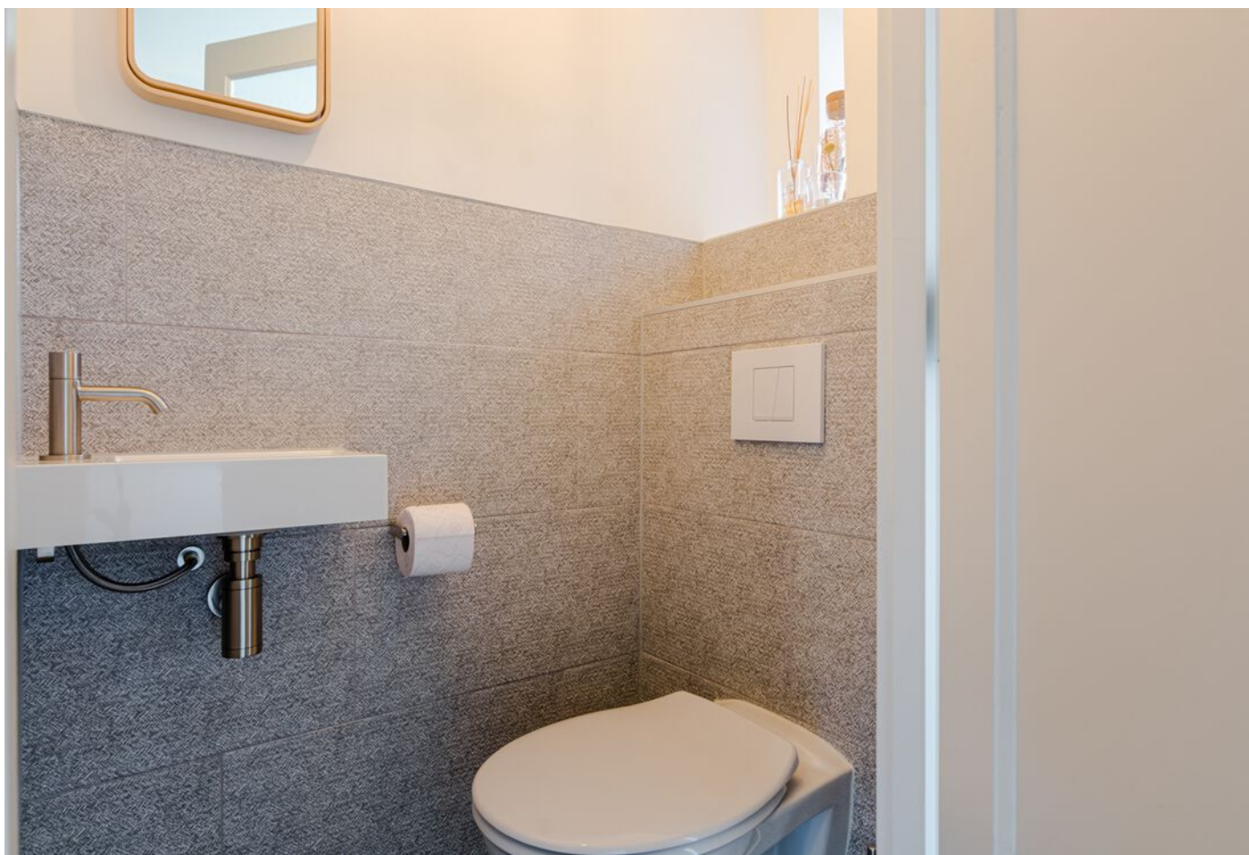
Gerard Doustraat 24, 's-Hertogenbosch