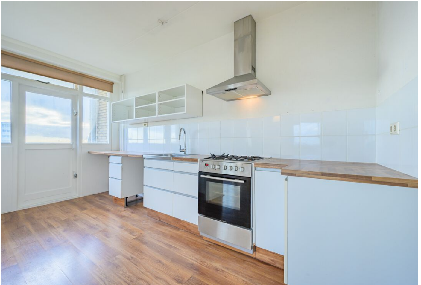
Edward Jennerstraat 408, Haarlem