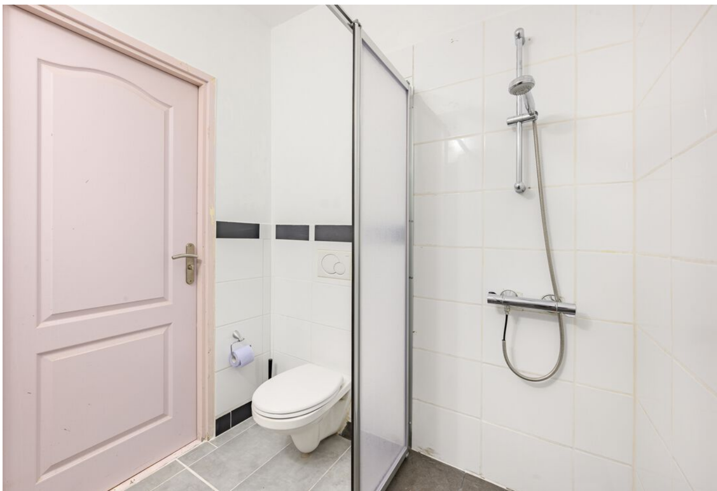
Edward Jennerstraat 408, Haarlem