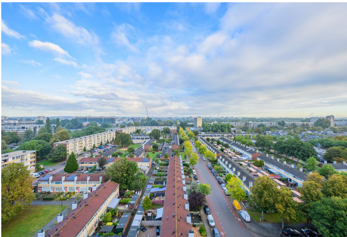
Edward Jennerstraat 408, Haarlem