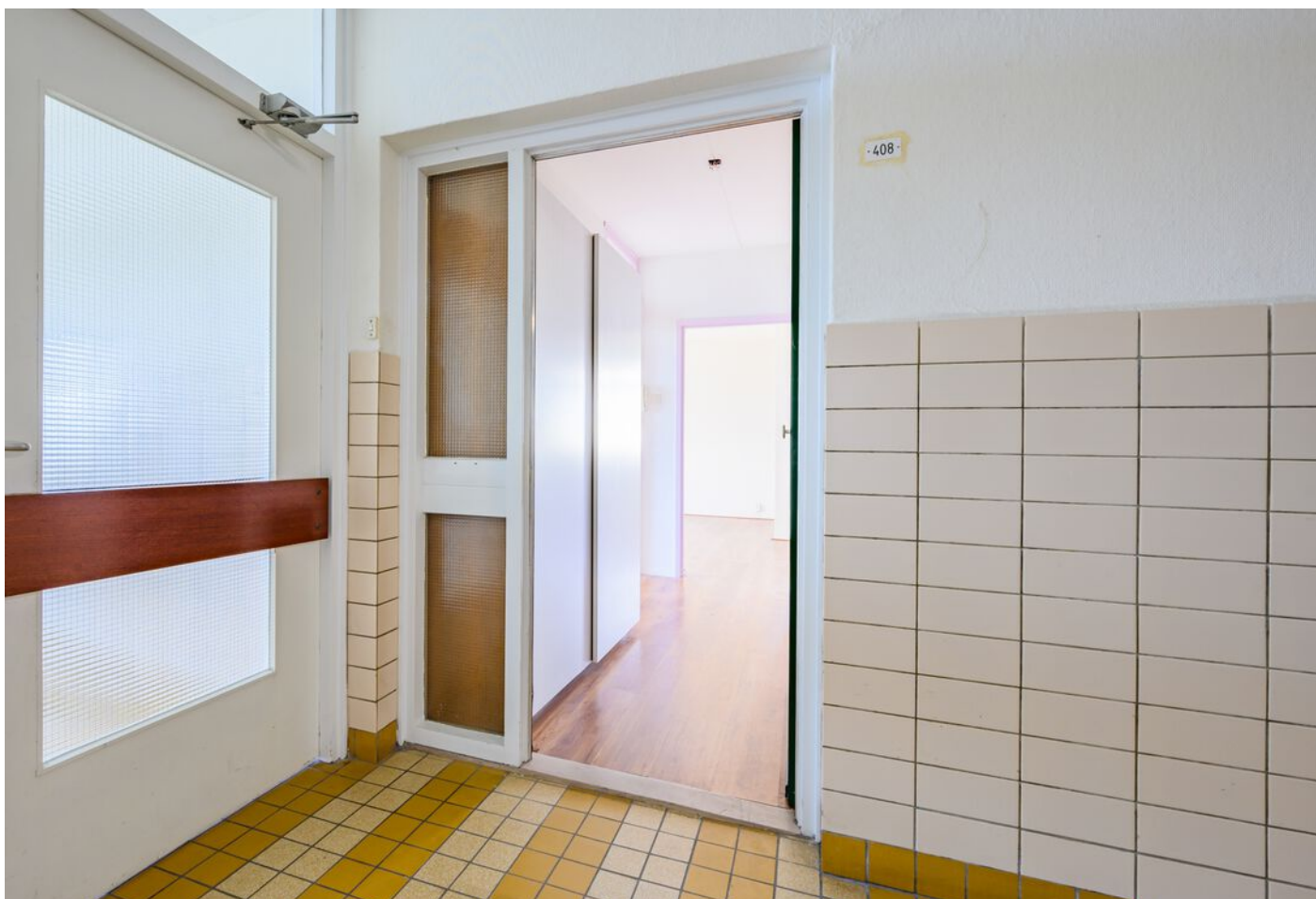
Edward Jennerstraat 408, Haarlem