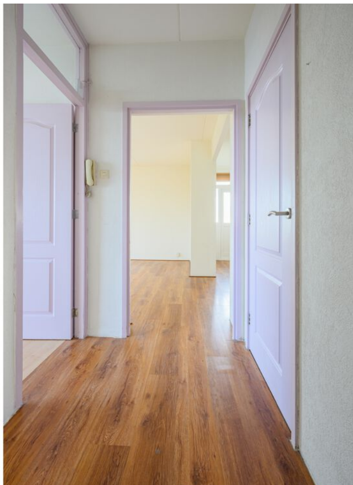
Edward Jennerstraat 408, Haarlem