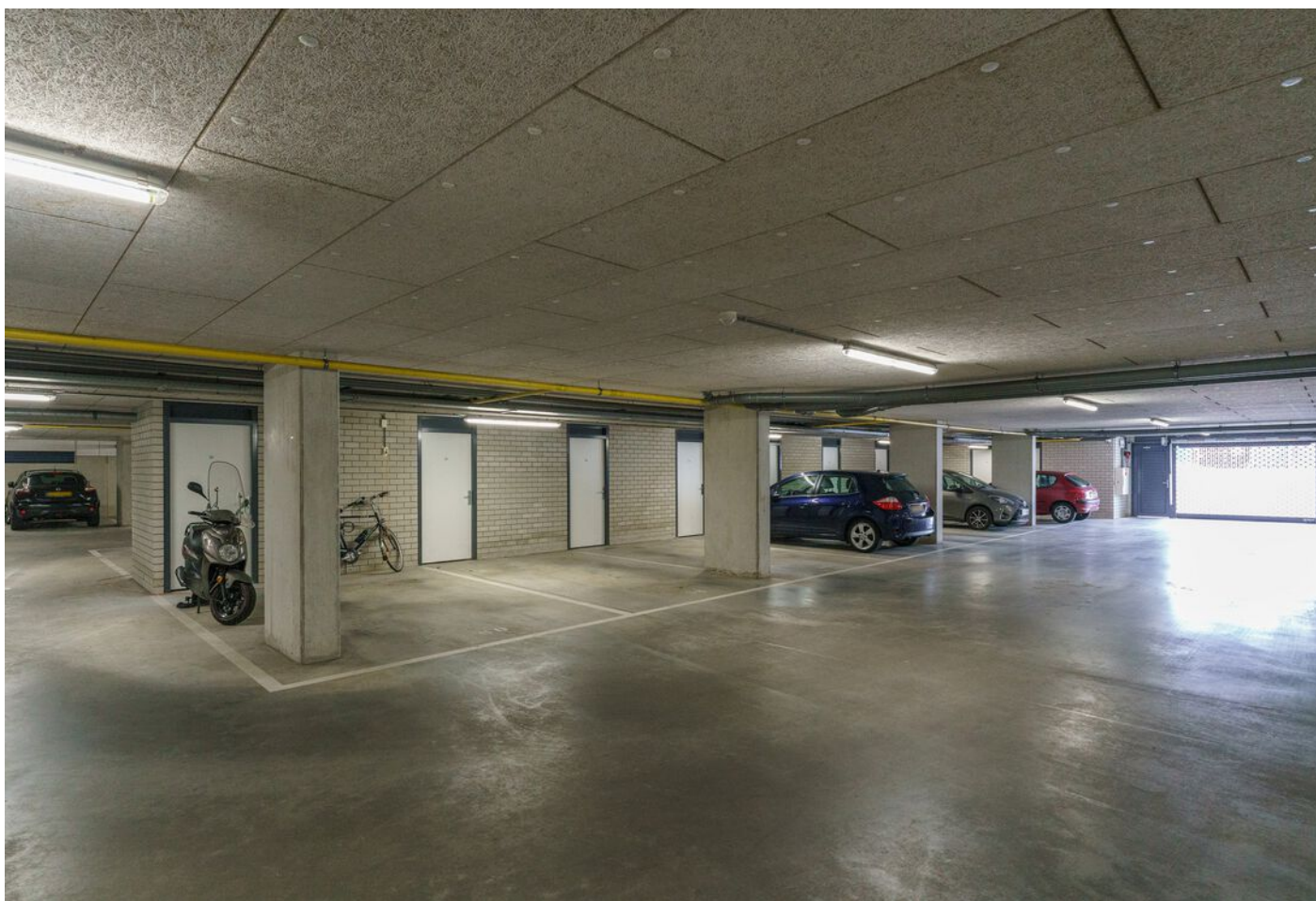
De Klok 54, Vlijmen