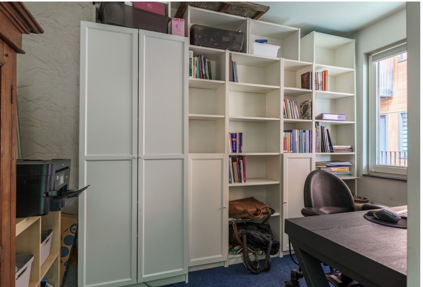
De Klok 54, Vlijmen