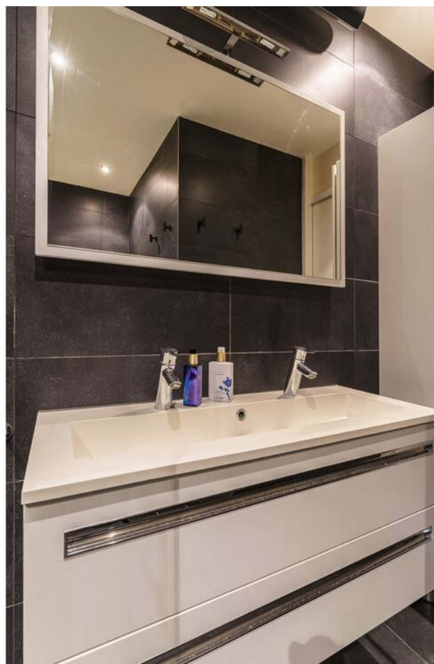
De Klok 54, Vlijmen