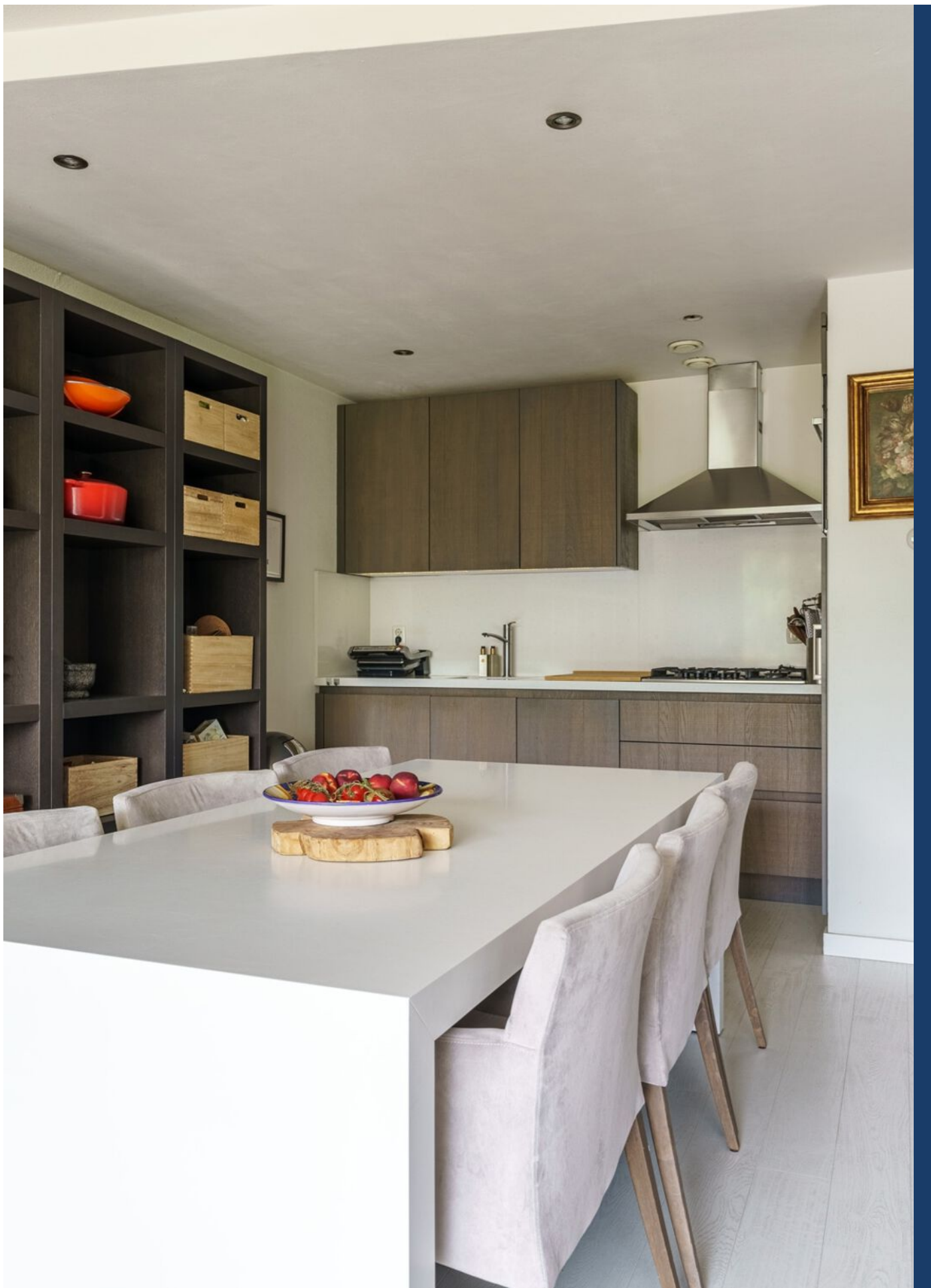
De Klok 54, Vlijmen