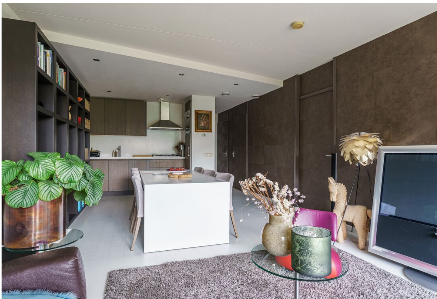
De Klok 54, Vlijmen