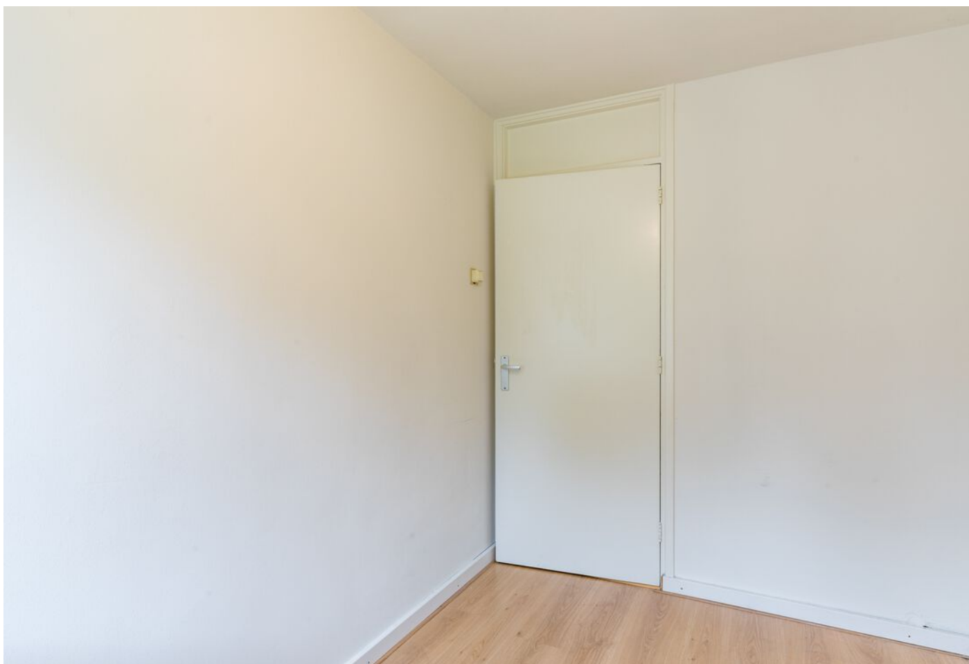
De Beaufortpad 14, Eindhoven