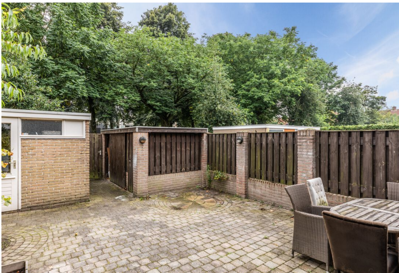
De Beaufortpad 14, Eindhoven