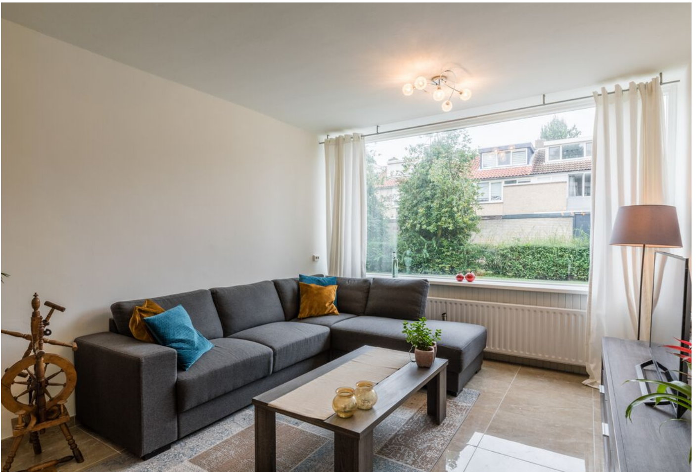
De Beaufortpad 14, Eindhoven