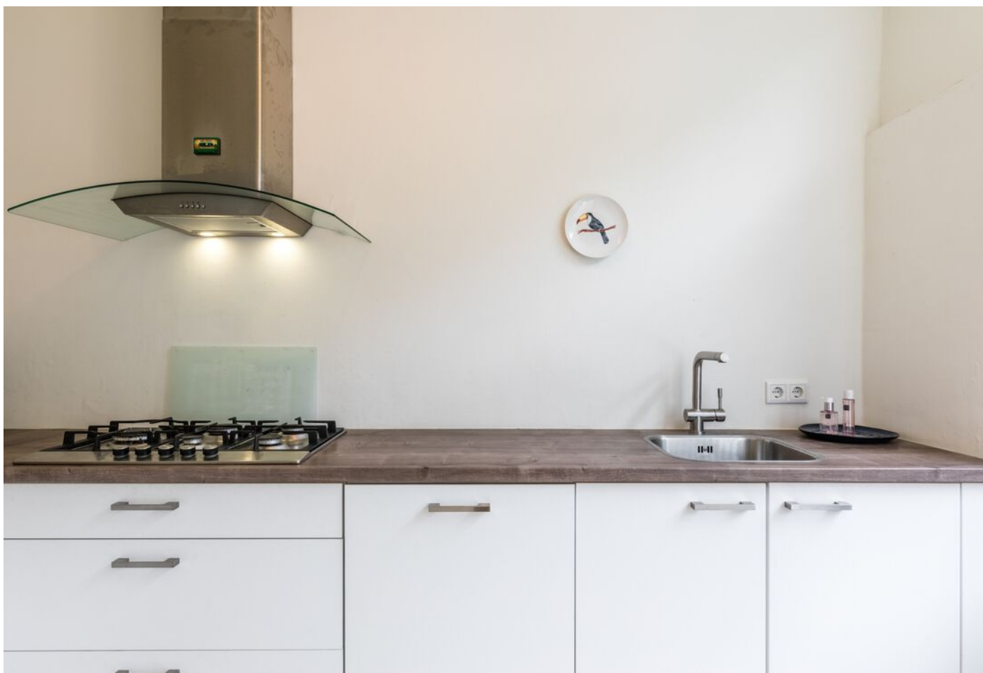
De Beaufortpad 14, Eindhoven