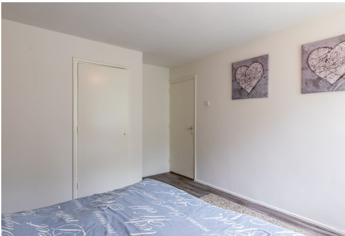
De Beaufortpad 14, Eindhoven