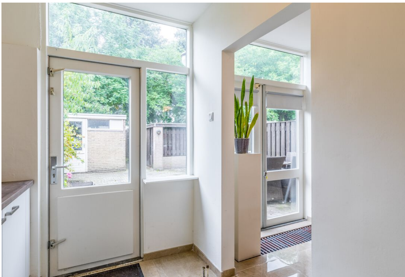
De Beaufortpad 14, Eindhoven