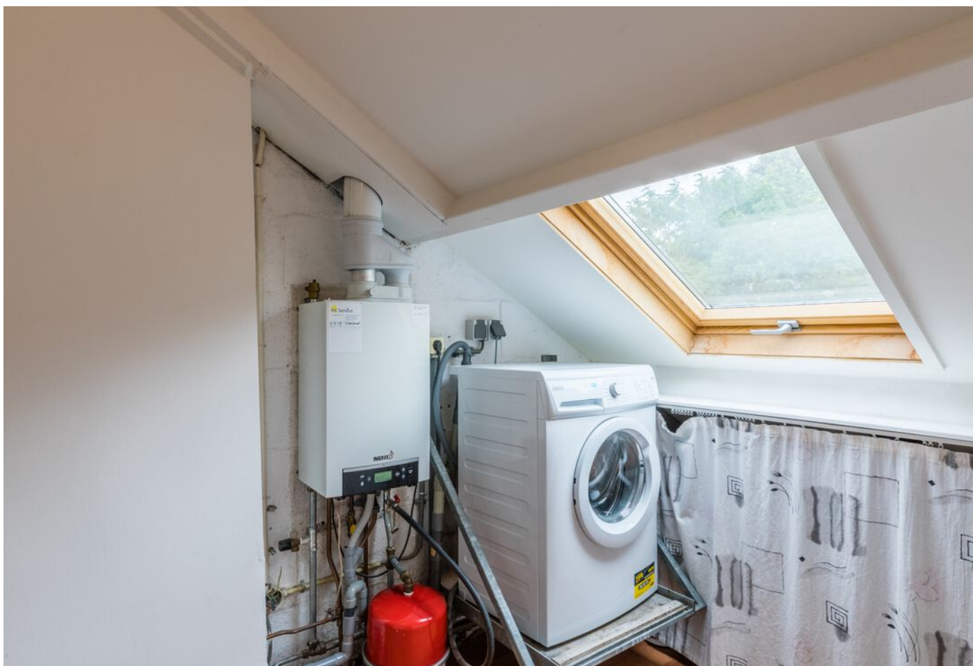
De Beaufortpad 14, Eindhoven