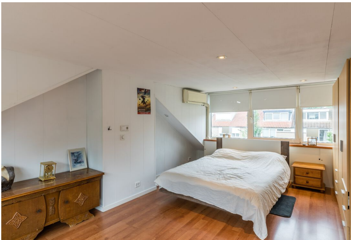
De Beaufortpad 14, Eindhoven