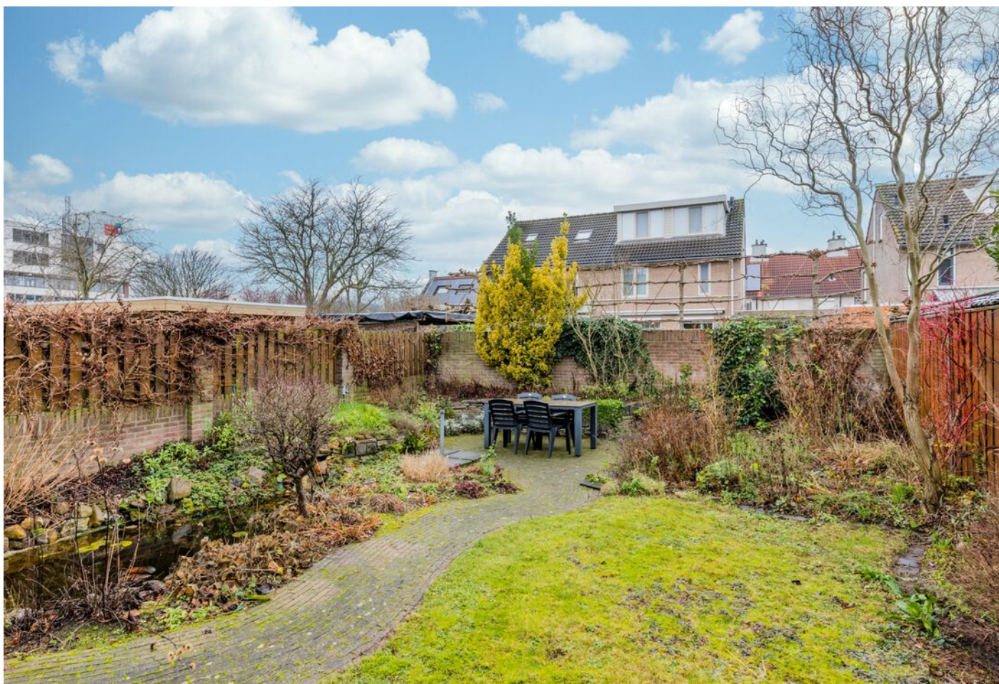
Correzelaan 14, Eindhoven