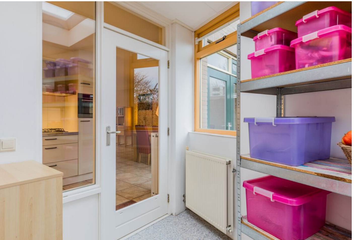
Correzelaan 14, Eindhoven