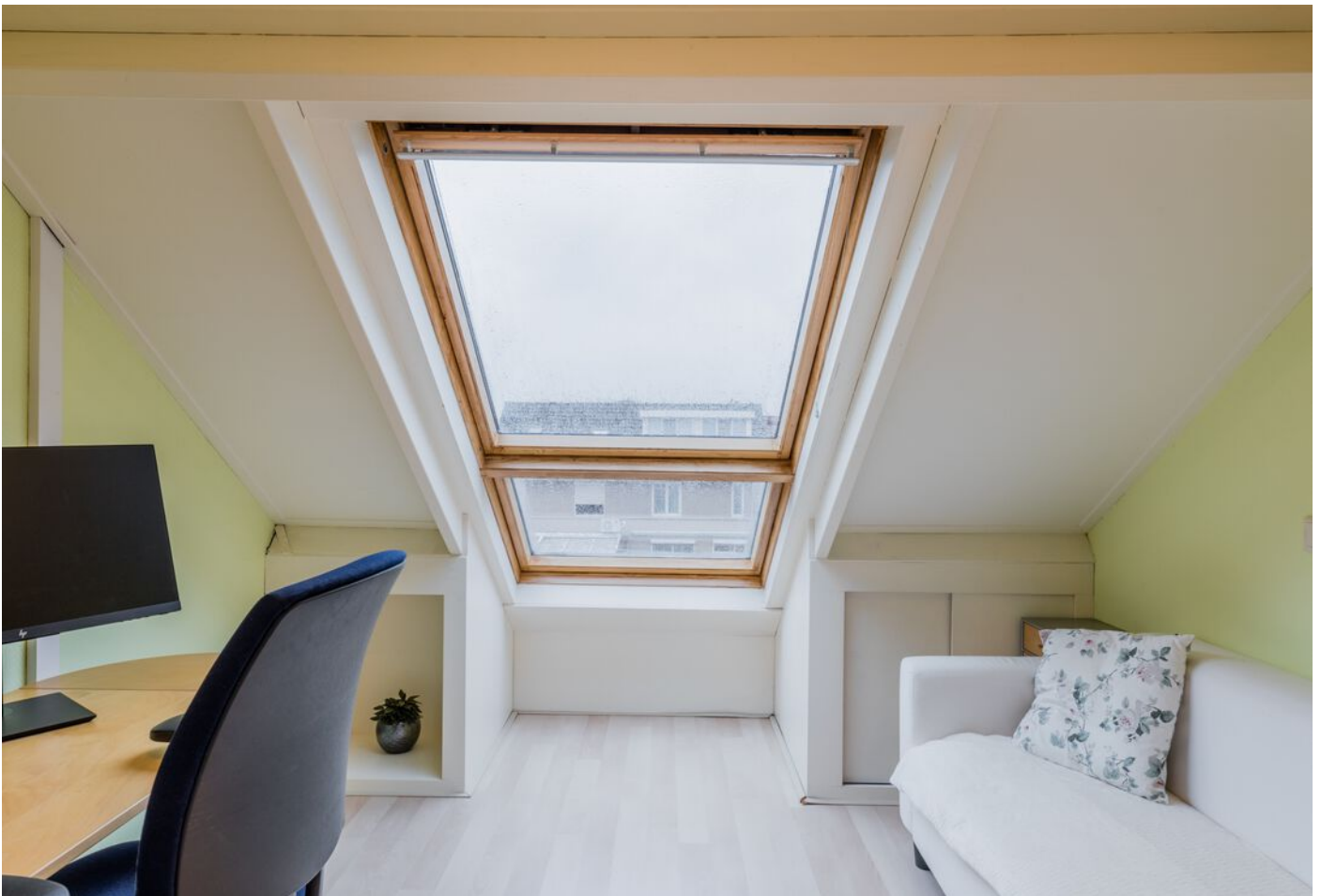
Correzelaan 14, Eindhoven