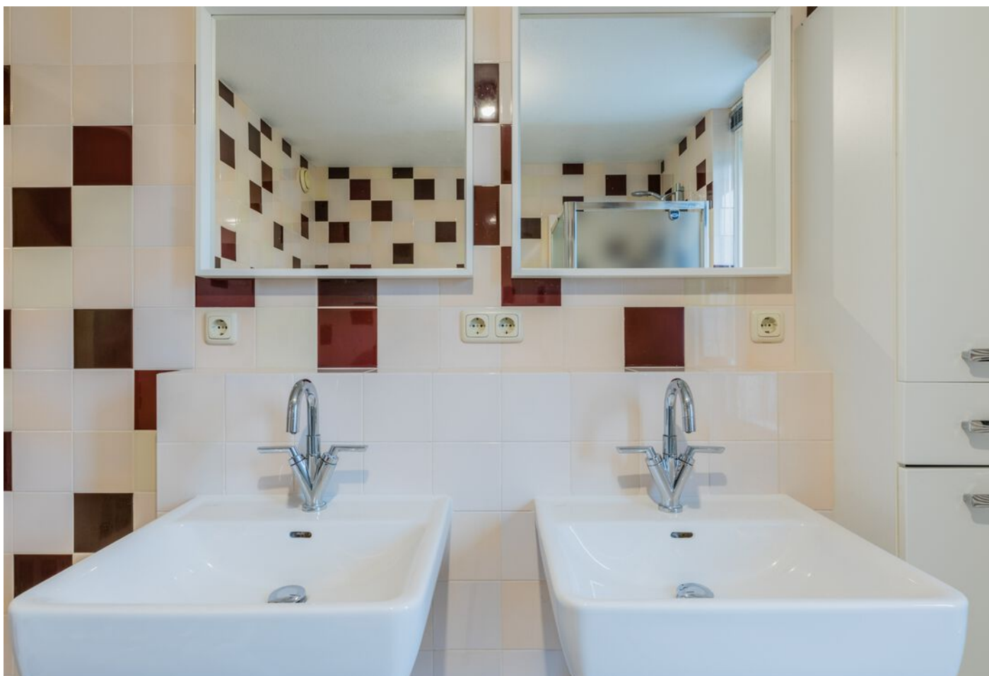
Correzelaan 14, Eindhoven