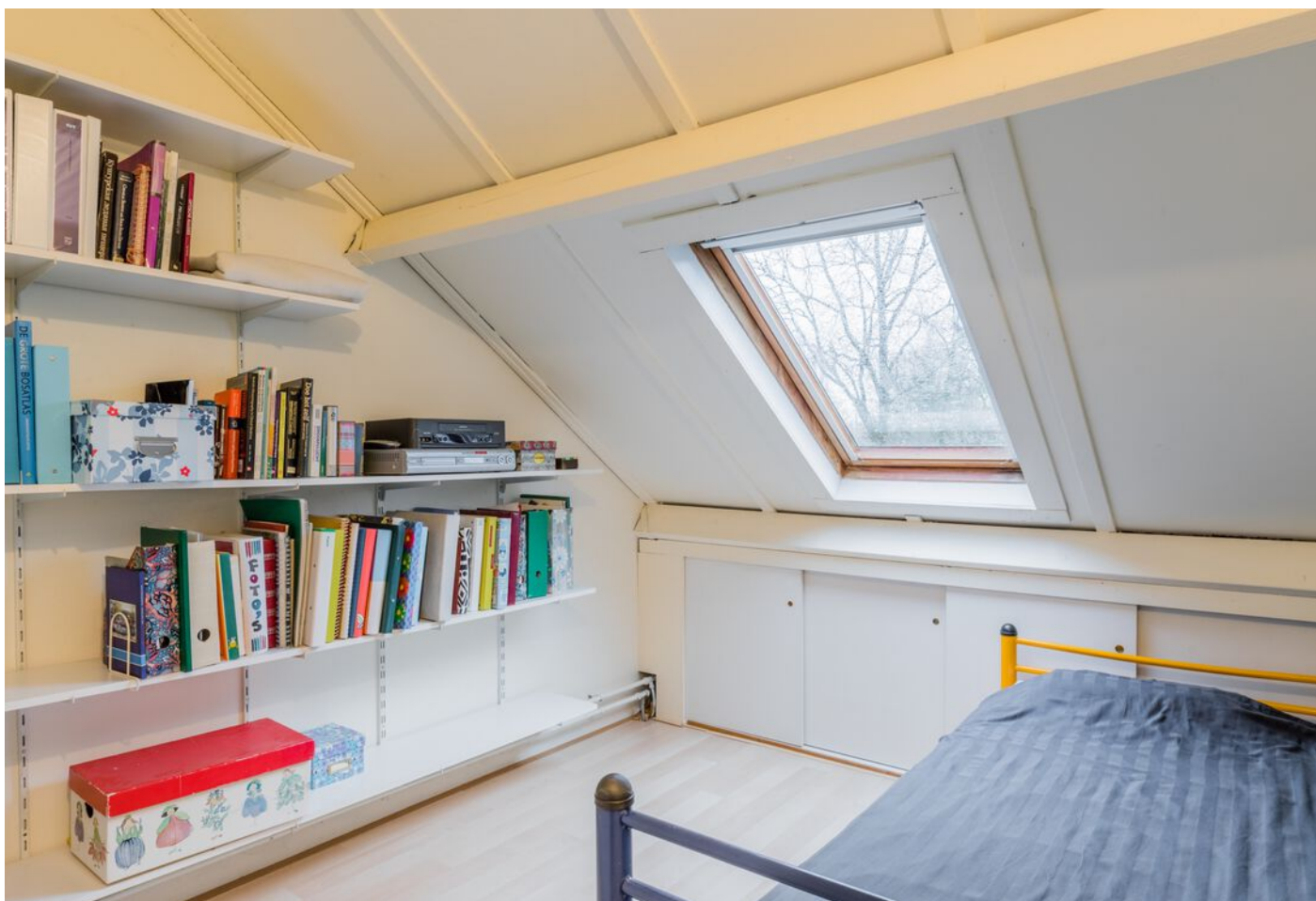
Correzelaan 14, Eindhoven