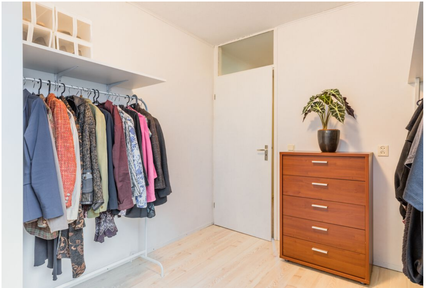
Correzelaan 14, Eindhoven