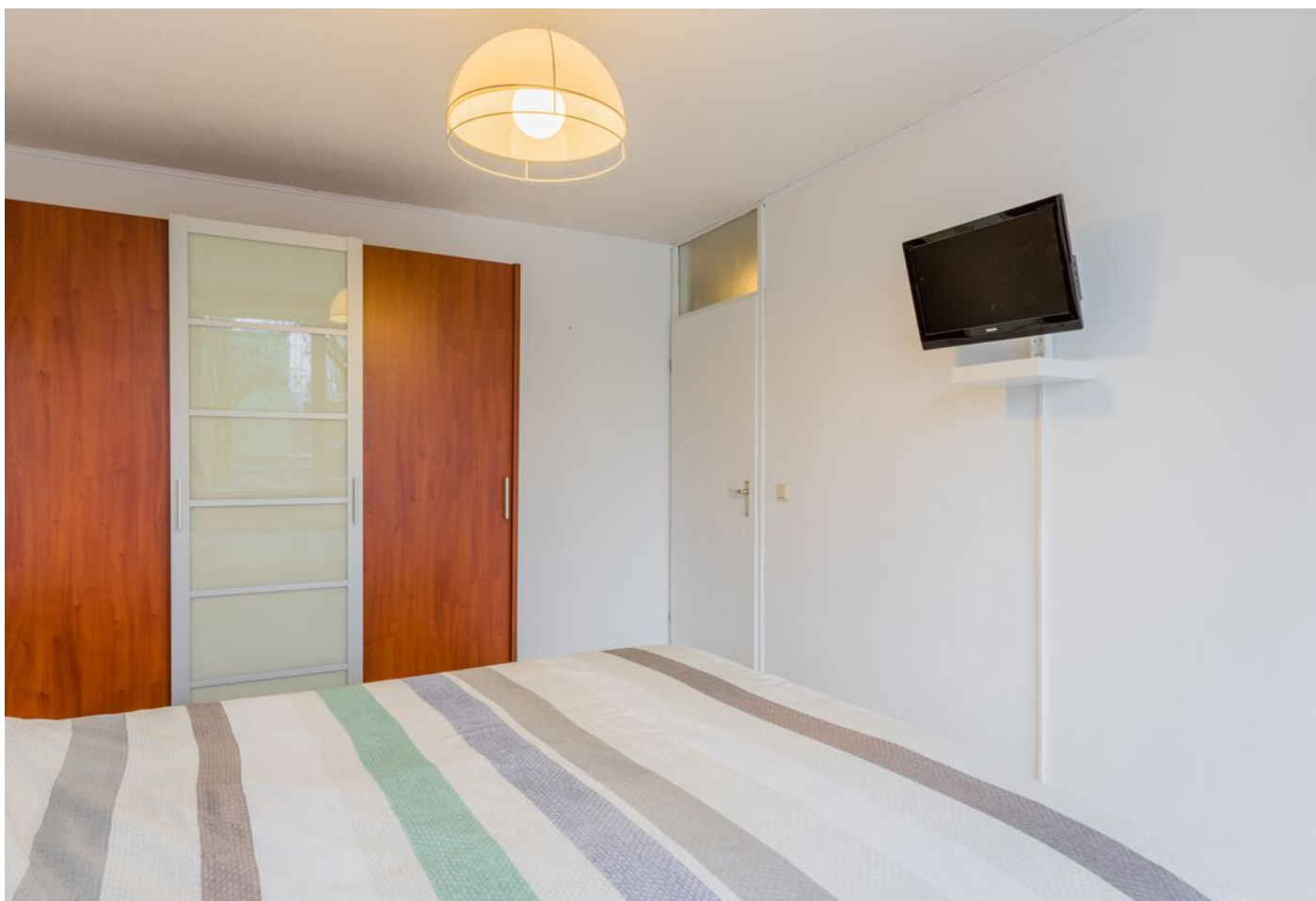
Correzelaan 14, Eindhoven