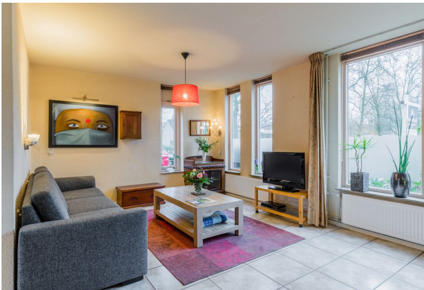
Correzelaan 14, Eindhoven