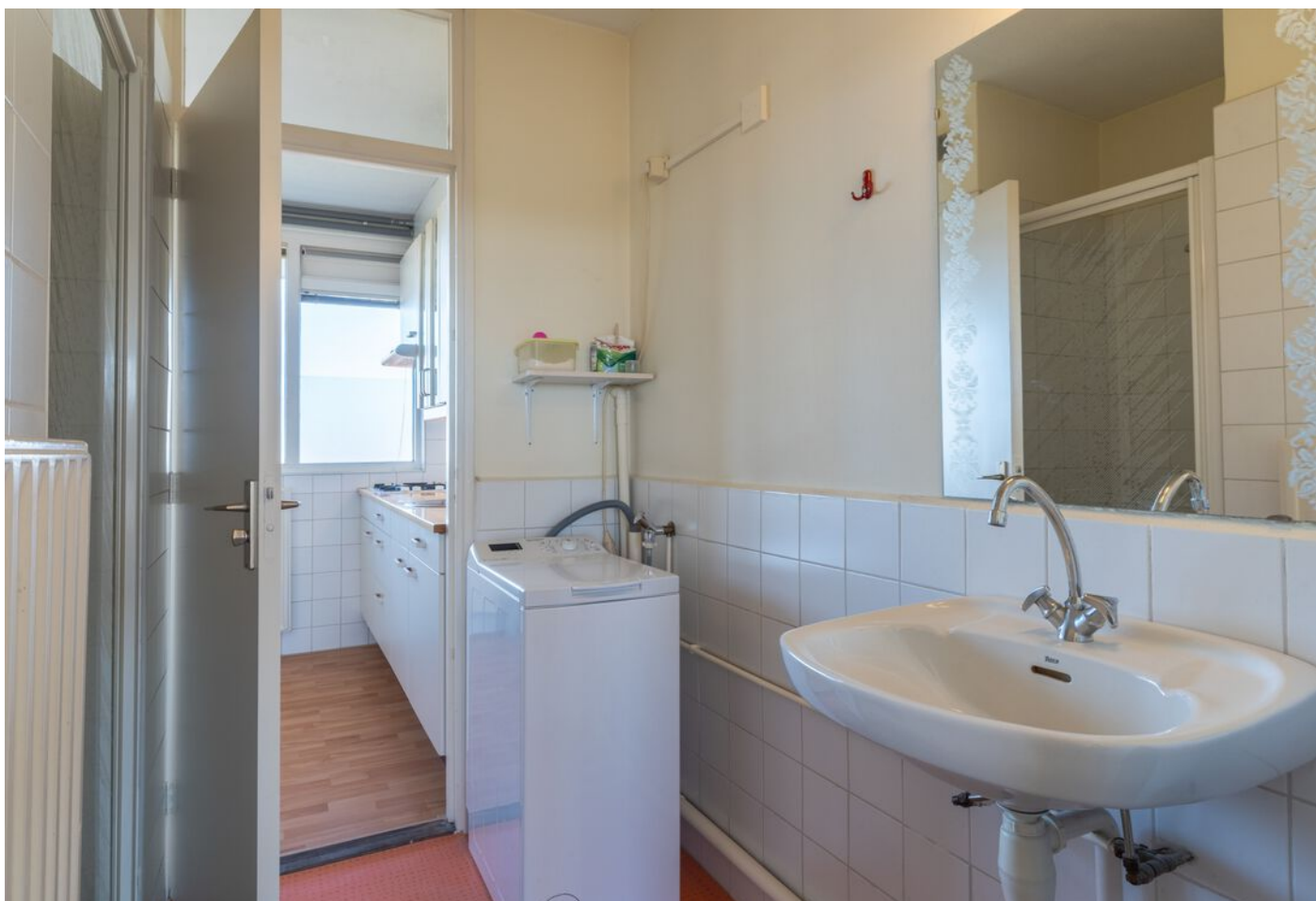
Bowierstraat 87, 's-Hertogenbosch