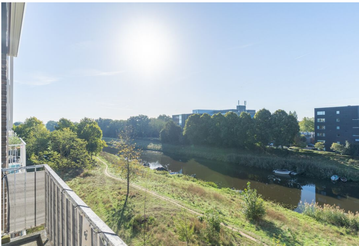
Bowierstraat 87, 's-Hertogenbosch