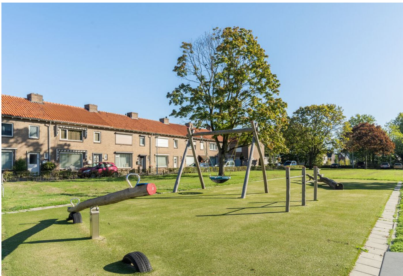
Bowierstraat 87, 's-Hertogenbosch