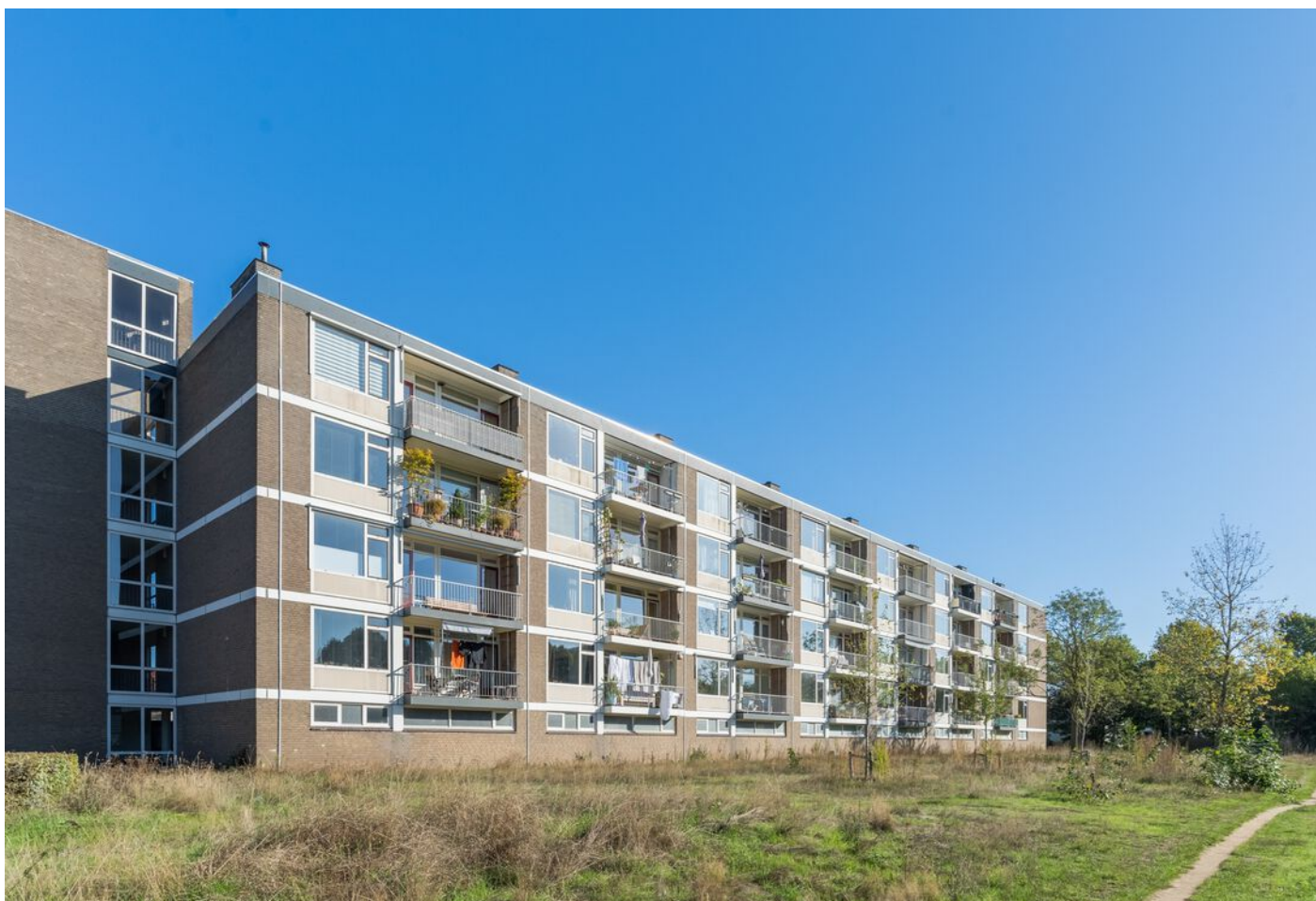
Bowierstraat 87, 's-Hertogenbosch