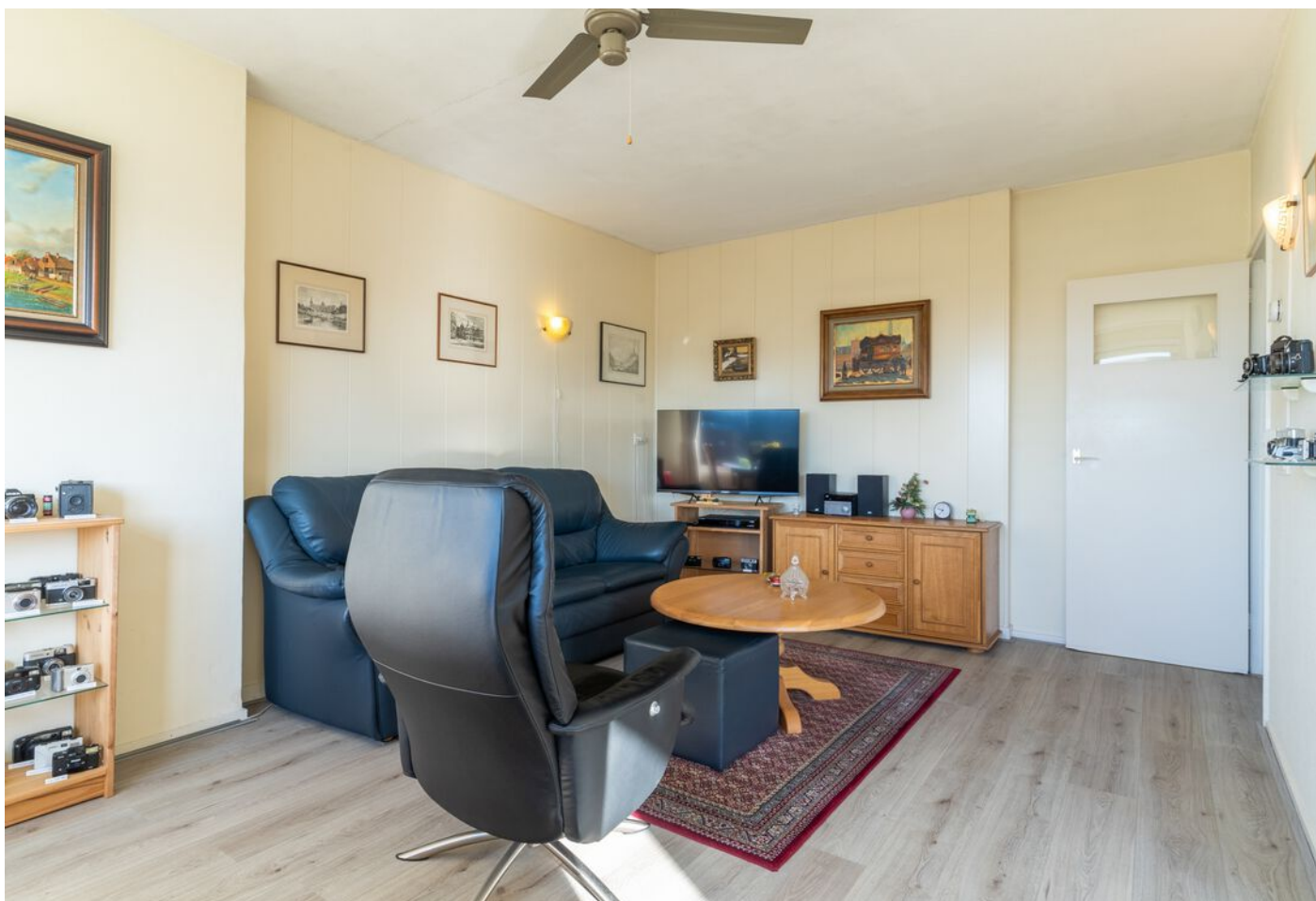
Bowierstraat 87, 's-Hertogenbosch