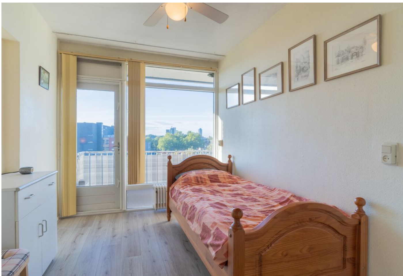
Bowierstraat 87, 's-Hertogenbosch