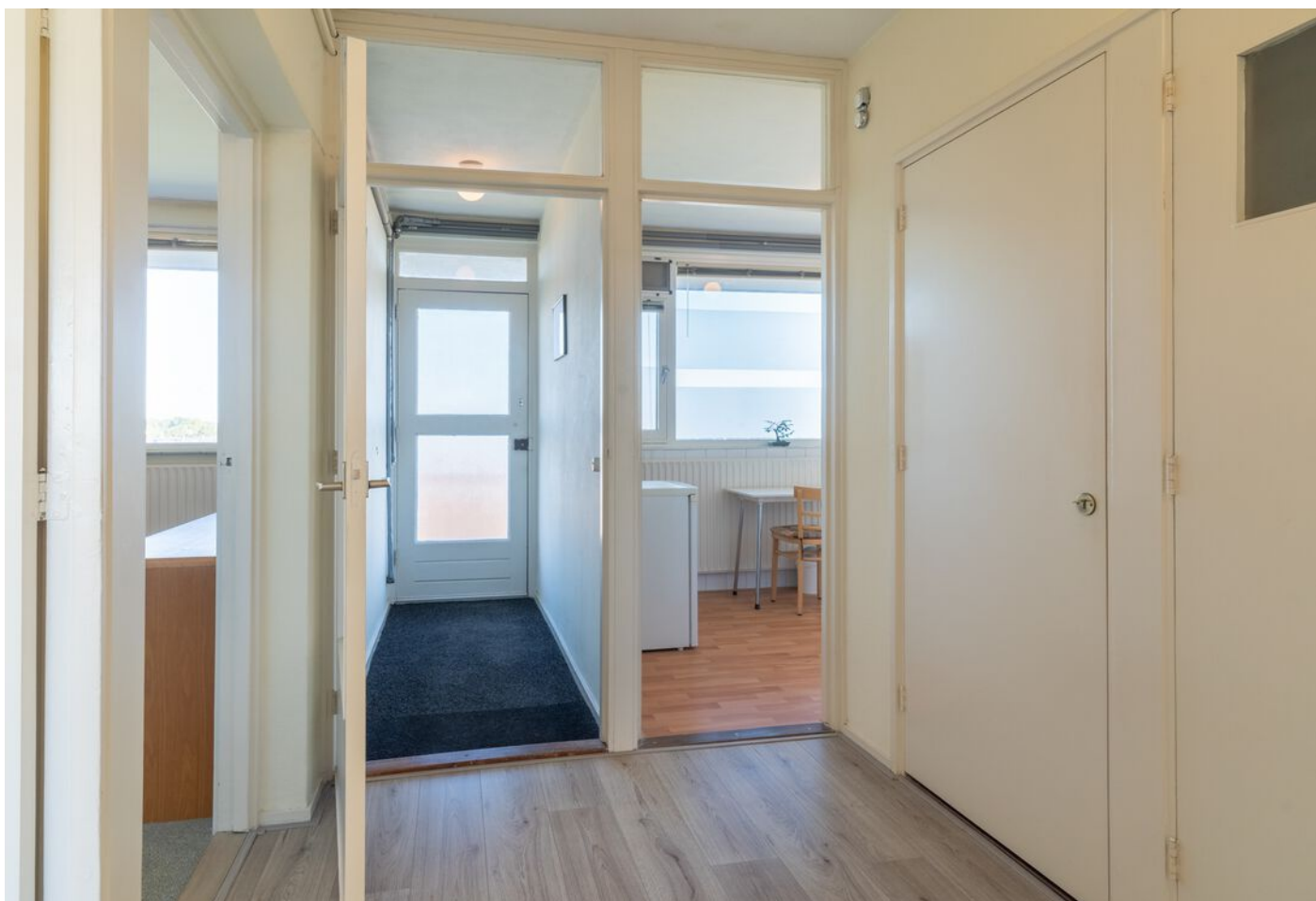
Bowierstraat 87, 's-Hertogenbosch