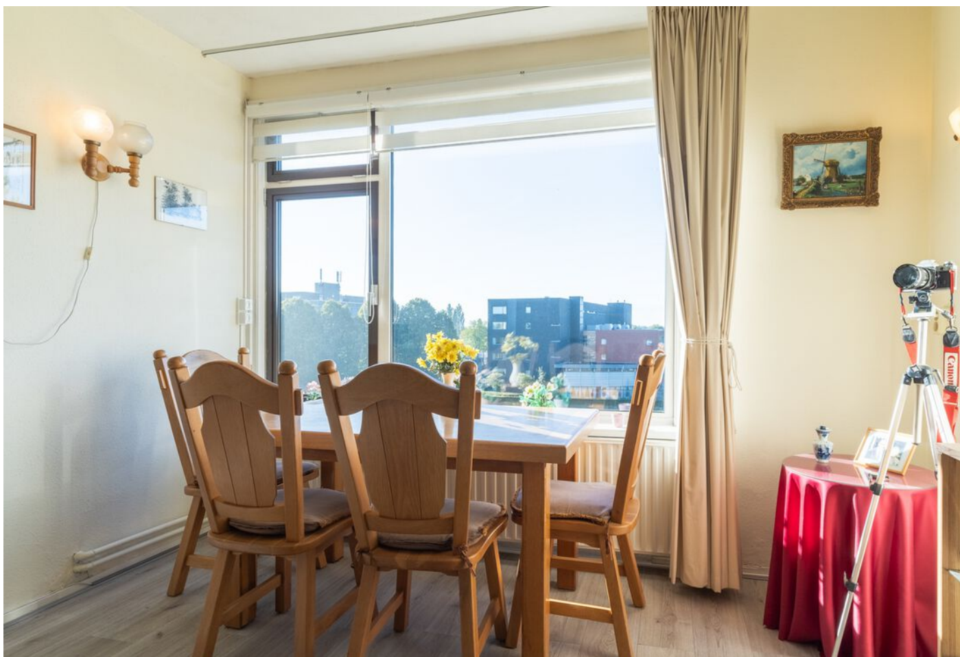
Bowierstraat 87, 's-Hertogenbosch