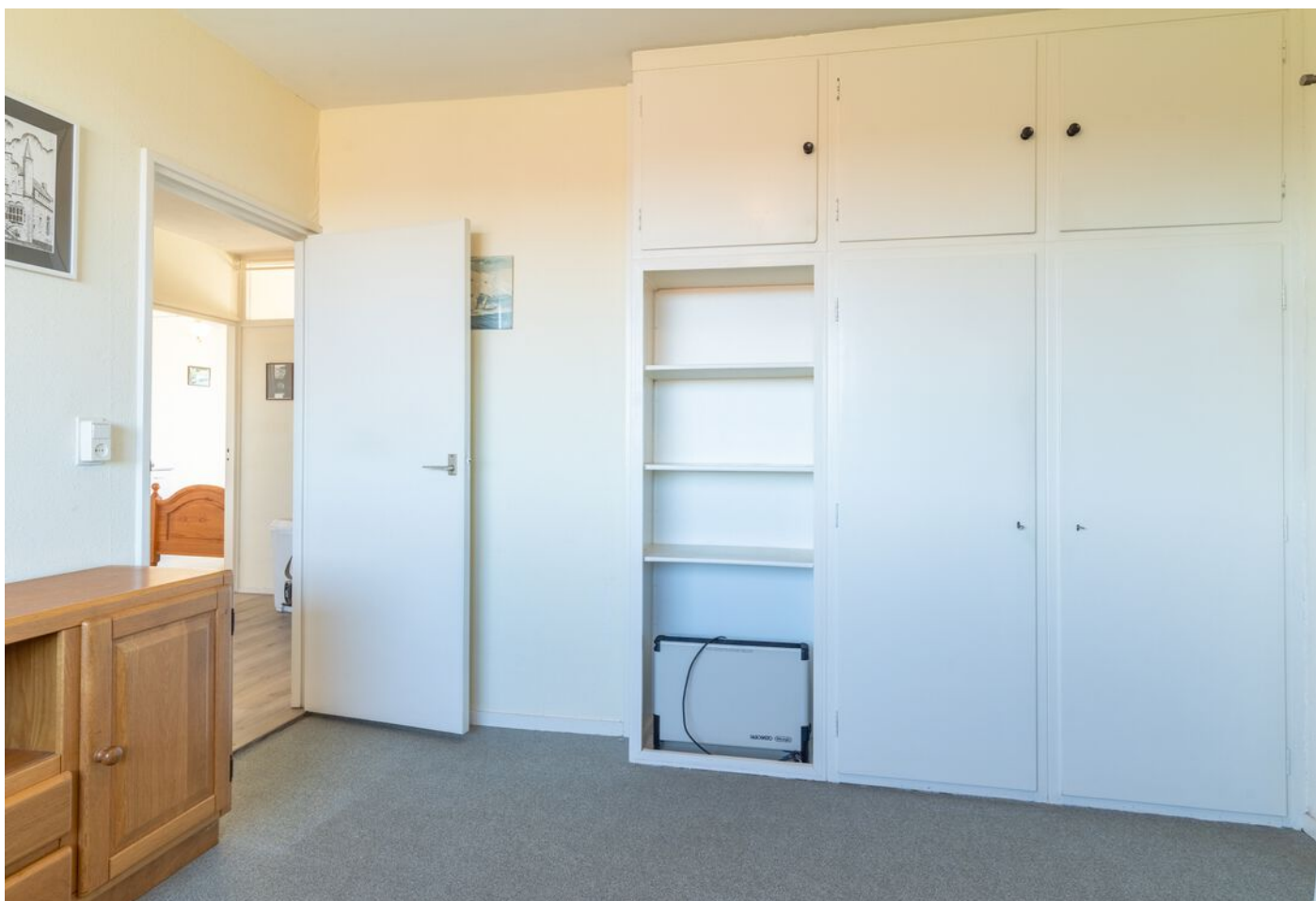
Bowierstraat 87, 's-Hertogenbosch