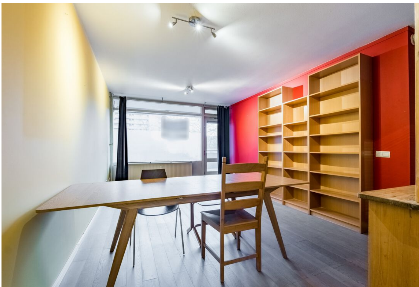
Bomanshof 225, Eindhoven