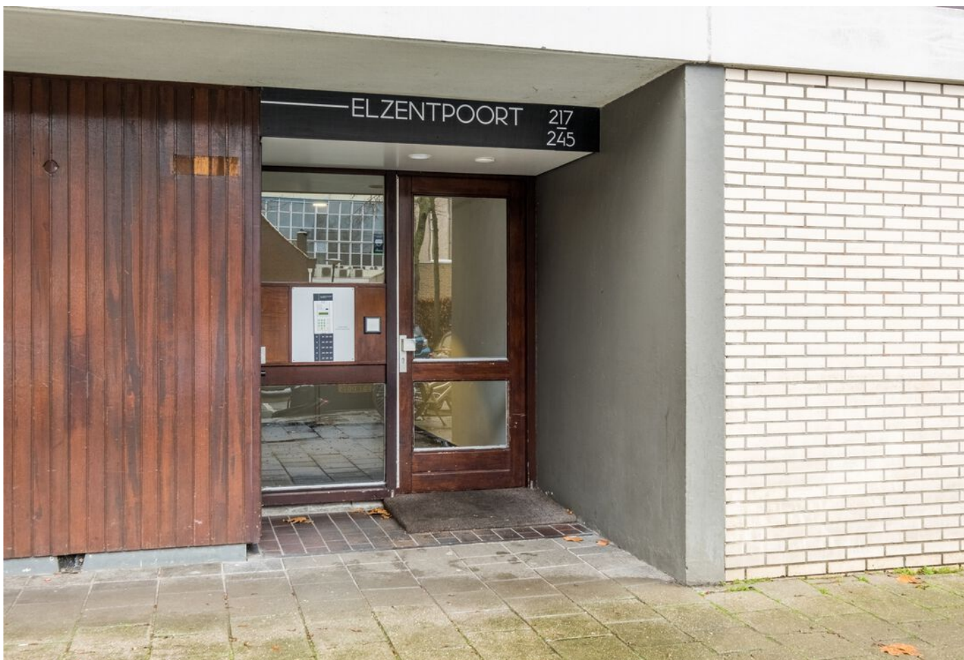
Bomanshof 225, Eindhoven