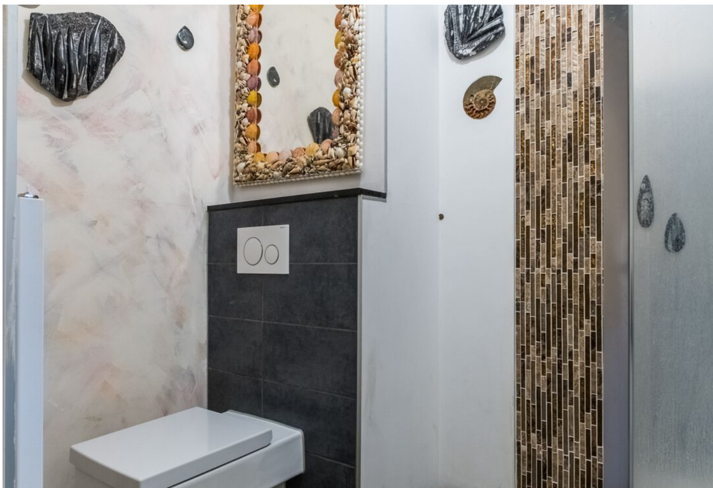
Bomanshof 225, Eindhoven