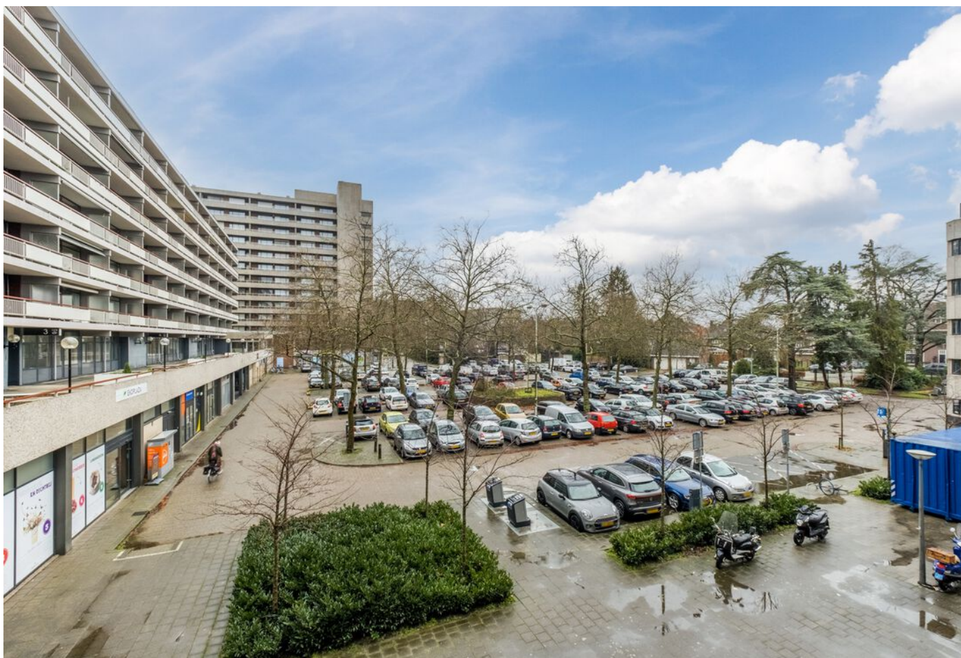
Bomanshof 225, Eindhoven