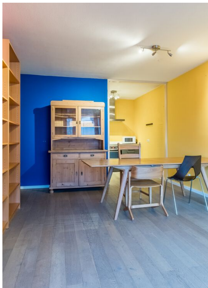
Bomanshof 225, Eindhoven