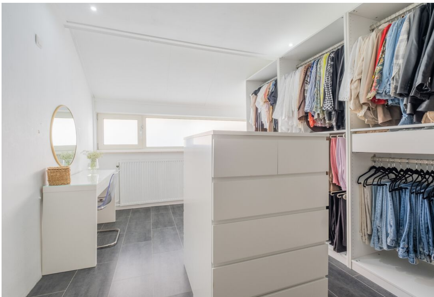
Antwerpenlaan 83, Eindhoven