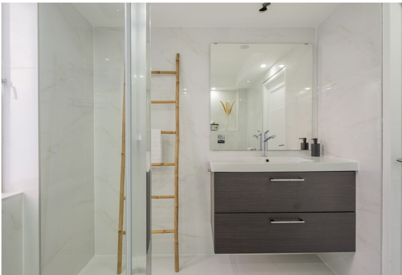
Antwerpenlaan 83, Eindhoven