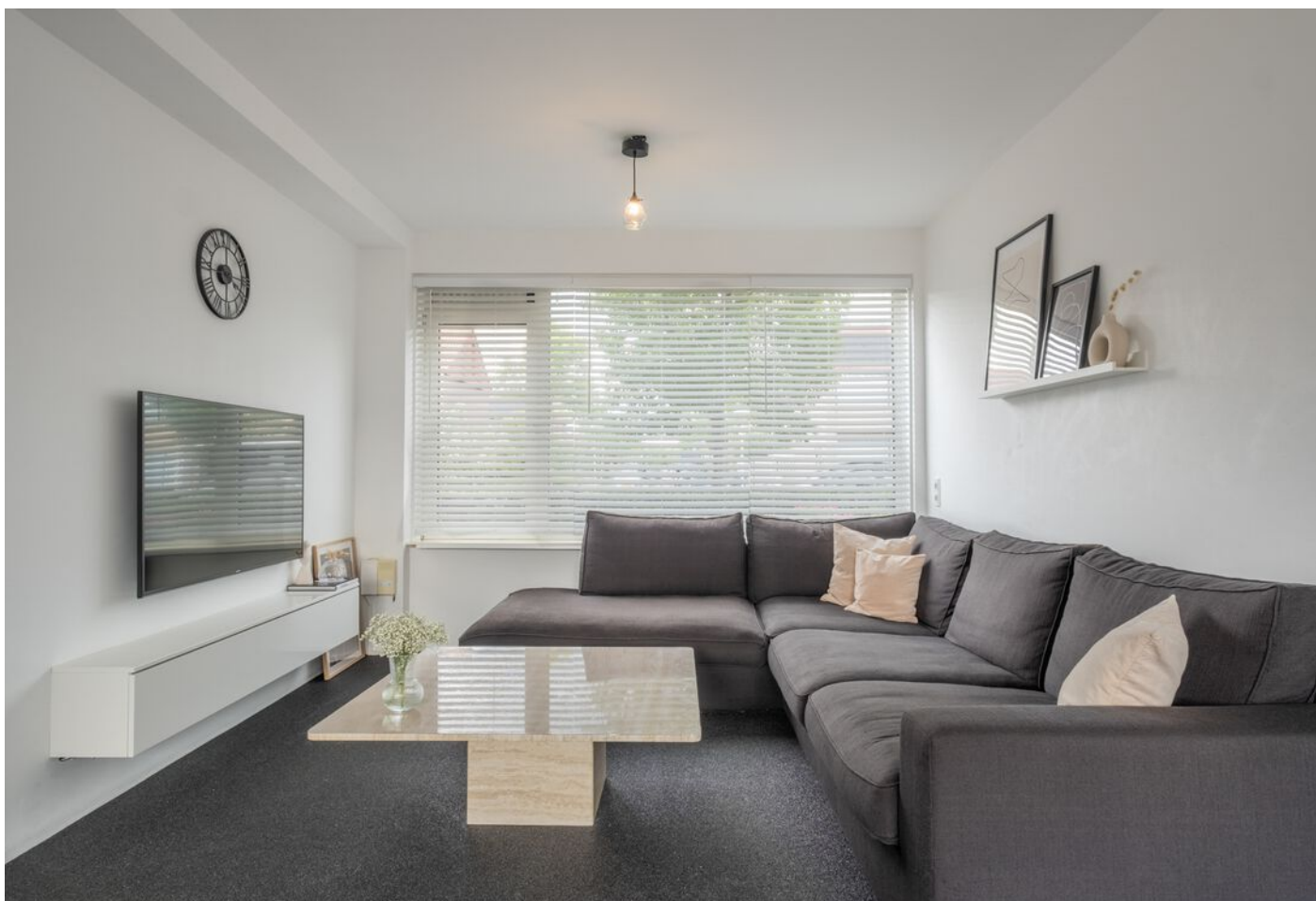
Antwerpenlaan 83, Eindhoven