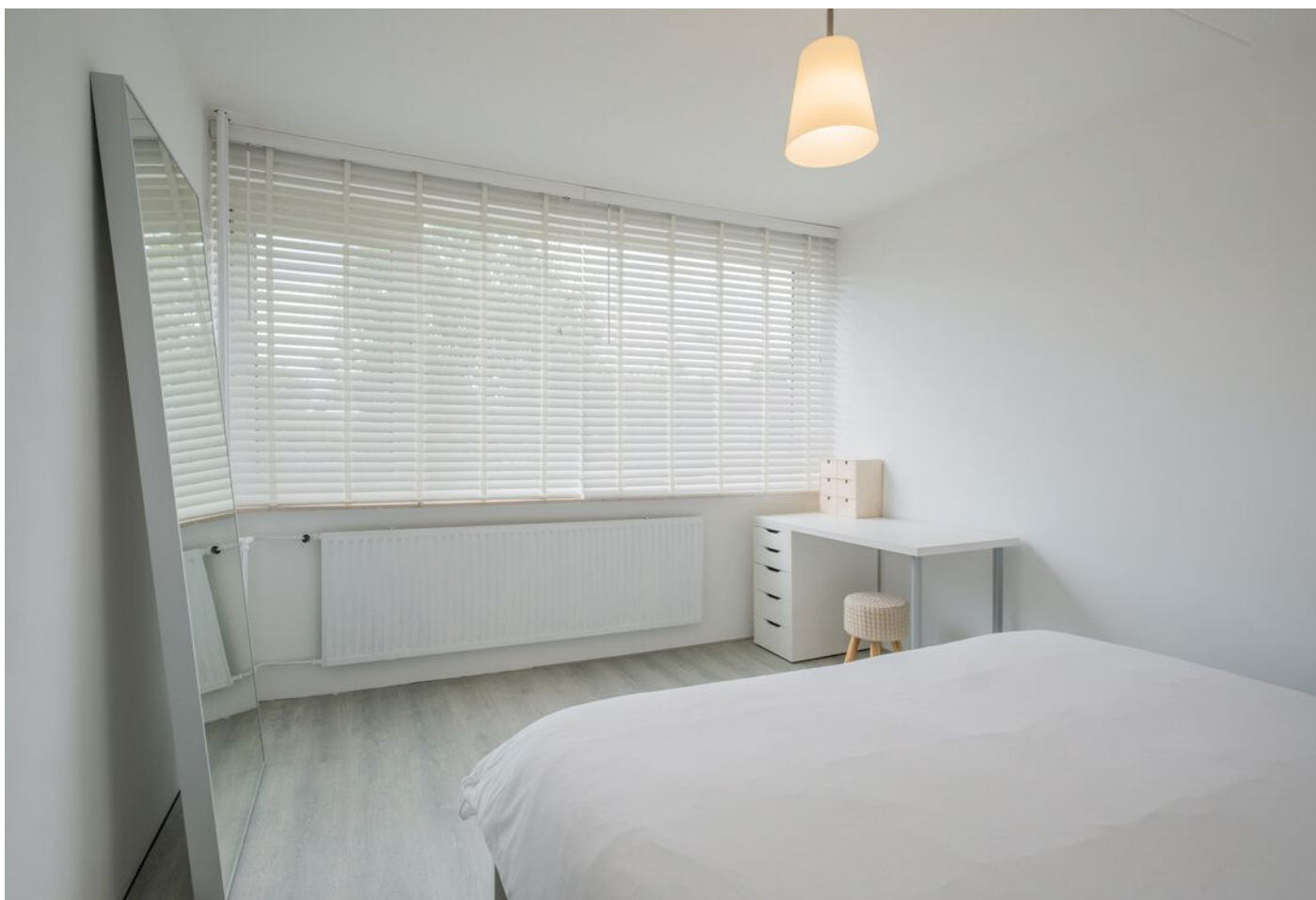
Antwerpenlaan 83, Eindhoven