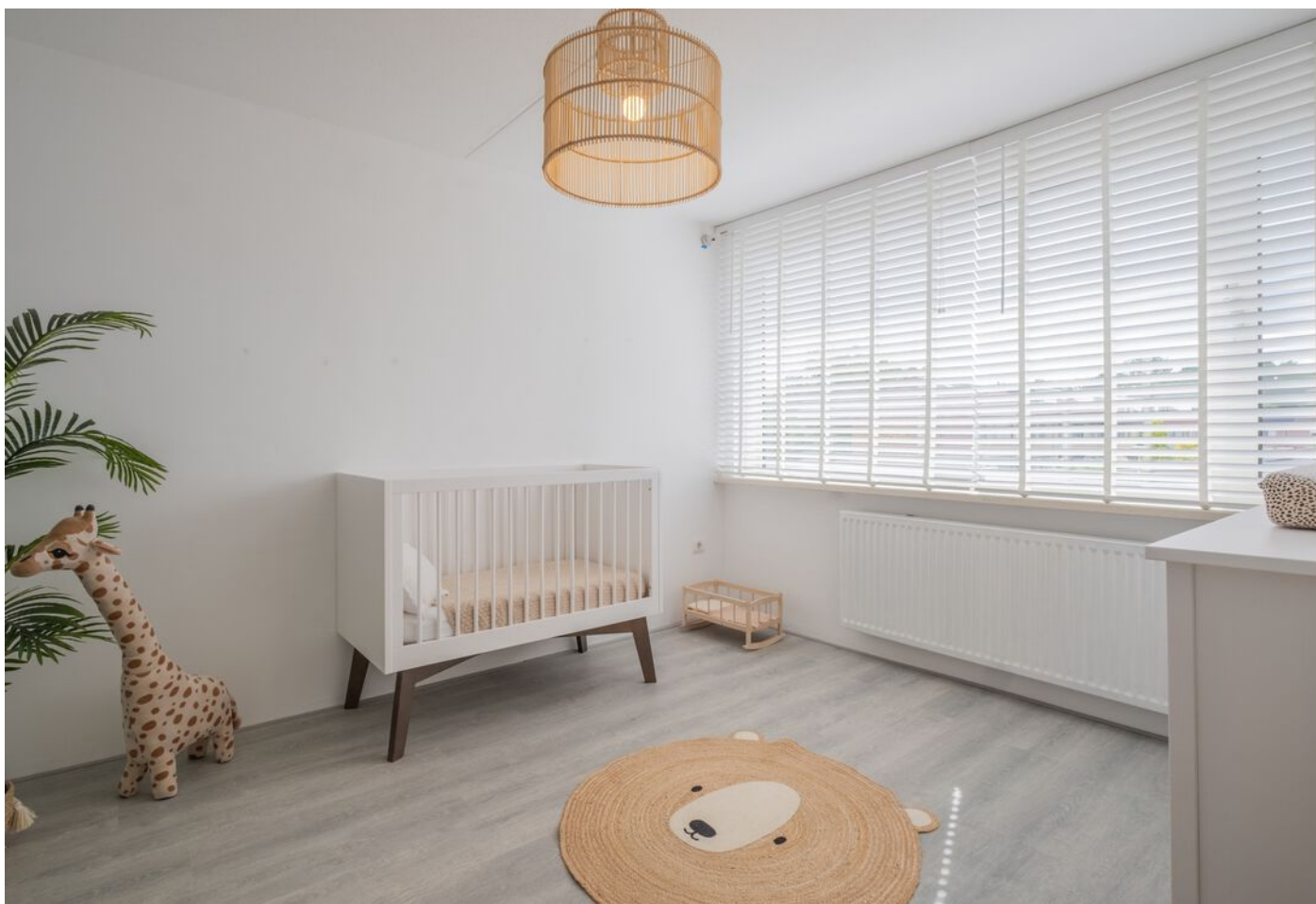
Antwerpenlaan 83, Eindhoven