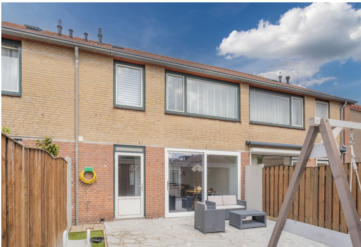
Antwerpenlaan 83, Eindhoven