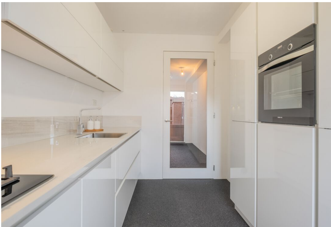
Antwerpenlaan 83, Eindhoven