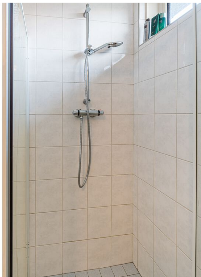
Achelstraat 24, Eindhoven