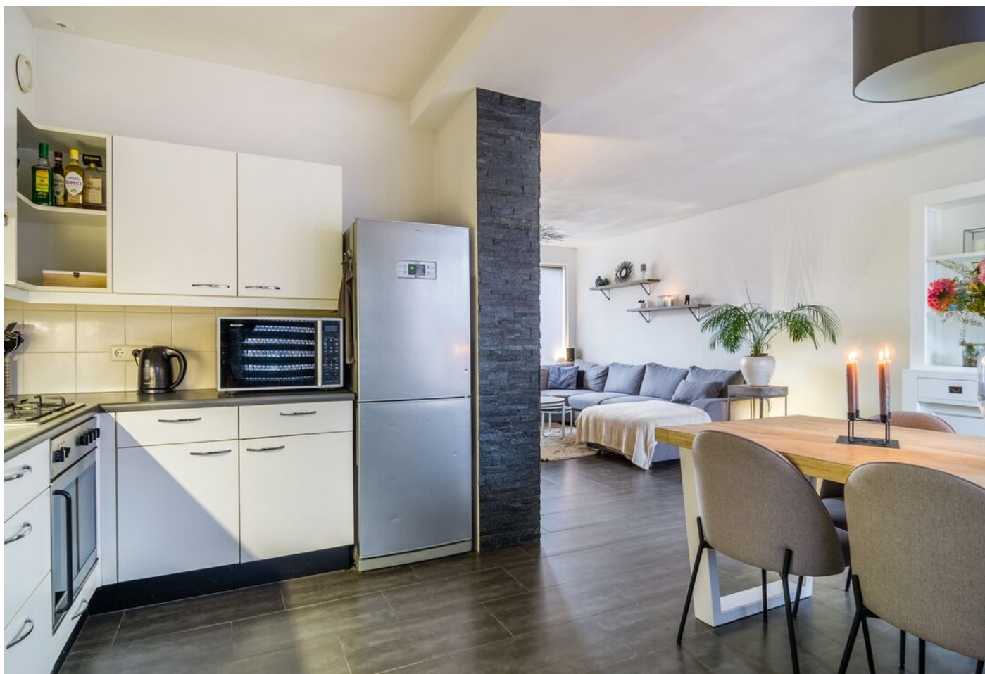
Achelstraat 24, Eindhoven