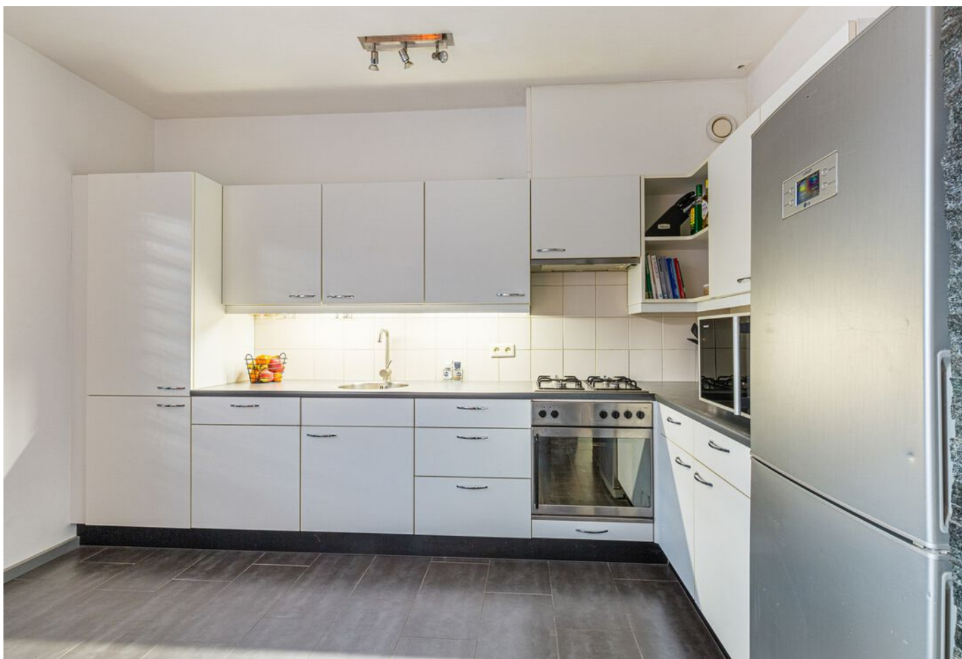
Achelstraat 24, Eindhoven