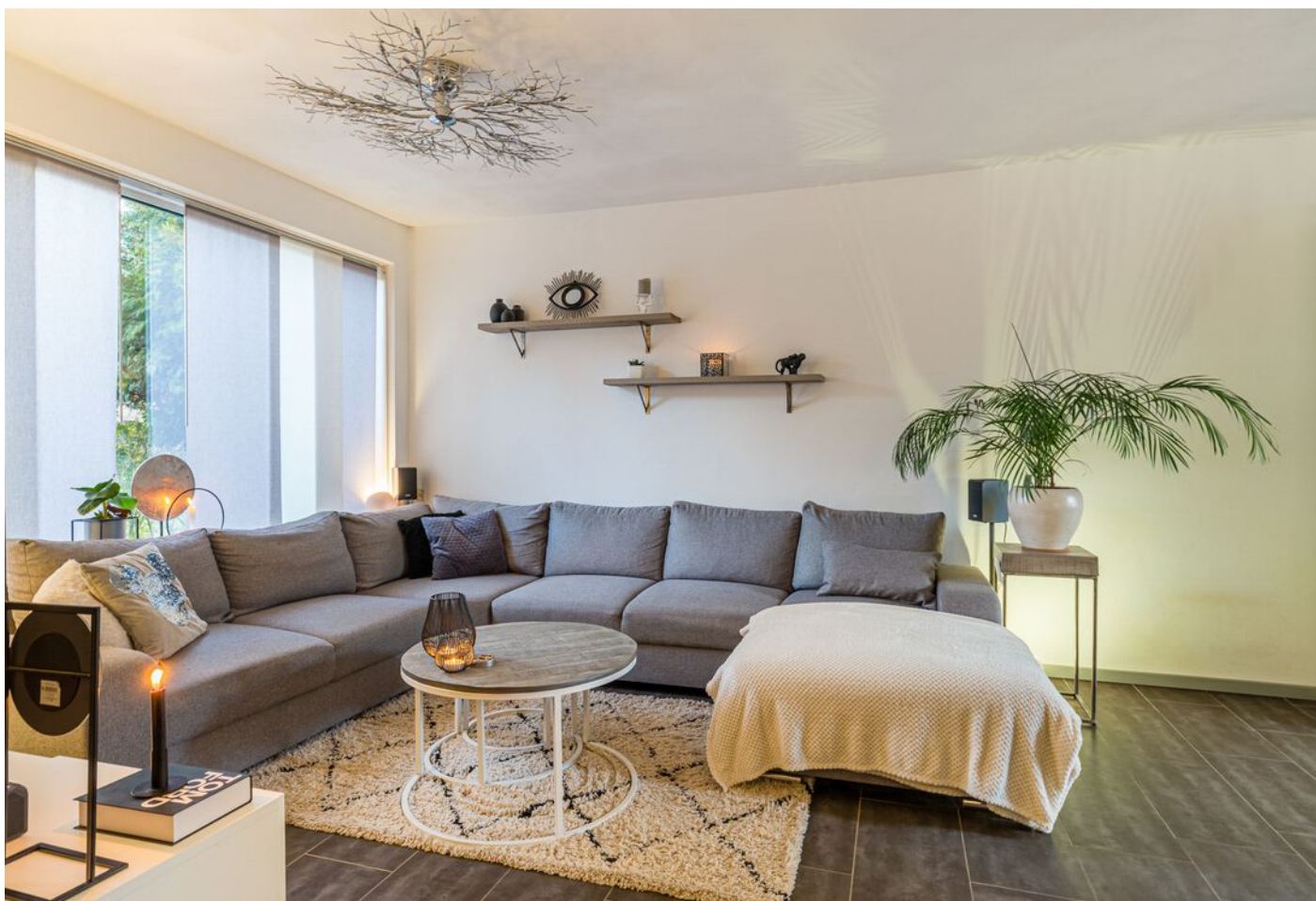
Achelstraat 24, Eindhoven