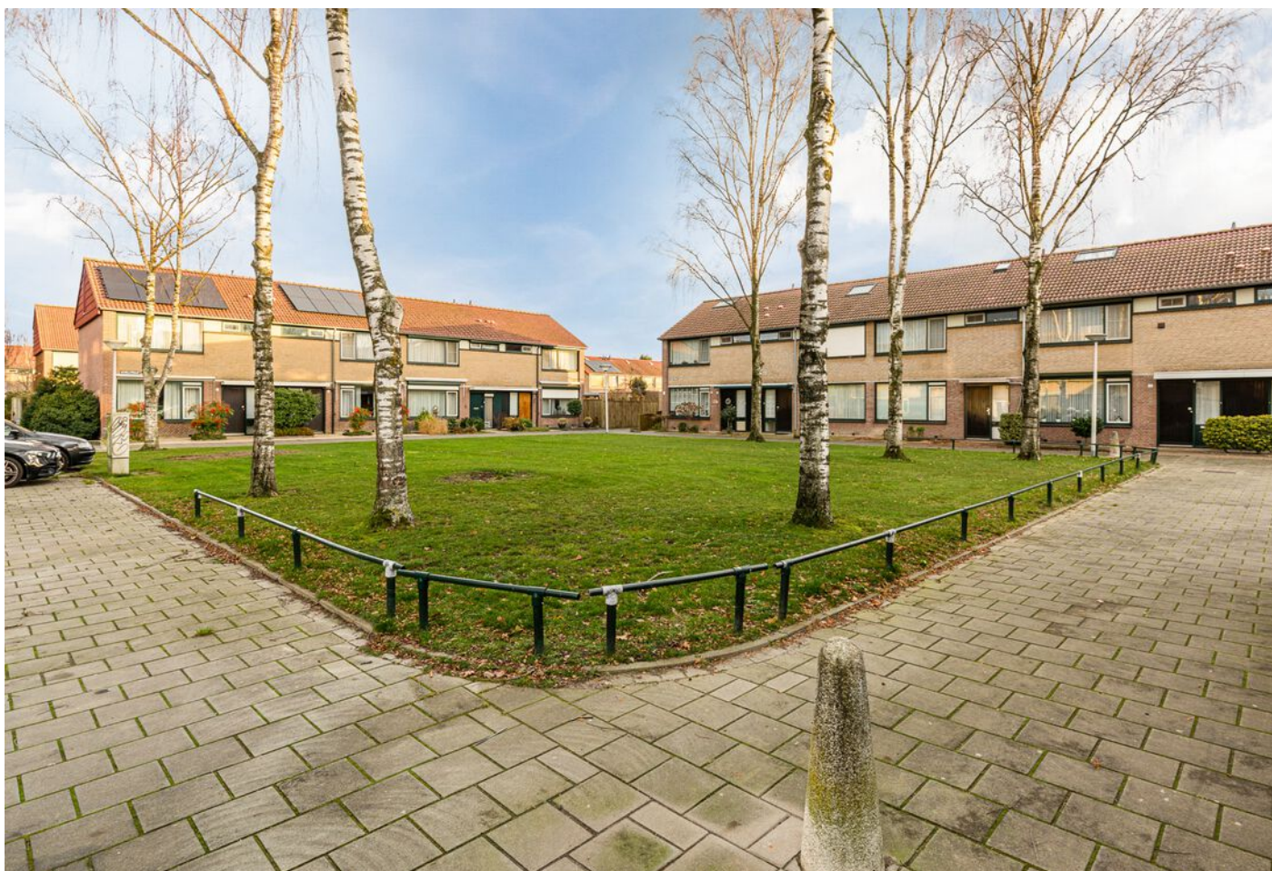
Achelstraat 24, Eindhoven