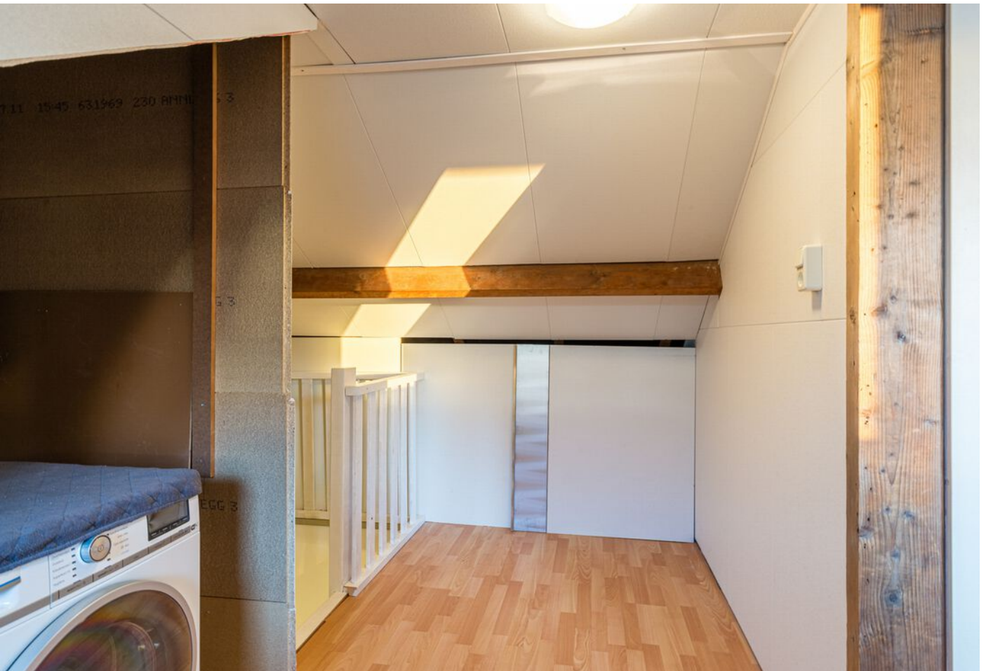
Achelstraat 24, Eindhoven