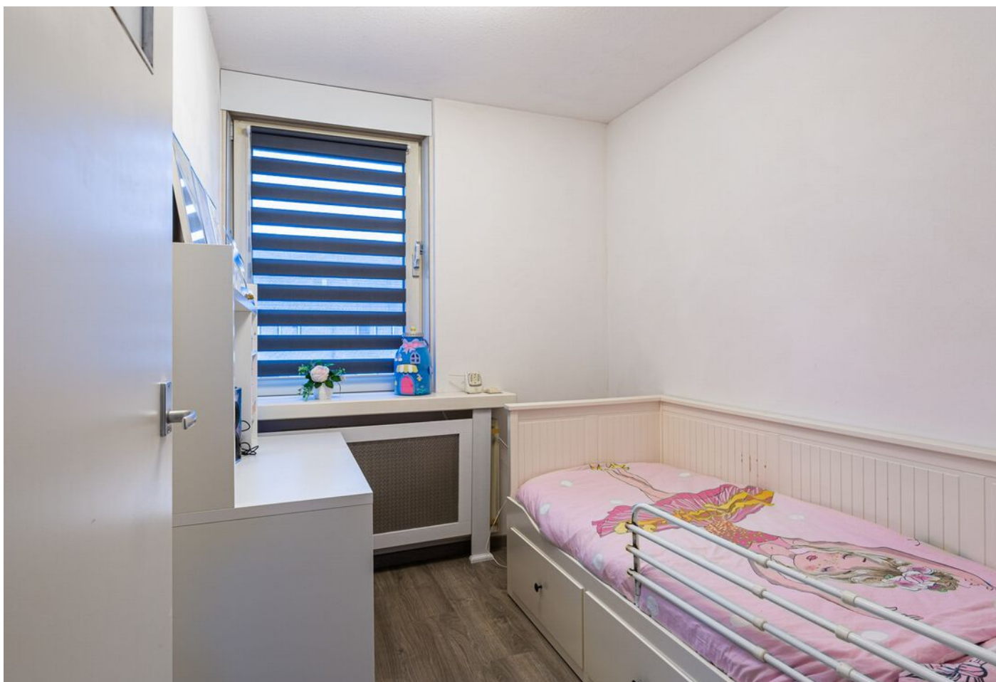
Achelstraat 24, Eindhoven