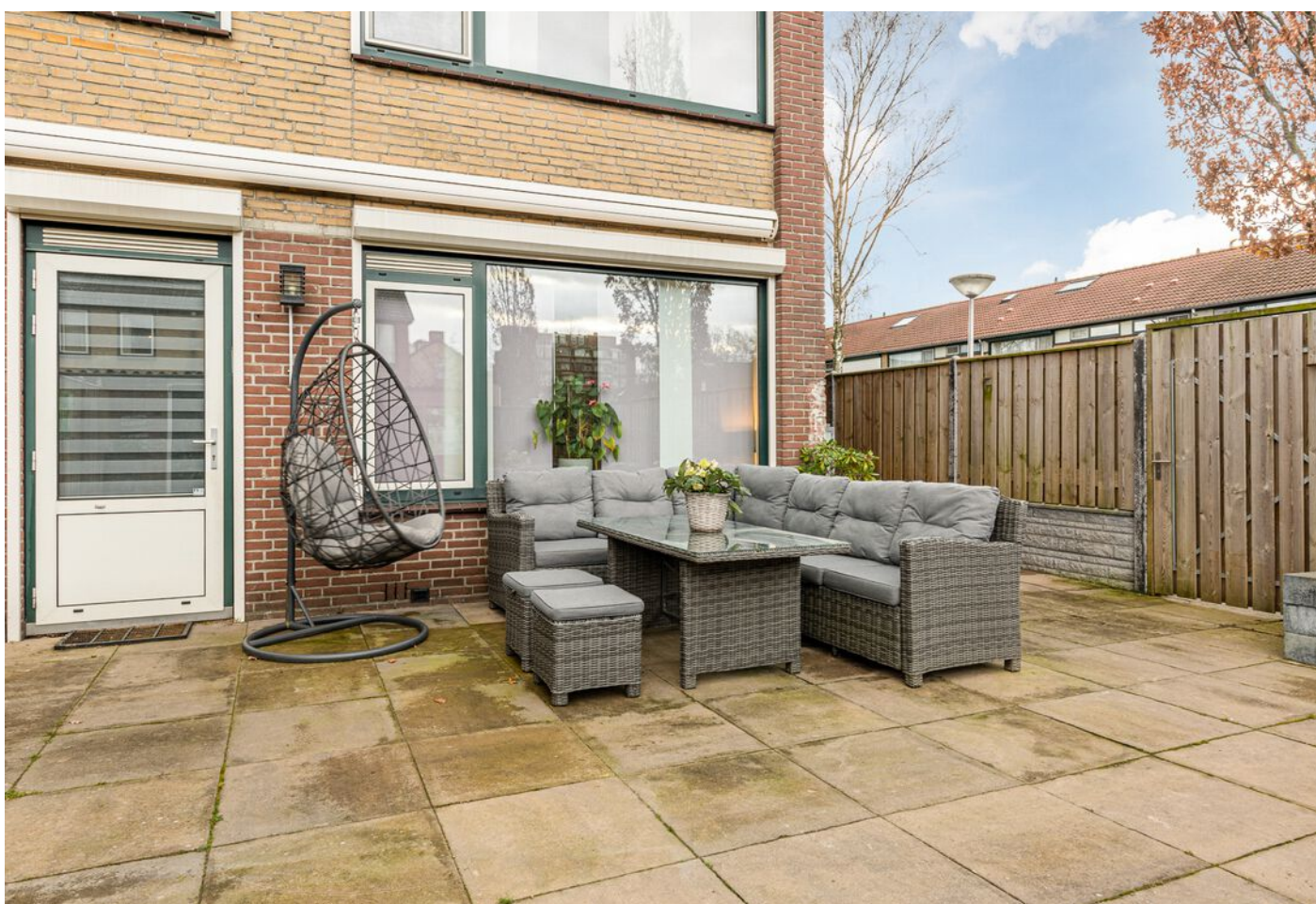
Achelstraat 24, Eindhoven